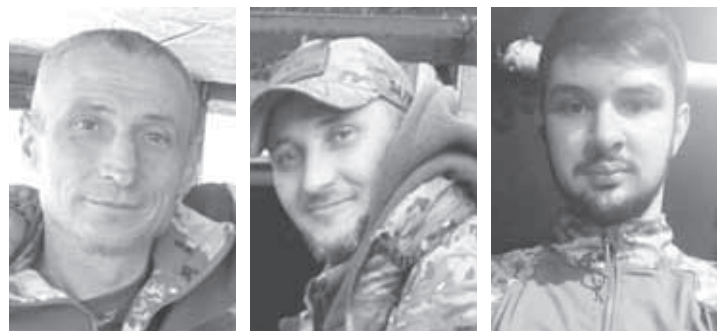
ПАМ'ЯТІ СЕРГІЯ, АНДРІЯ, ЄВГЕНА