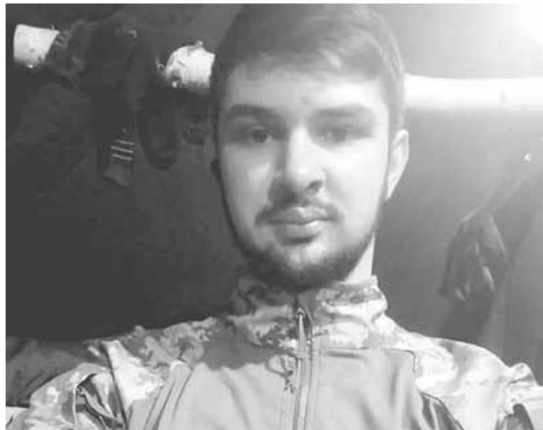
Євгену назавжди 24. Вічна пам'ять Герою!