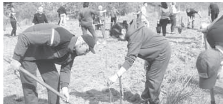
У ЧЕСТЬ ГЕРОЯ ПОСАДИЛИ 252 ДУБИ