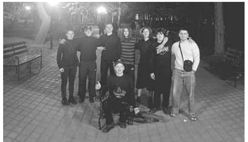
Ці хлопці відпочивали у парку, без порушень та зауважень. Навіть захотіли сфотографуватися в газету