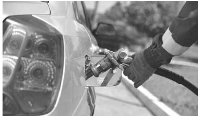
Найдорожча закупівля минулого місяця — пальне. Шість тисяч літрів бензину і дизелю замовили майже за 300 тисяч. Фото ілюстративне

Замовляло Управління освіти та спорту також водовідведення. Угоду підписали із філією «Центр будівельно-монтажних робіт та експлуатації будівель»