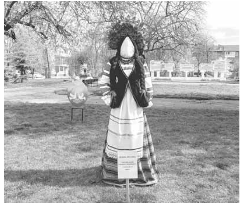
Над створенням цієї красуні працювала ціла команда більше місяця. Висота ляльки 2,1 метра