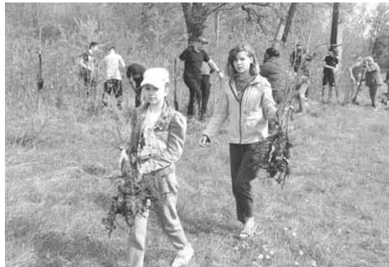
На заході було багато дітей. Активну участь взяли учні місцевого ліцею