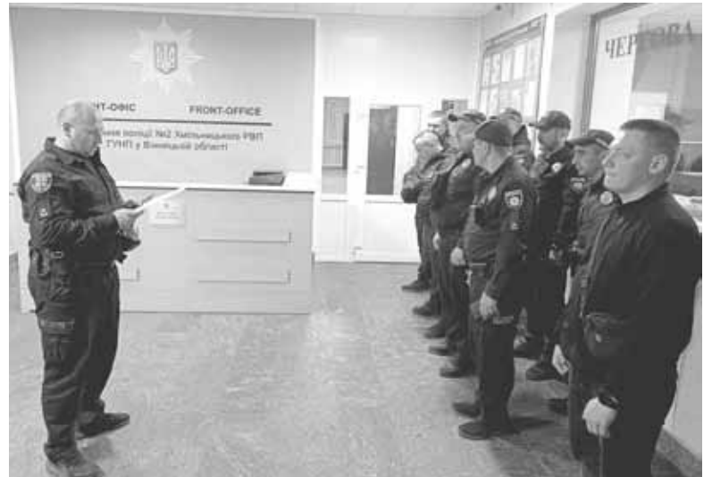
У козятинському відділенні поліції готуються до патрулювання. Завдання — відпрацювання у Козятині та Глухівцях

— Вони в автівці увімкнули музику, відкрили багажник, пили