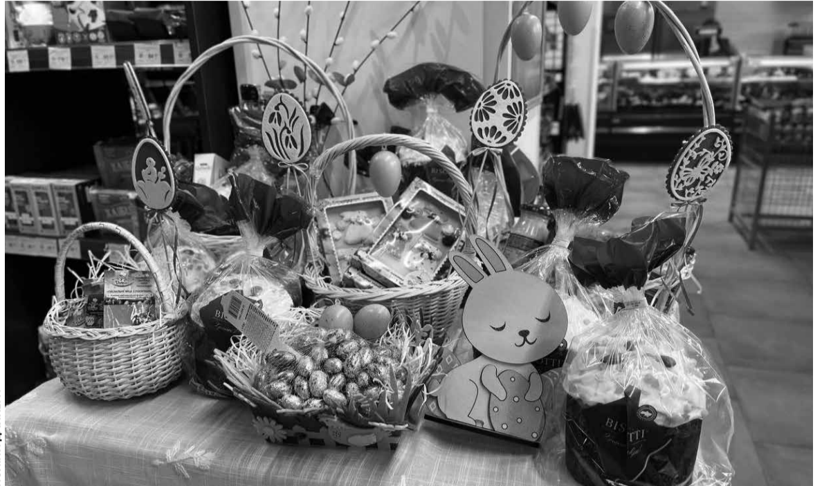
У магазині «Рукавичка» зробили чималу експозицію до Великодня

Щодо цін, то паски маленькі (орієнтовно 150 грамів) коштують 100 гривень. Середні паски вагою 350 грамів – 150 гривень, а великі (450 грамів) – 165 гривень.