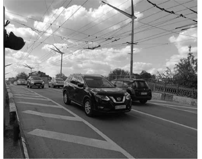
Кількість смуг для проїзду зменшили до двох

Затори ■ Залізничний міст біля технічного університету, який сполучає вулицю Руську та проспект Бандери, визнали аварійним. Через це там ввели обмеження на великогабаритний транспорт та кількість смуг для проїзду. Чи планують ремонтувати міст?