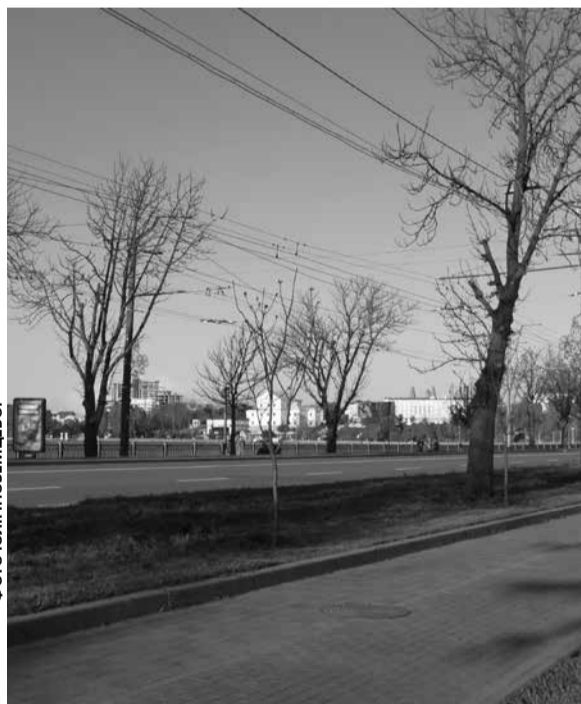
Дерева посадили вздовж дороги, на зеленій алеї зі сторони «Сопільче»

— Катальпа завезена до нас з Південної Америки. І, як показала практика вирощування цих дерев у «Сопільче», проблем із висадкою на дамбі нашого Ставу не мало б бути. Це гарний вид, який створює затінок, має декоративну цінність, а також поглинає деякі викиди газів під час згоряння палива, що принесе позитив для екології, — пояснювала викладачка.