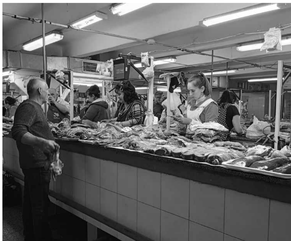
У м'ясному павільйоні є великий вибір свинини