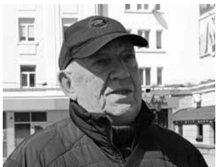
ЖІНКАМ ЦЕ НЕ ПІД СИЛУ ІГОР, 79 РОКІВ, ПЕНСІОНЕР.