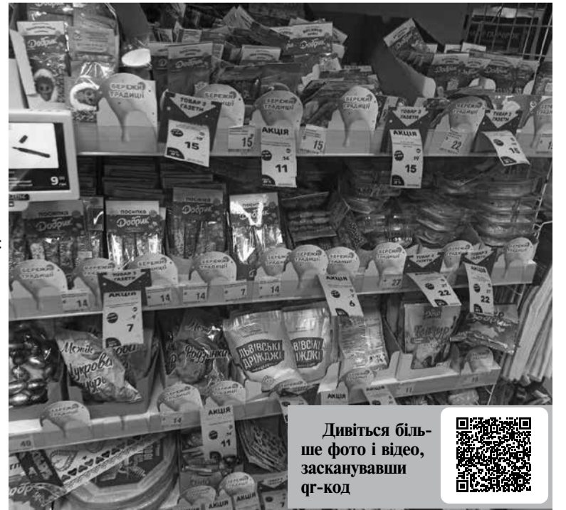
Святкова атрибутика в магазинах є на різній гаманець

У магазині можна знайти паперові форми для випічки паски 500 г – 5,99 гривні. Також тут є в наявності декоративні кошачки, ціна – від 84 до 299 гривень. Ще тут є хороший вибір посипки на паску, ціни від 6 до 14 гривень.