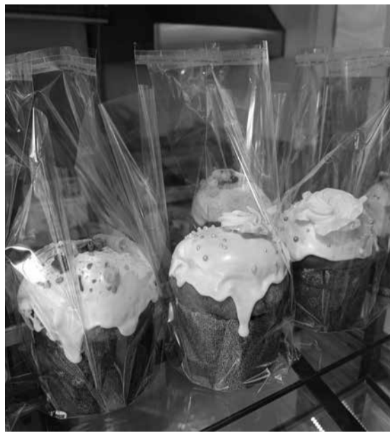
Є великодню випічка з цукатами, горіхами, але коштує від 110 гривень