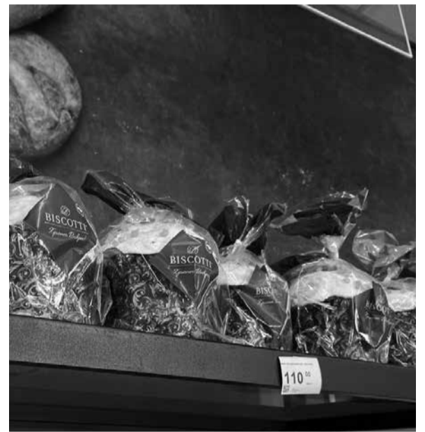
У пекарні пропонують паски з різними начинками та прикрасами