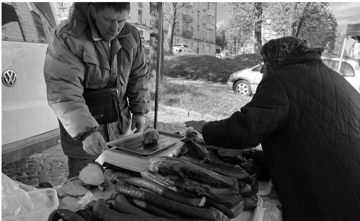
Чимало ковбасних та готових м'ясних виробів пропонують споживачам