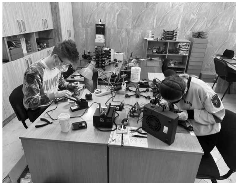
Деталі для дронів замовляють у Німеччині, Нідерландах, а також Україні

— Найдешевший дрон — 15500 гривень. Він долає відстань до п'яти кілометрів, може взяти півтора кілограма навантаження. У комплекті є дрон, антена для відеозв'язку, чотири пропелери та батарея. Друга версія — дрон на дев'ять дюймів, який долає відстань до восьми кілометрів і коштує 18500 гривень. Третя версія за 20500 гривень — летить до 17 кілометрів, є камера нічного бачення, — детально розповідає пан Степан. — Менші моделі можуть нести до 1,5 кілограма вибухівки, зате летять на більшу відстань — до 10 кілометрів. Їх