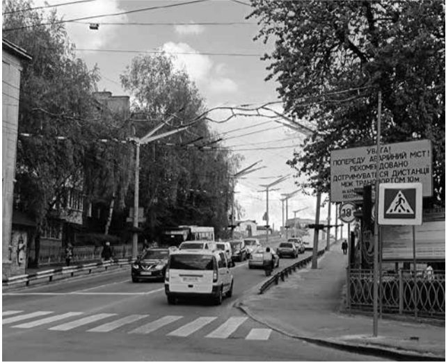
Біля мосту встановили нові дорожні знаки