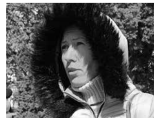
ЖІНКИ НАВЕДУТЬ ПОРЯДОК ЛЮБОВ, 40 РОКІВ, ПЕРЕКЛАДАЧ.

— На мою думку, краще якщо керує розумна жінка, ніж нерозумний чоловік. У нас є багато мудрих жінок, тому нормально бачити їх на керівних посадах.