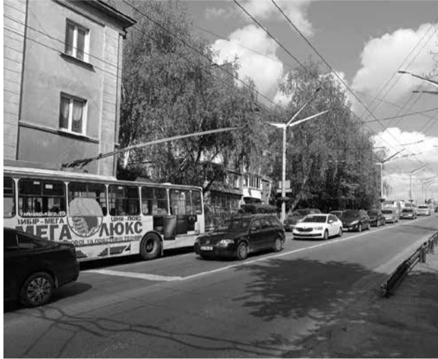
У годину пік там часто затори