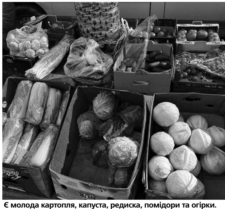
Є молода картопля, капуста, редиска, помідори та огірki. Ціни стартують від 45 гривень