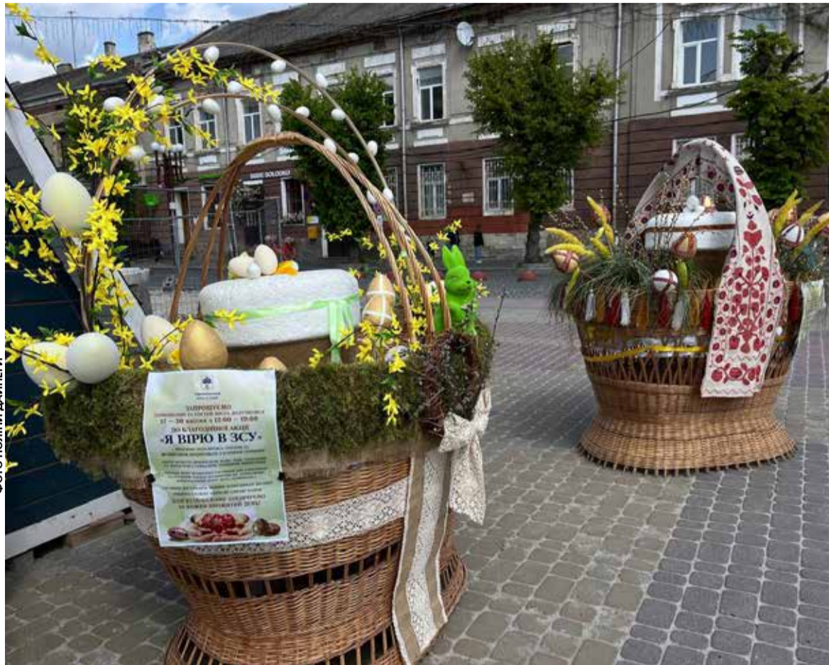
Кошики прикрасили вербовими гілочками, рушниками та іграшками

Під час розмов деякі дивуються такій красі і кажуть, що в інших містах таких інсталяцій не бачили.