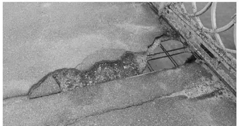
Міст на пішохідній зоні руйнується

— Кількість автобусів на маршруті №1А «вул. Володимира Винничен-