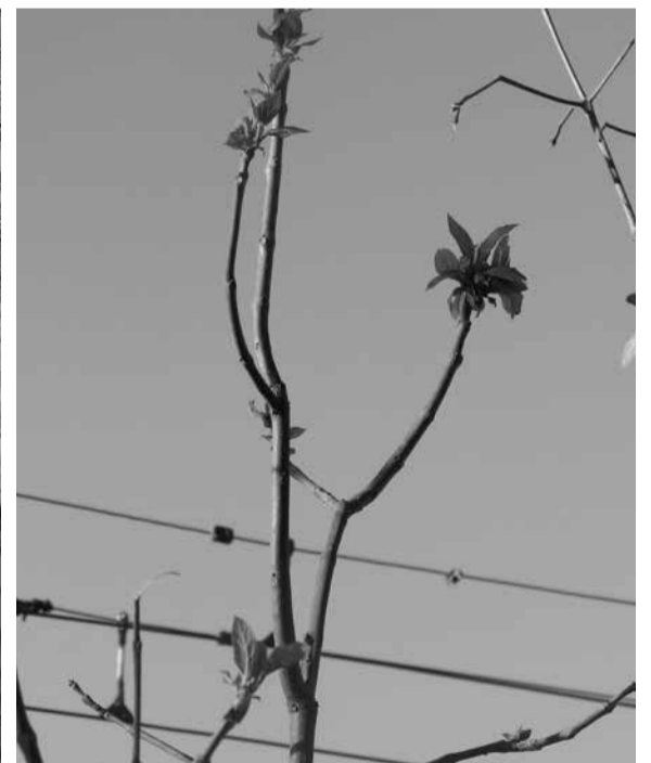
На більшості катальп вже розпускається молоде листя