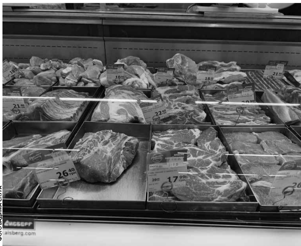
На прилавках супермаркетів є курятина, свинина та яловичина