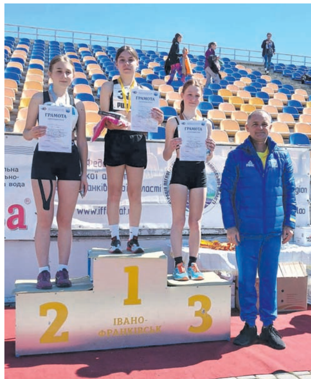
Легкоатлетичний п'єдестал – увесь романівський

20-21 квітня 2024 року підопічні романівського тренера А. Ц. Сушицького взяли участь у кубку Романа Вірастюка, що проходив в Івано-Франківську.