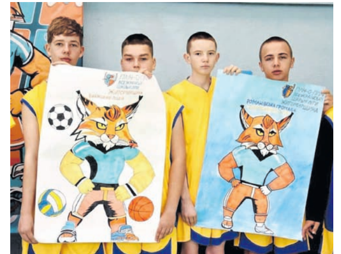
Юні волейболісти із Биківки у фіналі «Пліч-о-пліч»

У суботу, 20 квітня 2024 року, відбулися фінальні змагання ігор «Пліч-о-пліч» серед навчальних закладів Житомирського району.