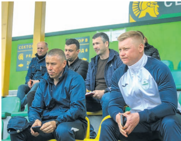
Учасники наради від Романова з питань організації футбольного чемпіонату

У Житомирі 16 квітня 2024-го року відбулася нарада представників футбольних федерацій від більшості громад Житомирщини. У ході наради було досягнуто згоди щодо проведення чемпіонату Житомирщини із футболу у новому сезоні 2024-го року.