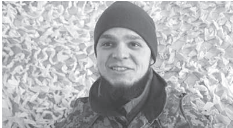
Вчителю з позивним «Лексус» після війни буде що розповісти учням. Він на ділі довів свій патріотизм і любов до рідної держави

— Бувало, їхня піхота штурмувала наші позиції навіть тоді, коли росіяни вели мінометний вогонь, — згадує прикордонник. — Це ж очевидно, що у той час рашисти стріляли також по своїх. Цього не можна було уникнути. Чому тут дивуватися, вони не беруть своїх. У цьому неодноразово переконувався. Ми теж зазнаємо втрат. Проти міномета важко встояти. В артилерії у них перевага. Ну, і в живій