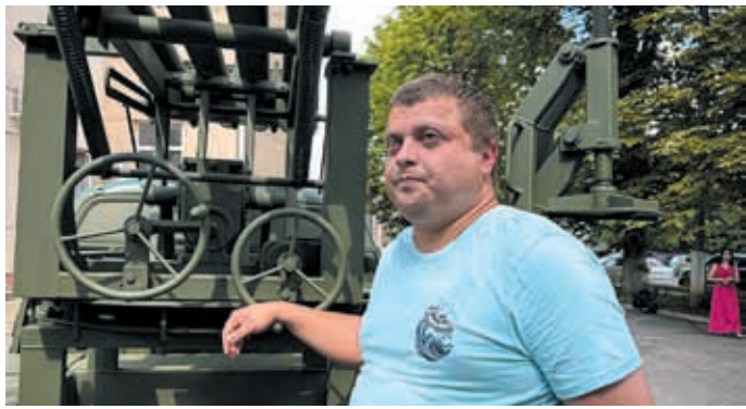
ВІННИЦЬКИЙ МІНІГРАД ЗНИЩИВ ГЕНЕРАЛА