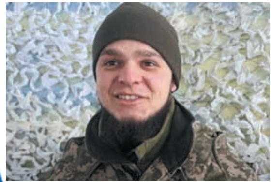
ЯК ВЧИТЕЛЬ ІСТОРІЇ СТАВ ВОЇНОМ