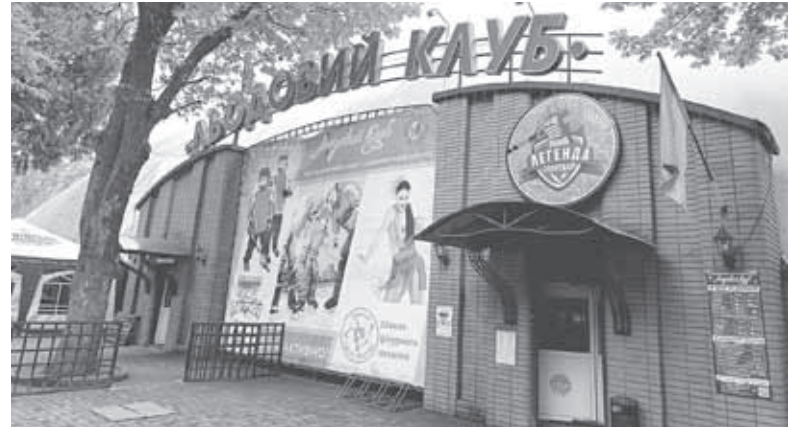
Каток у парку зараз єдине місце, де можна покататися на ковзанах. Льодова арена в «Мегамоллі» ще в березні закрила свій сезон

Льодовий клуб у Центральному парку — єдине місце у Вінниці, де роками тренувалися хокеїсти та займалися фігурним катанням.