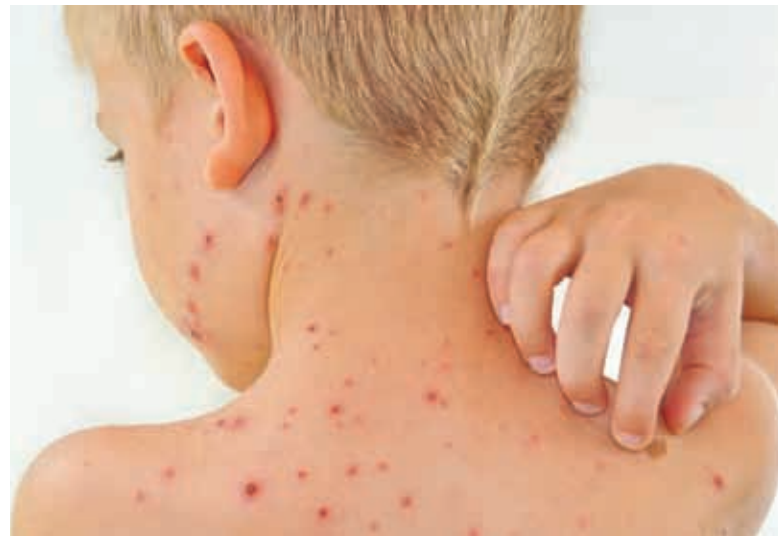
Вітрянка є однією з найбільш поширених інфекцій у світі. Хворіють на неї переважно діти

У Центрі громадського здоров'я МОЗ України пояснюють, що вітряна віспа — одна із найпоширеніших інфекцій у світі. За рівнем захворюва-