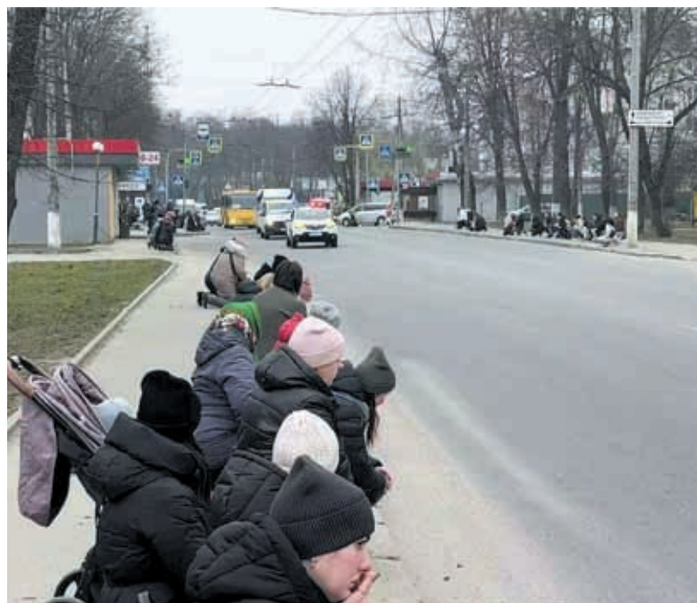
Герой повертається додому. Водії мають зупинитися, пішоходи — опуститися на коліно і покласти руку на серце

Якщо є така можливість, то зупинитися і стати на коліно перед загиблим воїном, зняти головний убір і віддати шану захиснику в хвилині мовчання.