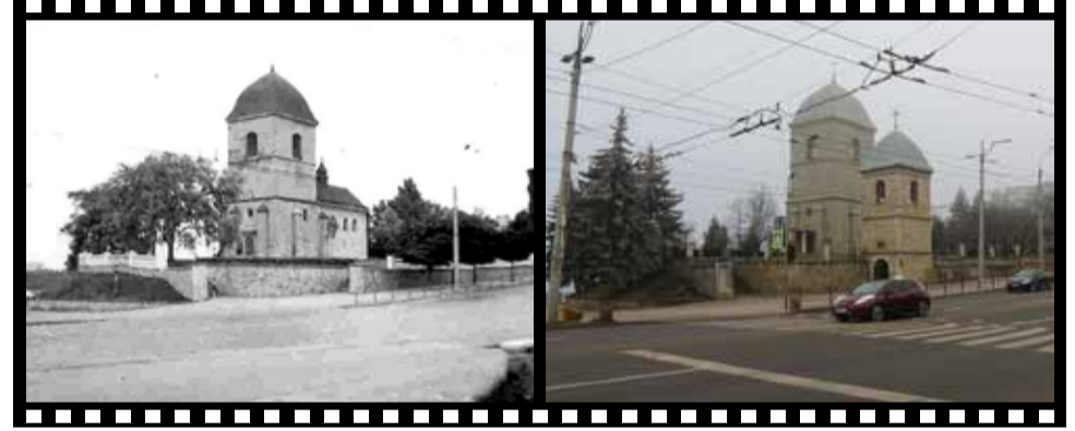
БУЛО: У 1977 році біля храму ще не було дзвіниці, яку зруйнували під час війни