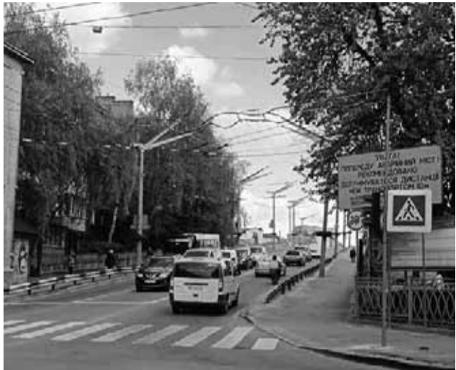
Біля мосту встановили нові дорожні знаки