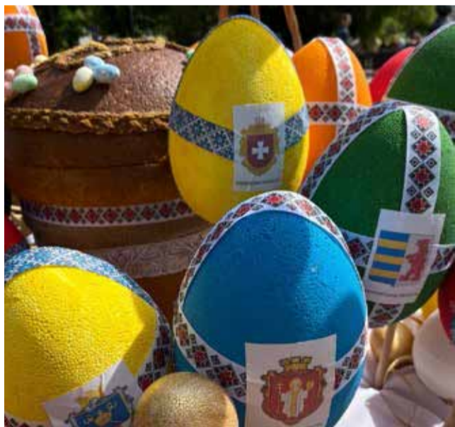
У деяких кошиках є крашанки з гербами різних регіонів України