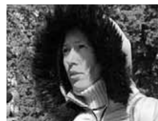
ЖІНКИ НАВЕДУТЬ ПОРЯДОК ЛЮБОВ, 40 РОКІВ, ПЕРЕКЛАДАЧ.

— На мою думку, краще якщо керує розумна жінка, ніж нерозумний чоловік. У нас є багато мудрих жінок, тому нормально бачити їх на керівних посадах.