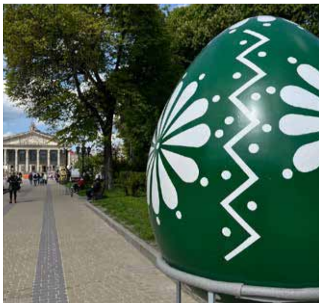
Величезні писанки встановили вздовж бульвару Тараса Шевченка