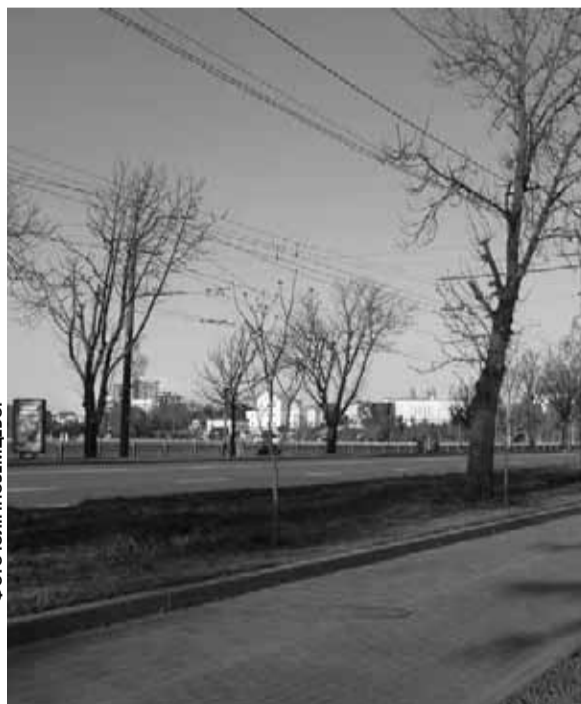
Дерева посадили вздовж дороги, на зеленій алеї зі сторони «Сопільче»

— Катальпа завезена до нас з Південної Америки. І, як показала практика вирощування цих дерев у «Сопільче», проблем із висадкою на дамбі нашого Ставу не мало б бути. Це гарний вид, який створює затінок, має декоративну цінність, а також поглинає деякі викиди газів під час згоряння палива, що принесе позитив для екології, — пояснювала викладачка.