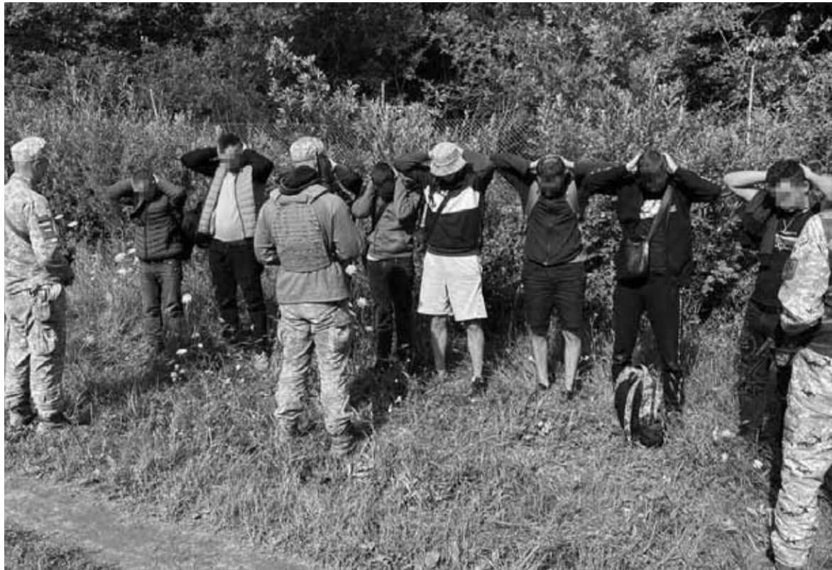
«Утікача» запевнили, що він буде заброньований співробітником підприємства та відряджений до Молдови. За послугу запросили 7,5 тис. доларів

Вирок кременчанці, яка за гроші допомагала чоловікам призовного віку в перетині кордону, проголосив у квітні суд. За статтею 332 Кримінального кодексу України такі вирок журналісти