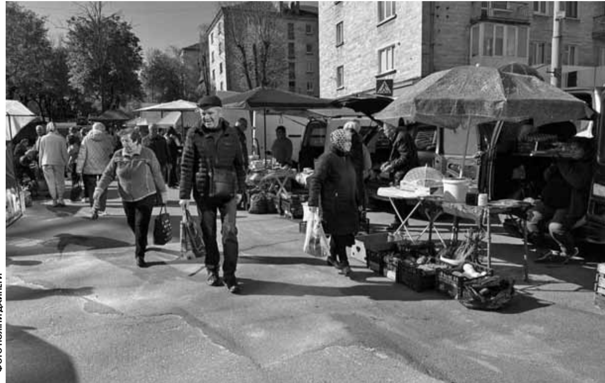
На ярмарок приходять десятки тернополян, аби придбати домашню продукцію

лограм карасів обійдеться вам у 85 гривень.