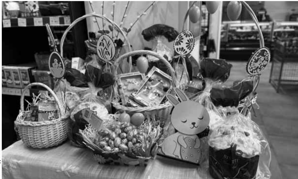
У магазині «Рукавичка» зробили чималу експозицію до Великодня

Щодо цін, то паски маленькі (орієнтовно 150 грамів) коштують 100 гривень. Середні паски вагою 350 грамів – 150 гривень, а великі (450 грамів) – 165 гривень.