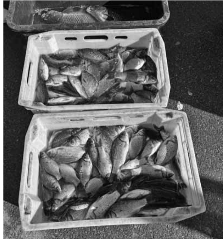
Кілограм карасів у Тернополі коштує від 85 гривень

Зауважимо, великодньої випічки господині ще не приносили. Адже напередодні Великодня запланований додатковий ярмарок — на друге травня. Тоді вже можна буде придбати святкову атрибутику, рушники.