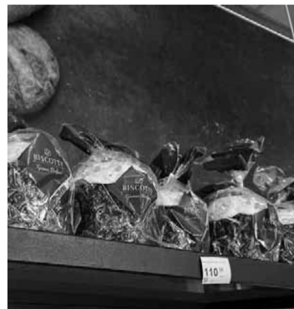
У пекарні пропонують паски з різними начинками та прикрасами