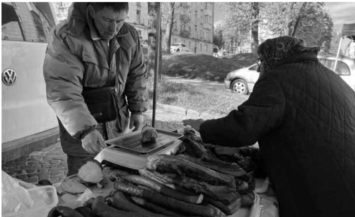
Чимало ковбасних та готових м'ясних виробів пропонують споживачам