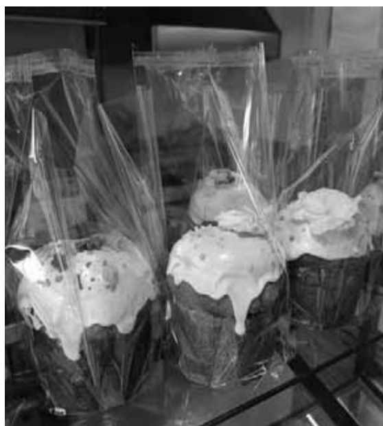
Є великодню випічка з цукатами, горіхами, але коштує від 110 гривень