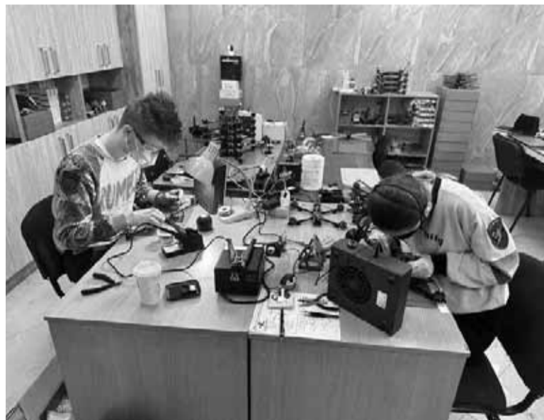
Деталі для дронів замовляють у Німеччині, Нідерландах, а також Україні

— Найдешевший дрон — 15500 гривень. Він долає відстань до п'яти кілометрів, може взяти півтора кілограма навантаження. У комплекті є дрон, антена для відеозв'язку, чотири пропелери та батарея. Друга версія — дрон на дев'ять дюймів, який долає відстань до восьми кілометрів і коштує 18500 гривень. Третя версія за 20500 гривень — летить до 17 кілометрів, є камера нічного бачення, — детально розповідає пан Степан. — Менші моделі можуть нести до 1,5 кілограма вибухівки, зате летять на більшу відстань — до 10 кілометрів. Їх