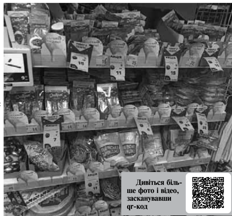
Святкова атрибутика в магазинах є на різний гаманець

У магазині можна знайти паперові форми для випічки паски 500 г – 5,99 гривні. Також тут є в наявності декоративні кошачки, ціна – від 84 до 299 гривень. Ще тут є хороший вибір посипки на паску, ціни від 6 до 14 гривень.