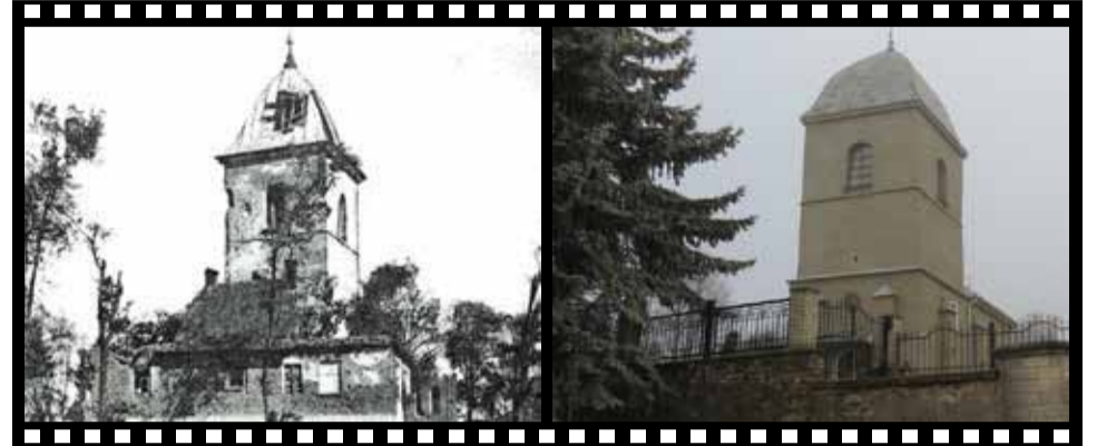
БУЛО: На фото 1944 року церква після ушкоджень від бомбардувань міста