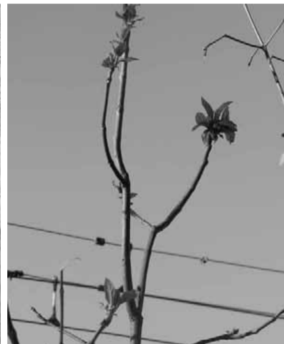
На більшості катальп вже розпускається молоде листя