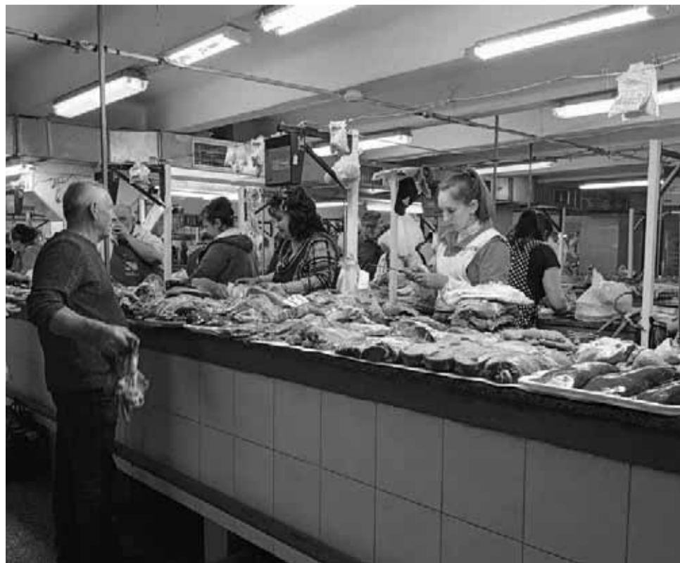
У м'ясному павільйоні є великий вибір свинини