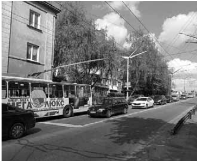
У годину пік там часто затори