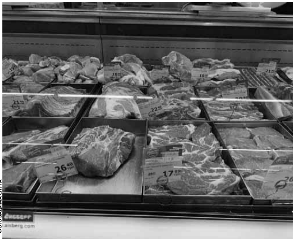
На прилавках супермаркетів є курятина, свинина та яловичина