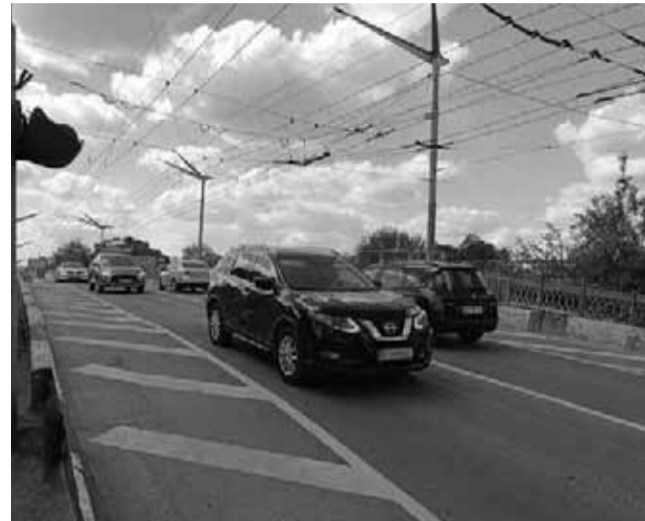
Кількість смуг для проїзду зменшили до двох

Затори ■ Залізничний міст біля технічного університету, який сполучає вулицю Руську та проспект Бандери, визнали аварійним. Через це там ввели обмеження на великогабаритний транспорт та кількість смуг для проїзду. Чи планують ремонтувати міст?