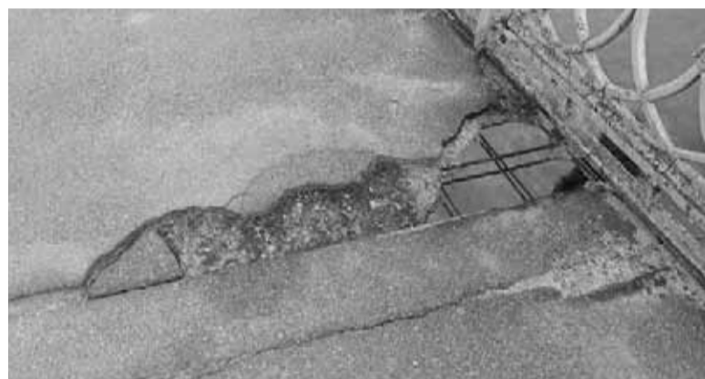
Міст на пішоходній зоні руйнується

— Кількість автобусів на маршруті №1А «вул. Володимира Винничен-