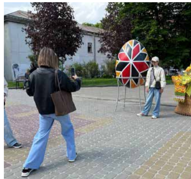
Пересічні люди фотографуються та знімають відео біля інсталяцій