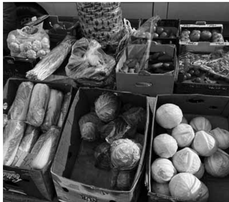
Є молода картопля, капуста, редиска, помідори та огірki. Ціни стартують від 45 гривень