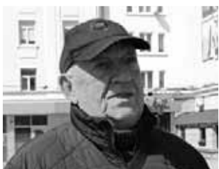
ЖІНКАМ ЦЕ НЕ ПІД СИЛУ ІГОР, 79 РОКІВ, ПЕНСІОНЕР.