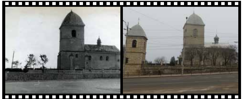
БУЛО: На місці церкви хотіли зробити готель, але у 1954 її відбудували