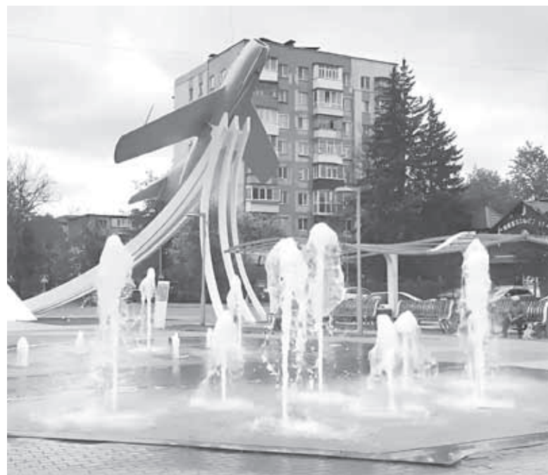
Торік фонтани запустили 5 травня. На думку міських чиновників, вони потребують щорічного обслуговування, інакше система вийде з ладу

— Фонтани, системи поливу та інші водні конструкції потрібно щорічно обслуговувати, інакше вони вийдуть з ладу. А їх відновлення коштуватиме набагато дорожче, аніж поточний ремонт. Крім того, під час сезону вони будуть пра-