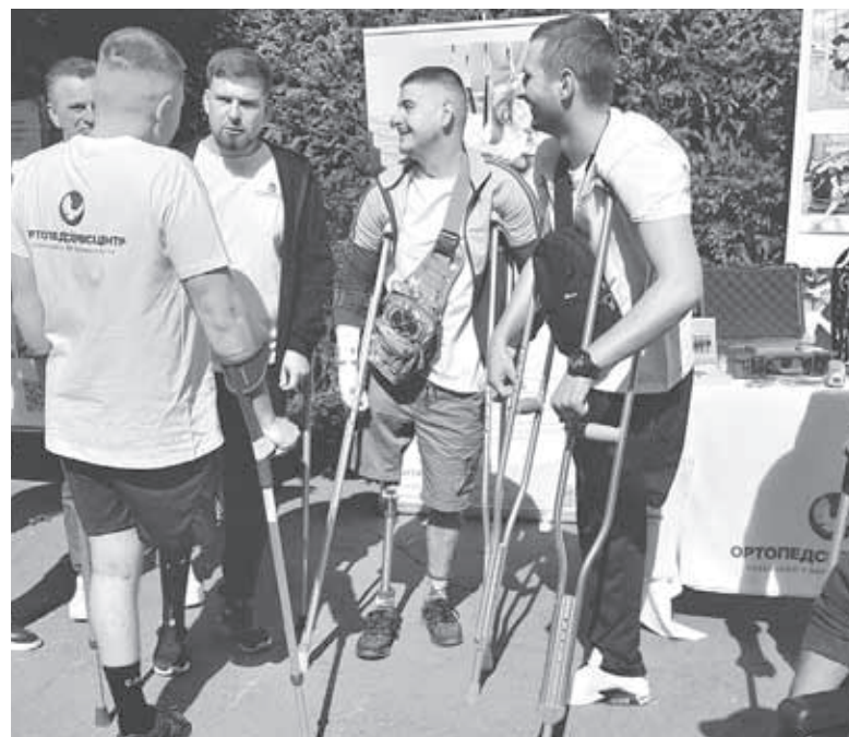
Серед відвідувачів можна було бачити людей на колісних кріслах, протезах, милицях. Нинішній «Пироговський пікнік» став територією відновлення для поранених на фронті

Директор музею також повідомив про те, що нині вирішують питання про встановлення підйомника у храмі-некрополі, де зберігається тіло Пирогова. При вході до садиби його вже встановили, люди на візках користуються ним. Такий самий механізм буде у некрополі.