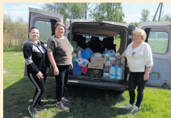
Із Мирополя на Великдень: до шпиталю – автівкою, на передову – «Новою поштою»