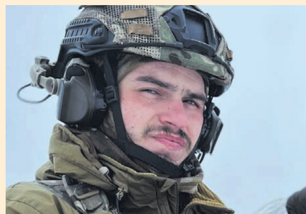
Він з 10 років мріяв служити в «Азові»