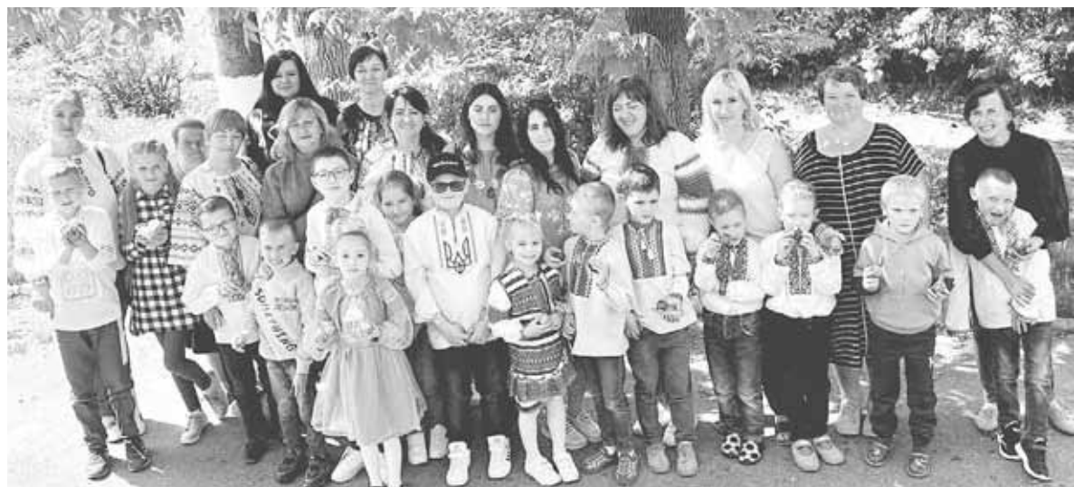
На майстер-клас завітали матусі та діти. Розписували писанки разом

Матусі запалюють свічки і разом із дітьми беруться до роботи. Кожен пробує наносити перші лінії писачком. Орнамент продумують собі самостійно. Декілька хвилин і на поверхні шкаралупи з'являються крапочки, хвилячки