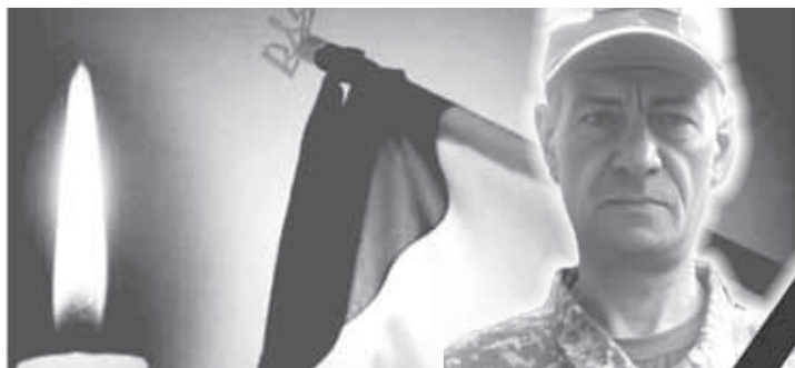
ПАМ'ЯТІ ГЕРОЯ СЕРГІЯ ЧЕРНІЯ