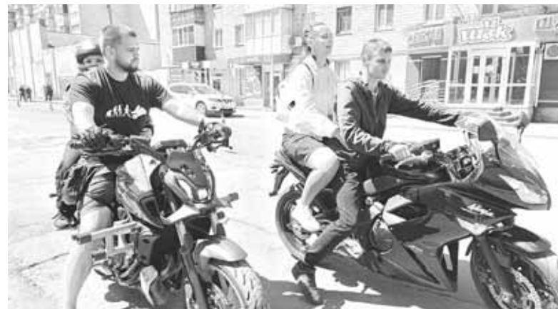
За донат мінімум в 50 гривень байкери катали усіх, хто хотів. Мотоспільнота збирала гроші на авто для 59 окремої мотопіхотної бригади імені Якова Гандзюка