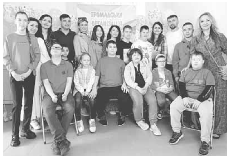
Громадська організація «Сонце в тобі» неодноразово влаштовувала заходи для дітей з інвалідністю. Цього разу організували майстер-клас із виготовлення піци

Поки чекали, що піца приготується, зняли чепчики та фартухи і зібралися за столом. Діти познайомилися з волонтерами, а потім юні кухарі пригощали своїми кулінарними шедеврами матусь та волонтерів і ласували самі.