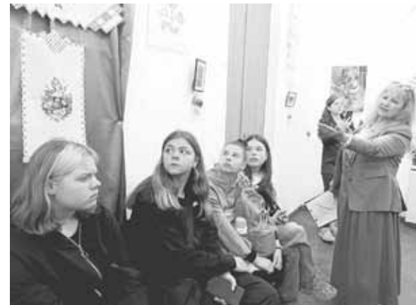
У Музеї історії міста відкрили виставку. Серед експонатів — вишиті рушники, писанки, картини, присвячені Великодній тематиці