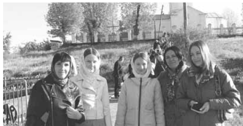
День розпочали правильно. Прихожани церкви Параскеви з освяченими пасками йдуть додому святкувати