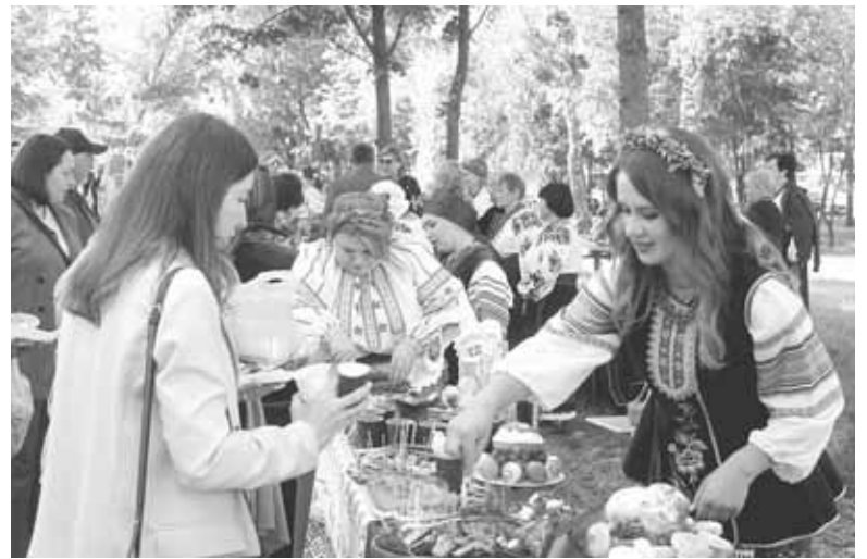
Це було дуже смачно. Гостей фестивалю пригощали великодніми смаколиками

комах чогось подібного не бачив. Я побачив наше рідне. Українські традиції — це моя мрія, якби ж то не ця клята війна. Всі молодці — це моя оцінка. Захід організовано дуже добре.