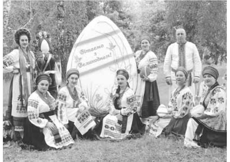
Святкова фотозона. Творчі колективи залюбки фотографувалися тут на згадку