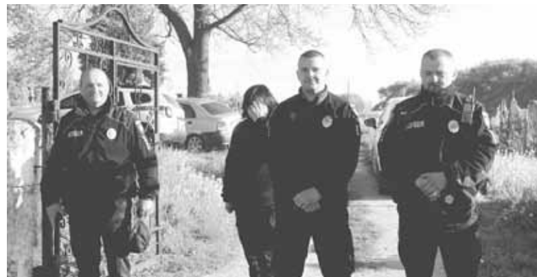
Хтось у цей день був й на роботі, тобто на службі. Порцію свяченої води отримали й стражі порядку