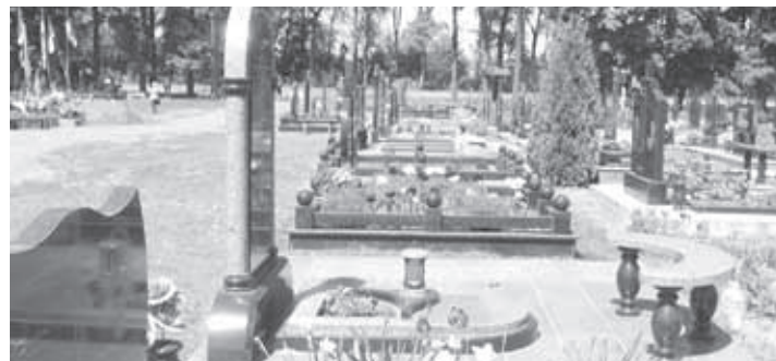
НА КЛАДОВИЩАХ СТАЛО МЕНШЕ СМІТТЯ