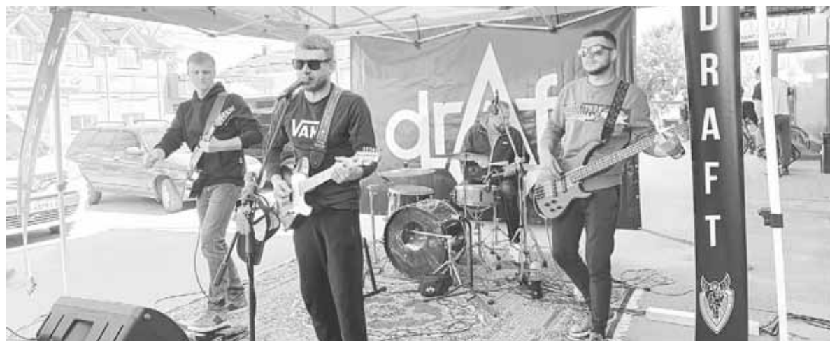
Гурт «Draft» зібрав під час благодійного концерту 14 360 гривень для бійця з Козятина. За ці кошти куплять необхідне спорядження