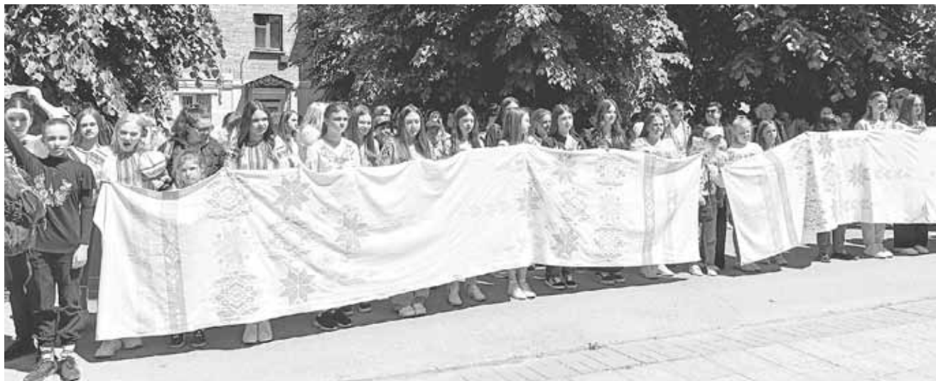
Вишиванкова хода стартувала від пам'ятника Грушевському. До неї долучилися навчальні заклади Козятинської громади