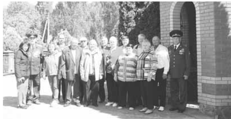
Президії ради ветеранів сподобалась альтанка. Вирішили біля неї сфотографуватися

Дорогою на Верболози ветерани зробили зупинку на колишній птахофабриці.