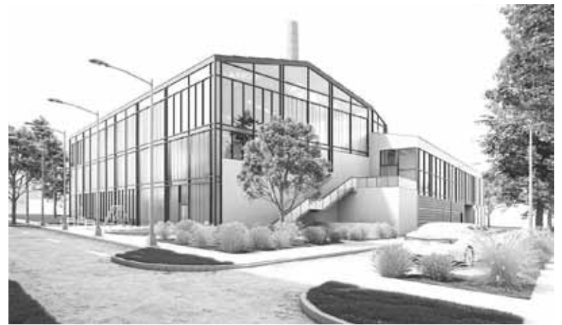
Такою її бачать у майбутньому студенти Львівської політехніки. Тут пропонують зробити спортивний комплекс

журі та адміністративний офіс «IRS» і визначать переможців. Зазначають також, що на оцінку проектів вплинуть кількість лайків та коментарів на сторінці організатора у Фейсбук. Втім не всі,