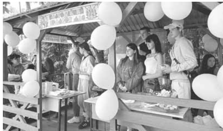
На ярмарку продавали смаколики. А ще частували смачним чаєм

лася до проведення благодійного ярмарку. За донат байкери катали усіх, хто бажав осідлати залізного