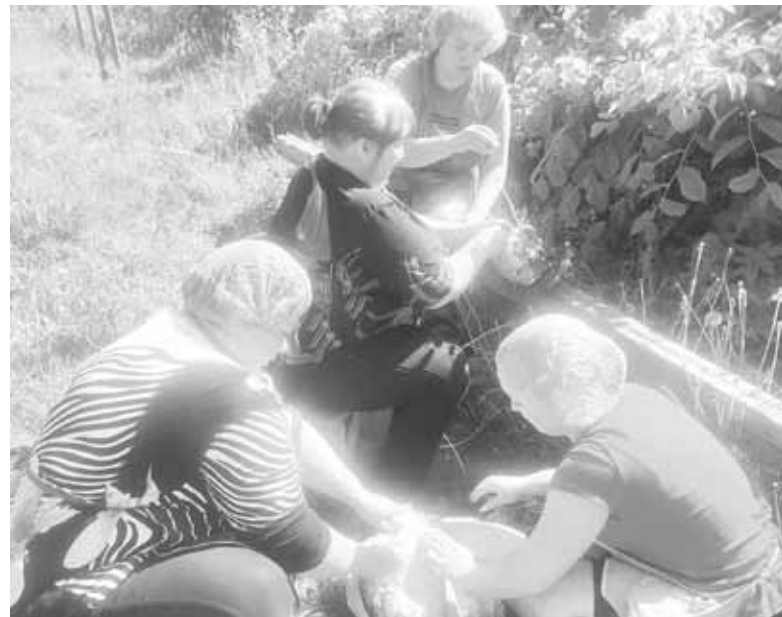
Робота кипить. На допомогу дівчатам «Міцного тилу» з Іванковецької прийшли дівчата з Непедівки, Пузирок, Махаринець