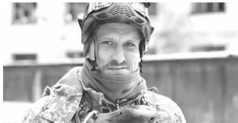
Максиму тепер назавжди 33. Вічна пам'ять Герою!

— 3 4 травня 2022 року був призваний до лав Збройних сил України та проходив службу інспектором прикордонної служби 2-ї категорії, кулемет-