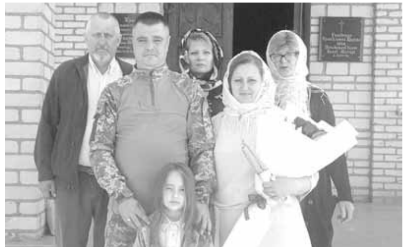
Таїнство вінчання розділили зі щасливою парою рідні та близькі

Але ці дні так швидко пролітають, навіть не помічаєш, як. Добре, зараз хоч дають 15–20 днів, а не 10, хоч трішки більше. А потім знову — розлука. Це дуже важко, постійні хвилювання і чекання зустрічі.