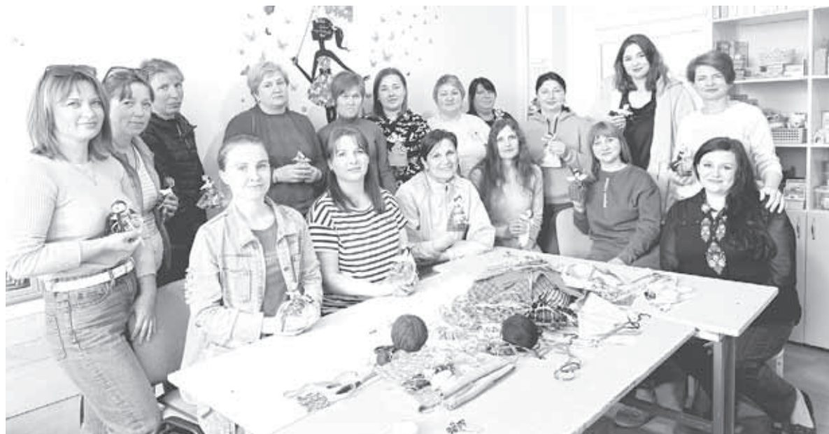
Матусі дітей з особливими освітніми потребами на годину занурилися у світ українських традицій. Вони мотали Щастя за усіма правилами