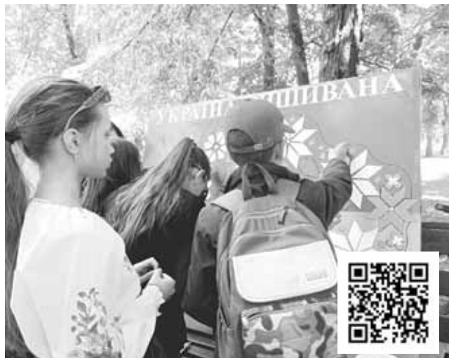
На святі юні козятинчани створили картину-пазл «Україна вишивана». Діти клеїли орнамент на карту України