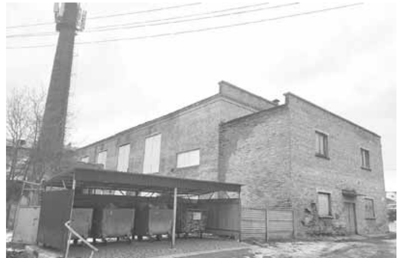
Будівля котельні № 10. Такий вигляд вона має зараз