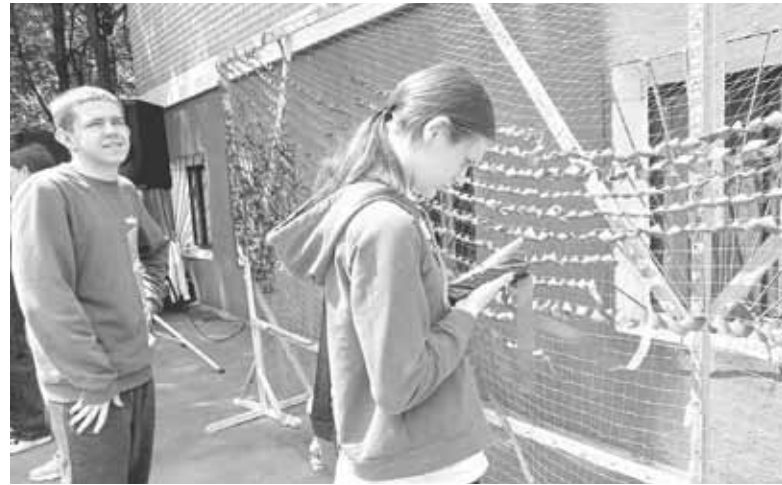
Просто неба учні плели маскувальну сітку. Це далеко не перша сітка, яку відправили на фронт

Підготували для гостей заходу ще один сюрприз — на стадіон училища приїхала козятинська мотоспільнота, яка також долучи-