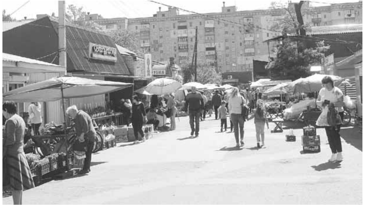
Ринок на вулиці Василя Земляка. Невеликі черги у неділю, 19 травня, були біля розсади, курячих лап і товарів повсякденного вжитку

Ціна овочів за місяць змінилася як в одну, так і в іншу сторону. Помідори подешевшали на 10 гривень, тепер вони коштують 85 гривень за кілограм. Малинові великі, яких у квітні в наших краях не про-