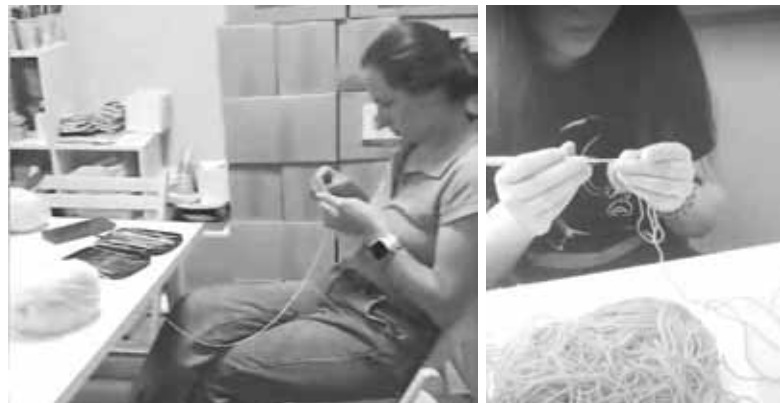
Торік «теплий прапор» в'язало вісім учасниць клубу. Працювали і в просторі, і вдома