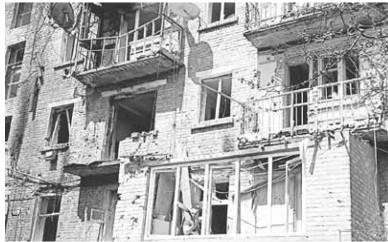
Один із найбільш постраждалих будинків від ворожої атаки. У квартирах повилітали вікна й двері, пошкоджені стіни