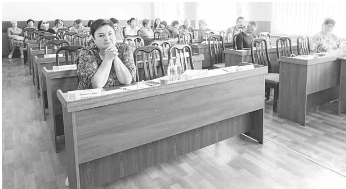
Більше половини обранців не прийшли на десятю годину. У залі було 12 депутатів, тринадцятий був у дорозі

додопостачання і водовідведення у Залізничному. Було на порядку денному питання про позбавлення білоруського співака Анатолія Ярмоленка звання «Почесний громадянин міста Козятин».