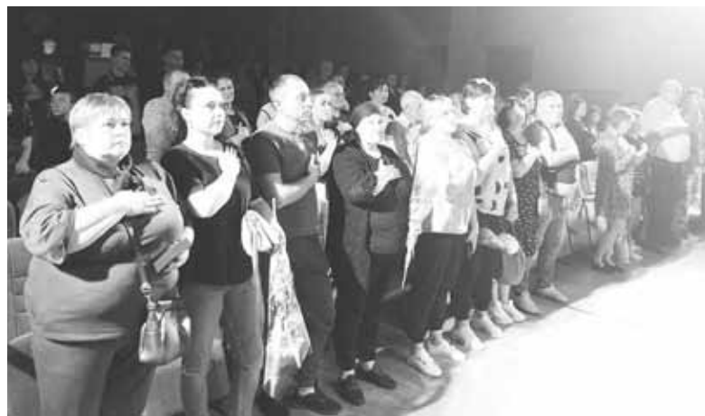
Звучить Гімн України. У залі Козятинського міського будинку культури зібралися родини загиблих Героїв, їхні друзі та близькі