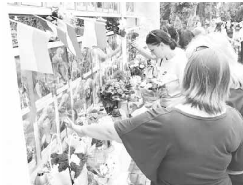
Після завершення заходу, усі пройшли до пам'ятного знаку «Загиблим воїнам-захисникам». Меморіальний комплекс зі світлинами загиблих воїнів у День Героїв засипали квітами