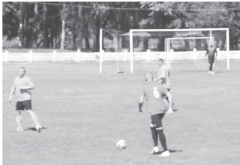
І один у полі воїн. А коли два — то вже атака

Після пропущеного голу монолітовці побігли відіграватися та ніяк не могли завдати ре-