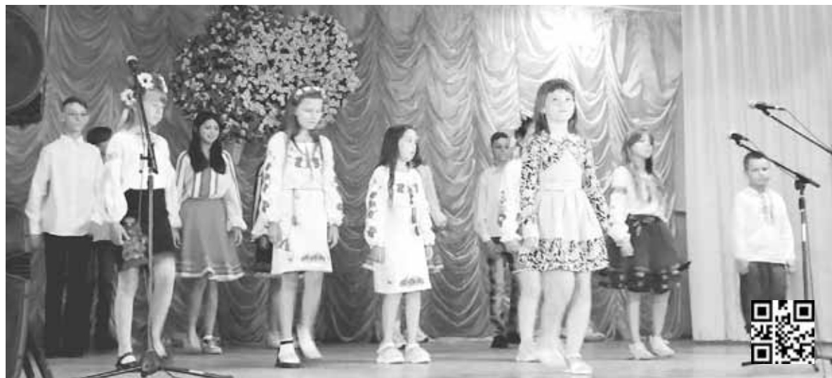
Артисти славно підготувалися — співали, танцювали, розповідали вірші. Наостанок підготували флешмоб під пісню «Ой у лузі червона калина»

А на сцені звучить музична композиція «Ми Україна». Слідом за нею ще співали «Журавлі», «Калатало так, серденько моє», «Мрія», «Юні хлопці соколята», «Біля тополі», «Переможе добро», «Не залишай», «Дитячими долонями», «Ой у лузі червона калина». Всі пісні