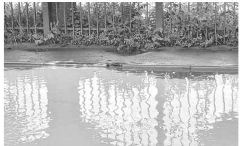
А це труба водовідведення на Винниченка. Її майже не видно з-за калабані

ремонт. Вулиця у переліку є, але чи візьмуться там латати ями — поки що достеменно не відомо.