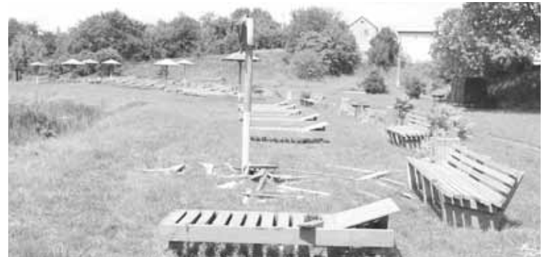
Підлітки потрощили сім лавок на Талимонівському пляжі. Постраждали від їх рук грибок й лавка

Козятинчани жваво коментували цю подію у соцмережах та на нашому сайті. Ось деякі з коментарів: