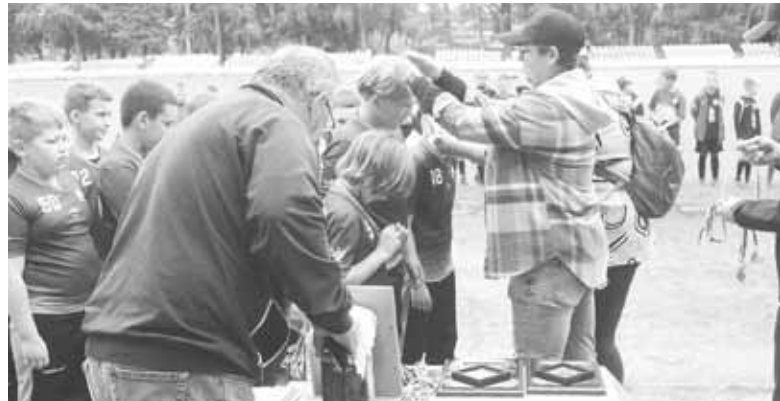
Нагородження футболістів. Усі отримали медалі та солодощі

У грі за номером два зустрілися команди господарі «Локомотив 1» та «Локомотив 2», а в наступній грі футболістів «Локомотив 2» замінили на полі гравці «Олімпійця» з Житомира. Потім поміряться силами «Фортуна» і «Локомотив 2». Після цієї гри визначились команди, які боротимуться за 3–4 місце і які команди будуть грати у фіналі.