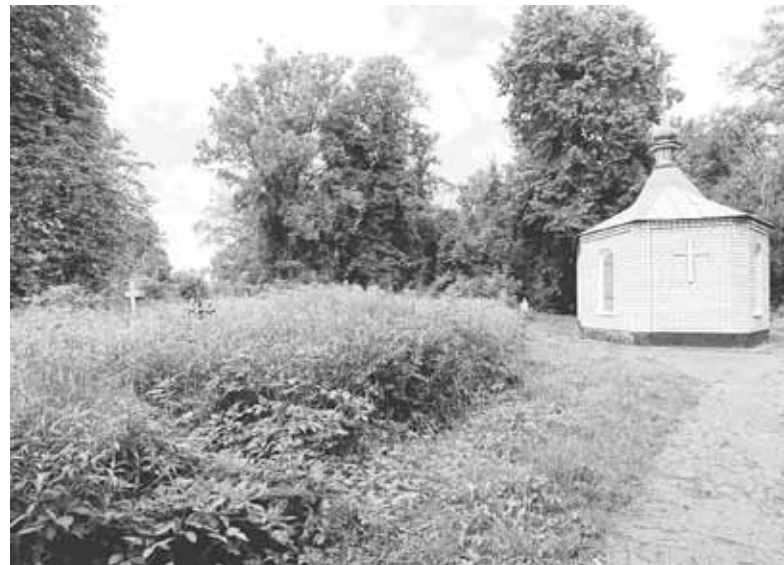
Такий вигляд мав цвинтар у понеділок, 17 червня. З-за трави практично не видно високих пам'ятників

Те, що на цвинтарі виросла така висока трава, зовсім не дивно, враховуючи погодні умови