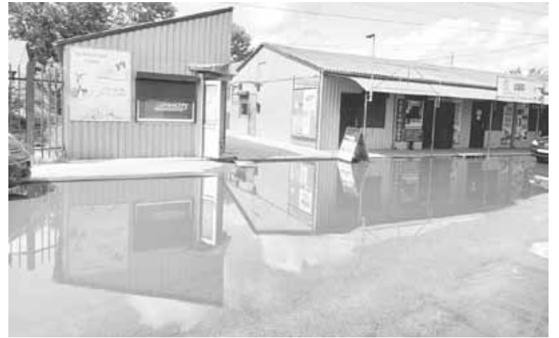
Це фото ми зробили у другій половині дня у понеділок, 10 червня. Дощ не йшов перед цим дві доби

Запитали ми також, чи будуть робити на Винниченка поточний