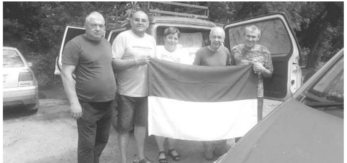
Цінний подарунок від захисників. Воїни підписали прапор, під яким боронять Україну, і подарували його волонтерам на знак вдячності і поваги

— Настрій бойовий, як подобає захисникам України, але у них є проблеми, на які вони стараються не звертати уваги, тому що це для них другорядне. У них в голові тільки зброя і прилади бачення