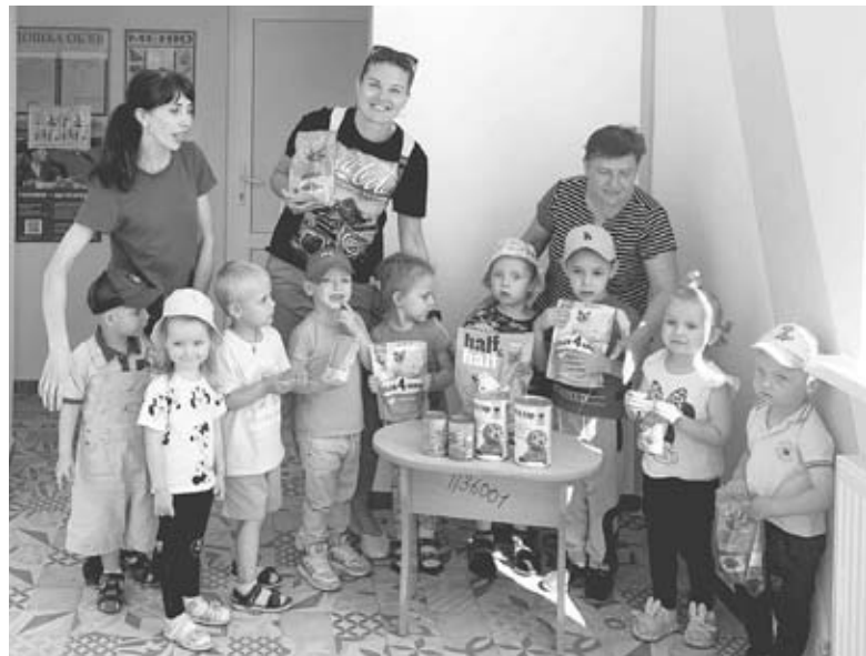
Вихованці дитячого садочка №6 передали чотирилапикам вітання. Хлопчики та дівчатка збрали декілька кілограмів корму

людське ставлення до тварини. Якщо ти взяв кішечку, то стерилізуй її, а не потім залишають цих маленьких кошенят на смерть. Тому що там вірус і він цих кошенят косить. Ми спостерігаємо таку картину протягом багатьох років. Хоча звертаємося через газети до людей, але ніхто не дослухається. Нашим людям байдуже — викинули і пішли собі додому. А як воно там те кошеня чи цуценя — це нікого не турбує. Це пока закони не будуть діяти, а закони й не будуть діяти, тому що в країні війна і зараз не до тварин, але має бути покарання за такі дії, щоб власник ніс відповідальність.