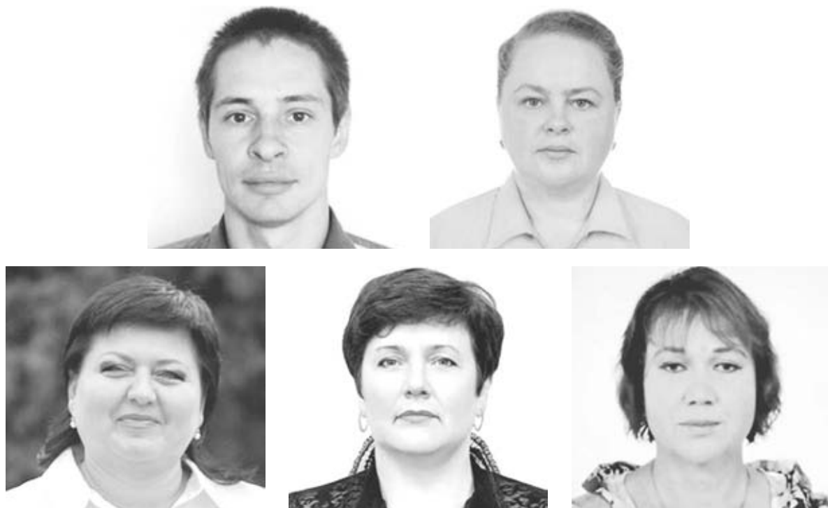
Обласний осередок партії «Українська стратегія Гройсмана» ініціює відкликання п'яти депутатів. Хоча у Козятинській міській раді представників від цієї політсили дев'ять

«На конференції було висунуто звинувачення в наступному: відсутність популяризації лінії партії УСГ (Українська стратегія Гройсмана — авт.) в громаді, здійснення морального тиску на депутатів інших партій, відсутність активної позиції, бездіяльність у волонтерській роботі, відсутність ініціативи щодо проведення заходів на підтримку УСГ, а головне — відсутність бажання відкликати міського голову Тетяну Єрмолаєву. Жодне звинувачення