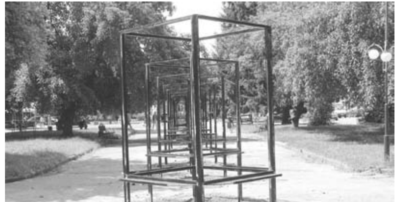
На площі встановлюють конструкції для Алеї пам'яті

Діму, що б'є ворога, а в перерві між боями в окопі співає пісні про корабель «москву», знають майже всі козятинчани. На його думку, те, що Алея Слави на самому видному місці — це добре, тільки її треба трохи причепу-