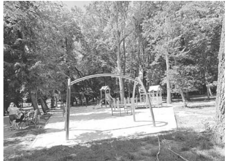
Такий вигляд зараз має майбутній майданчик. Наразі чекають, поки просохне бетонна основа

Навідується сюди діти не лише під наглядом дорослих. Минулого тижня застали дуже неприємну картину — на недобудованому дитячому майданчику ввечері тусувалися підлітки. Хлопці гамселили ногами пружину, на якій має стояти ігровий елемент. Ми не ставимо питання, куди дивляться їхні батьки. Але не можемо не запитати козятинчан: чому вони так поспішають скористатися майданчиком, який ще не завершили?