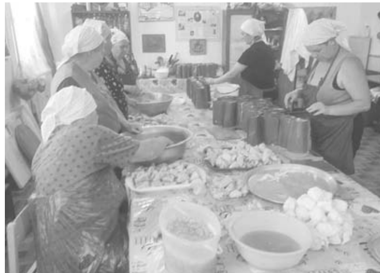
Волонтери трудяться як бджілки. За день готують 400 пакетів готових страв!