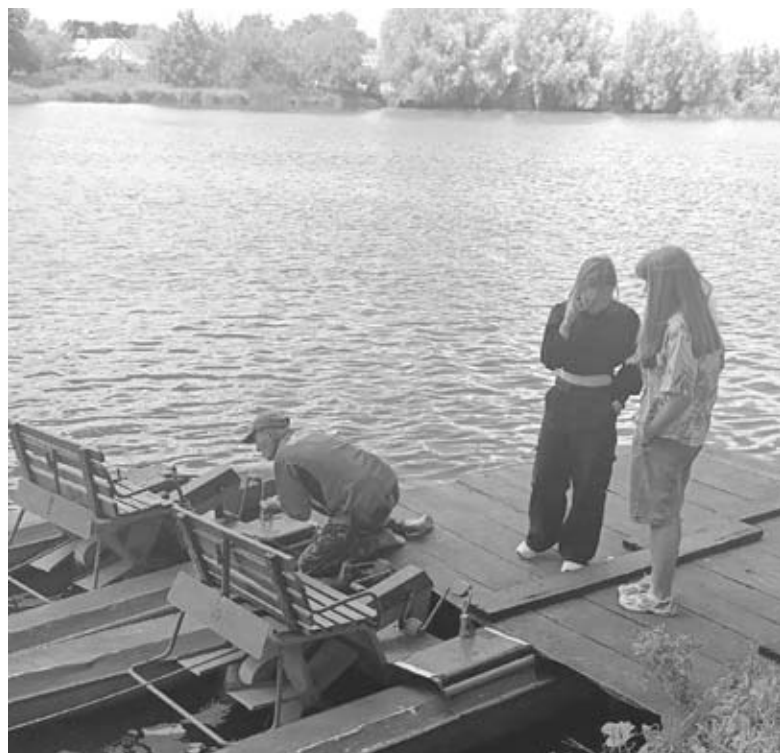
На Козятинський стадіон привезли катамарани. Найбільше охочих покататися у вихідні дні

Поділився з нами директор стадіону й іншим планами на майбутнє — хочуть побудувати скейтпарк, де молодь зможе кататися на самокатах,