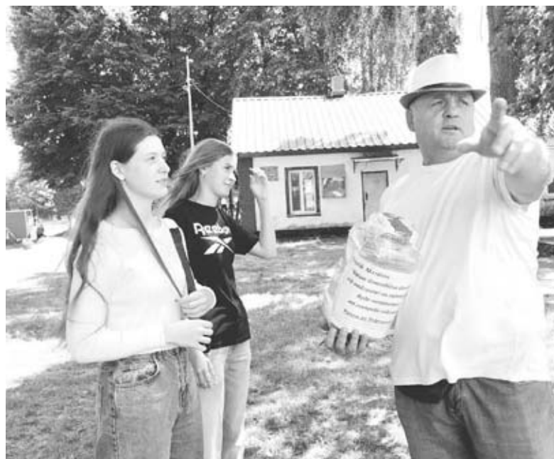
Аби взяти катамаран на пів години, потрібно задонатити на ЗСУ. Мінімальний донат від 20 гривень

скейтах. А ще додадуть гойдалок і альтанку. Таку, де можна буде сховатися від дощу.