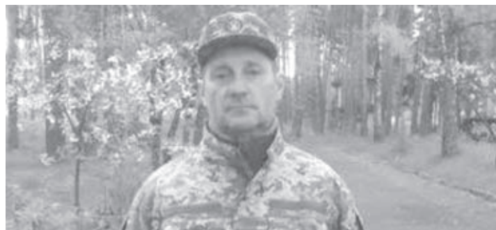
ПАМ'ЯТІ ГЕРОЯ ІГОРЯ МАЛЬЧЕВСЬКОГО