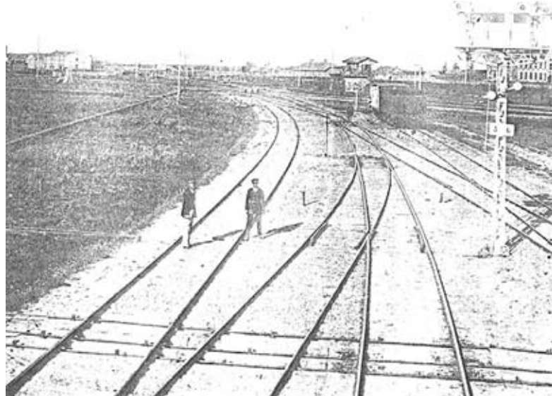
Такий вигляд мала станція Козятин наприкінці XIX століття. Ліворуч від залізниці шматок сучасної вулиці Винниченка, вдалині — депо і перша водонапірна вежа