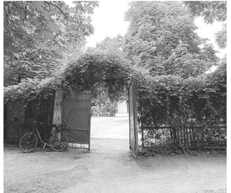
Такий вигляд має «клітка». Огорожа рясно поросла зеленню

— Звичайно, — відповідає Світлана Рибінська. — Про це вже йшлося. Якщо не помилюся, були публічні обговорення. Вже представлялися приблизні варіанти, як це може виглядати, але це все було до повномасштабної війни. Зараз великі ка-