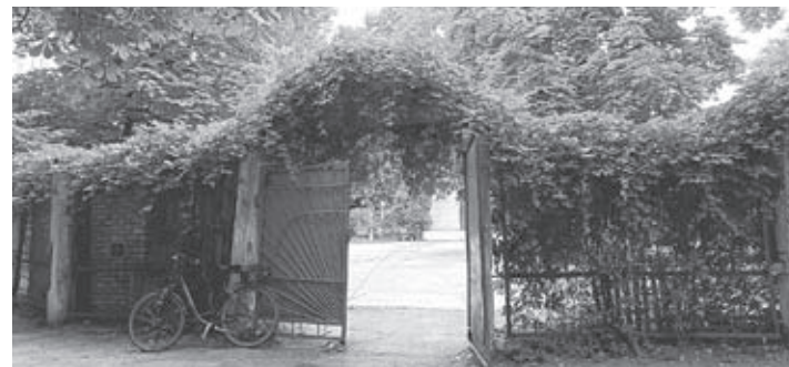
ЧИ ПЛАНУЮТЬ ПРИВЕСТИ ДО ЛАДУ «КЛІТКУ»?