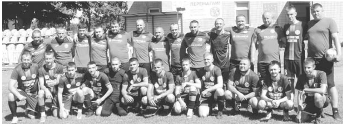
На полі зустрілися практично батьки й діти. Грالی ветерани «Моноліту» та «Локомотив»

Спорт для всіх ■ У суботу, 6 липня, на стадіоні «Локомотив» відбулося два спортивно-товариських турніри з нагоди 150-річчя Козятина. На футбольному полі провели матч ФК «Локомотив» та ветерани ФК «Моноліт». На волейбольному майданчику зустрілися ветерани волейболу Козятинського краю. Як то було — репортаж з місця події