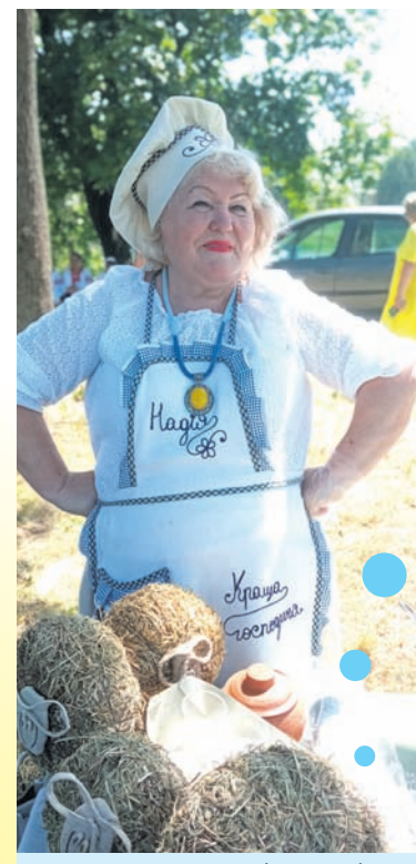
Господиня із Баранівки