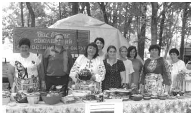
Працювали всю ніч. Напекли і наварили стільки, що ставити не було де