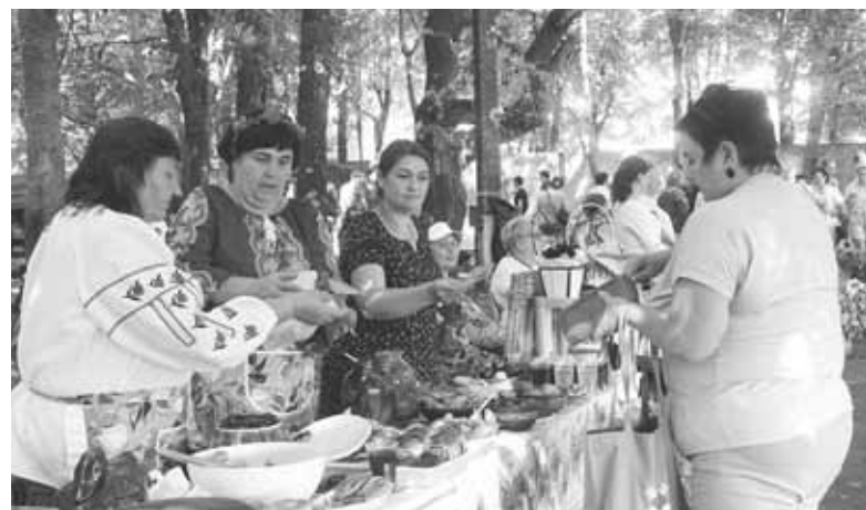
Господині вже розклали смаколики на столах. А ось і перший покупець благодійного ярмарку

до рудого зелену траву. Водії вже втомилися, а діти ще хотіли екстремальної розваги.