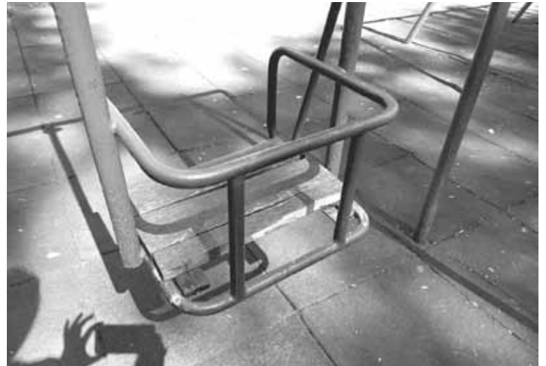
На гойдалці кудись зникла дерев'яна дошка з сидіння. Мабуть, гойдатися на ній не дуже зручно

— Ось і сидіння на одній із гойдалок зламано, — показує Олена. — Підфарбувати його все треба. Карусель також скрипить, до неї діти тільки-но підійдуть, трохи покаталися і йдуть геть. Ті маленькі балансири діти взагалі не чіпають, вони їх обходять. Здебільшого діти там не граються, вони до них на-