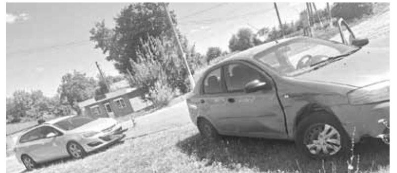
У Журбинцях на центральній вулиці не розминулися два легковики. На обидвох водіїв склали протоколи

Жінка отримала тілесні ушкодження. Її госпіталізували. Водій авто освідучений — він тверезий.