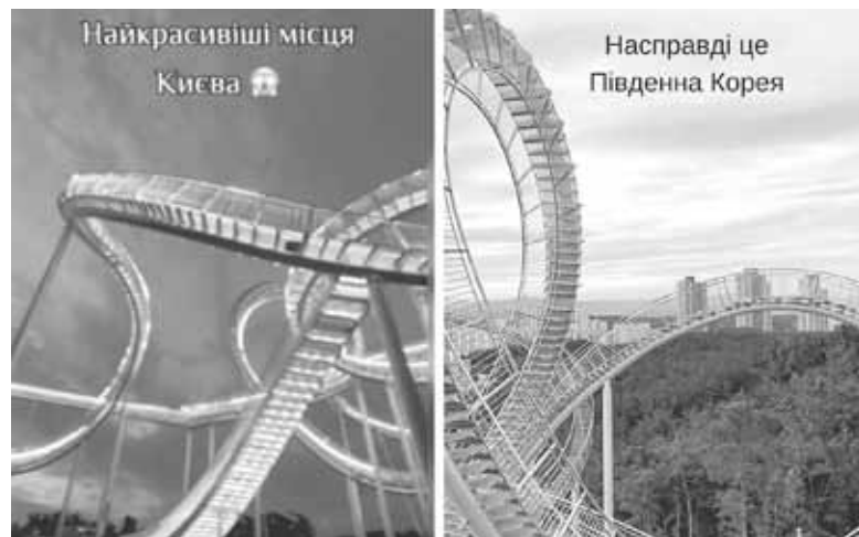
Ліворуч — оглядовий майданчик, який нібито відкрили у Києві. Насправді він розташований у Південній Корей

Повернімося до наших фейкових відео в інстаграм. Станом на 10.07.24 рілс «київського оглядового майданчика» переглянули 50,8 тисячі користувачів. Відео із «львівським майданчиком» набрало трохи менше — 45,4 тисячі переглядів. На щастя, серед тих, хто переглянув відео, були люди, які