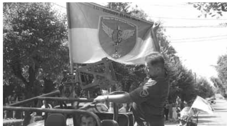
Військові всюдиходи Волонтерської групи «Buggy для ЗСУ». «Маєстро» показує, як розкладається приладдя у верхній частині автівки

Діти спочатку сиділи в переробленій чудо-техніці. Потім волонтери вирішили на тих залізних конях покатати дітей навколо футбольного поля. Перші кола були на помірній швидкості і без різких поворотів. Коли військові водії переконалися, що діти добре тримаються, додали швидкості автівам і кількість поворотів на трасі. Радості дітей не було меж, це можна було бачити і чути. Заїздів було стільки, що машини колесами перемололи