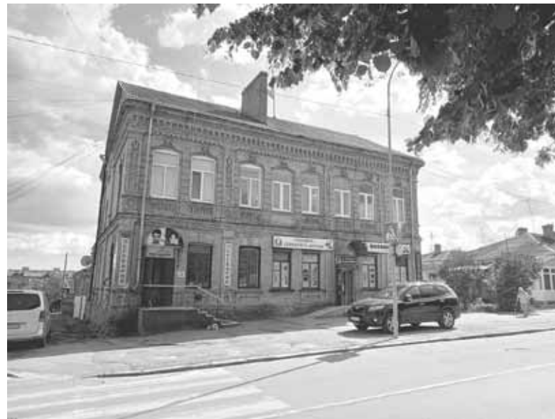
Центральна вулиця Бердичева. Стан дорожнього покриття тут значно кращий, ніж у Козятині

Неподалік від центральної площі височіє Бердичівський театр. Він розташований у старовинній