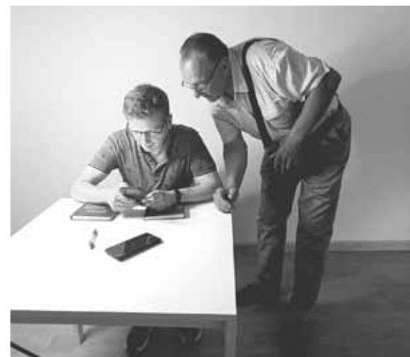
По завершенню презентації гості купували книги. Кожен, хто придбав видання, отримав на згадку автограф від автора

абуте» і буквально перекладається як «герб у центрі герба».