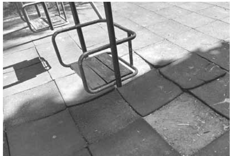
Гумове покриття пошкоджене у багатьох місцях. Найбільше — під гойдалками

віть не підходять. Оце більшість вони на гойдалках і біля ігрового комплексу бігають. Хотілося б,