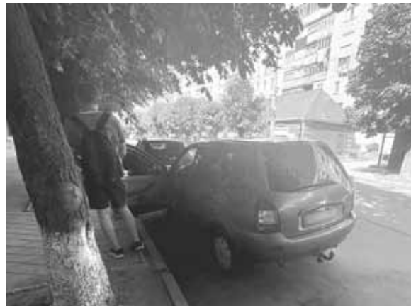
Ця ДТП сталася у центрі Козятини. Водій авто наїхав на 83-річну пенсіонерку

Довідково. Положення ст. 124 КУпАП передбачають, що адміністративна відповідальність за цією статтею настає тоді, коли громадянин порушив правила дорожнього руху, що в результаті