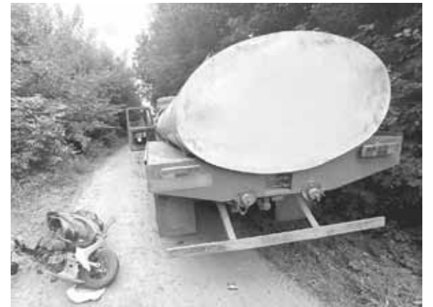
У Вовчинцях 45-річна водійка скутера допустила зіткнення з автомобілем ГАЗ. Жінку — госпіталізували

Як зазначають у поліції Вінницької області, дорожньо-транспортна пригода сталася вранці. 55-річний водій автомобіля ВАЗ, рухаючись заднім ходом, допустив наїзд на 83-річну пенсіонерку, яка перетинала проїжджу частину у невстановленому для цього місці.