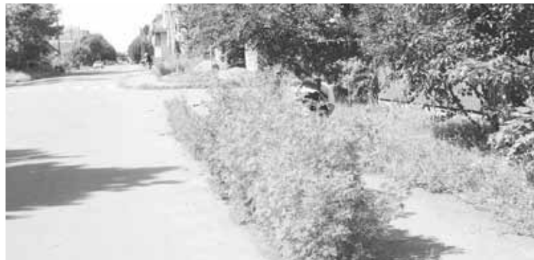
Розкішна амброзія росте на перехресті вулиць Героїв Майдану та Данила Галицького. Не десь у закутках, а прямо на дорозі

— В останні роки ми спостерігаємо загострення алергічного риніту та кон'юнктивіту, що пов'язане з цвітінням основного алергену наприкінці літа — амброзії. Сезон цвітіння амброзії зазвичай починається в кінці липня і закінчується в середині