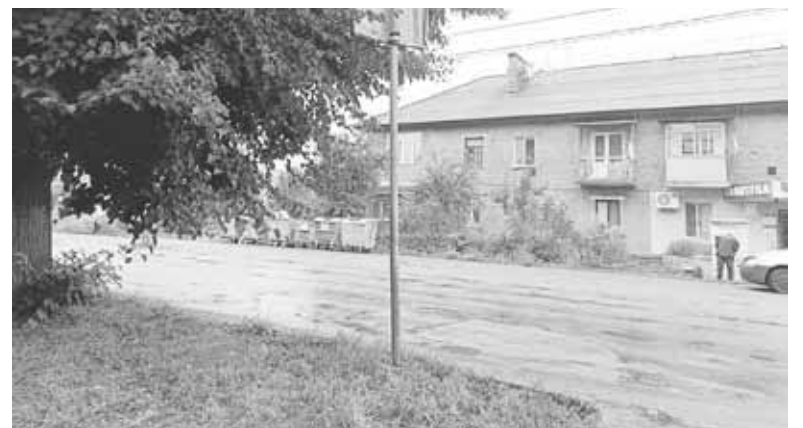
Знак «Пішохідний перехід» затуляють гілки дерев. Навряд чи його бачать водії