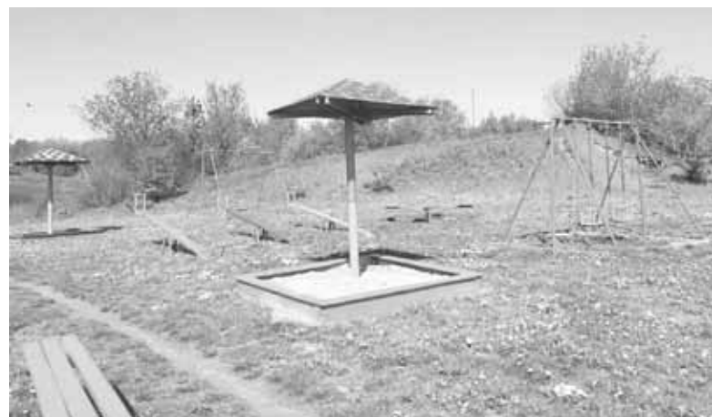
Вивіз сміття з Талимонівки вартував 542 гривні. Закупівлю здійснив відділ культури.

Придбало Управління освіти та спорту також 28 мультиварок. Угоду на 43,4 тисячі гривень уклали із вінницькою підприємцею, однак самого договору у системі електронних закупівель «Prozorro» немає, лише зазначено, що мульт-