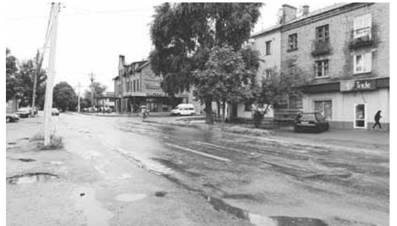
Фарба на «зебрі» майже стерлася. Розмітку практично не видно

Того ж дня, тобто у п'ятницю, 26 липня, ми зняли відео про пішохідний перехід на ПРБ і запустили його на нашій сторінці в Інстаграм. А в понеділок, 29 липня, пробували зв'язатися з начальником управління житлово-комунального господарства,