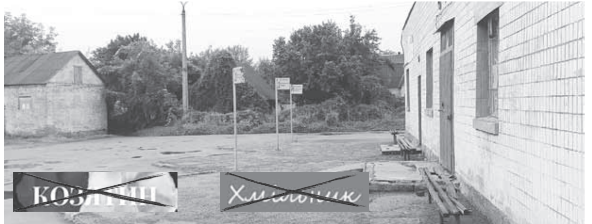
Серед безлічі рейсів у різні напрямки з козятинської автостанції на Хмільник — жодного. Доїхати туди від нас можна лише власним авто та поїздом