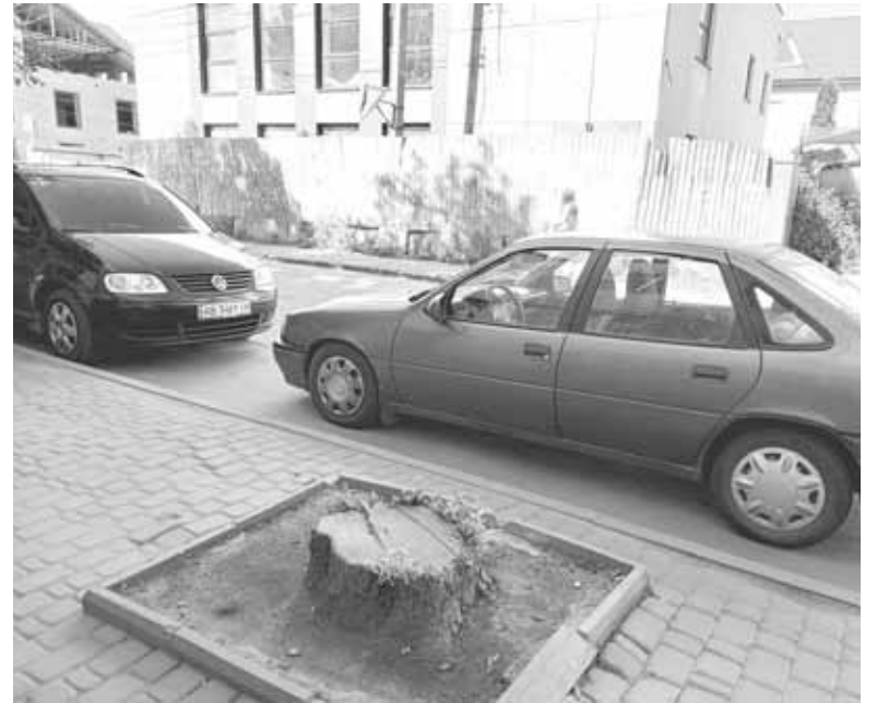
Зовсім нещодавно тут росло дерево. Тепер замість нього пеньок

Яка ситуація з озелененням у Козятині зараз — вирішили поцікавитися наші журналісти. Ми надіслали на міську раду інформаційний запит, аби дізнатися, скільки дерев вирізали у Козя-