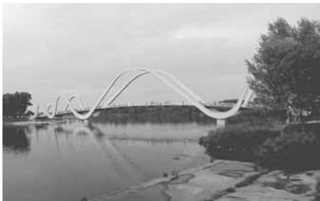
Оболонська набережна. Міст «Хвиля», який відкрили у 2024 році