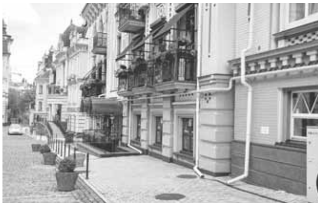
Воздвиженка. Це сучасні будівлі, стилізовані під старовину