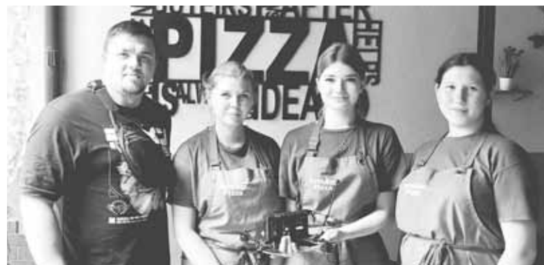
Піцерія задонатила свій денний заробіток. Завдяки цьому вдалося зібрати безпілотник

Призначення платежу: Поповнення рахунку банку