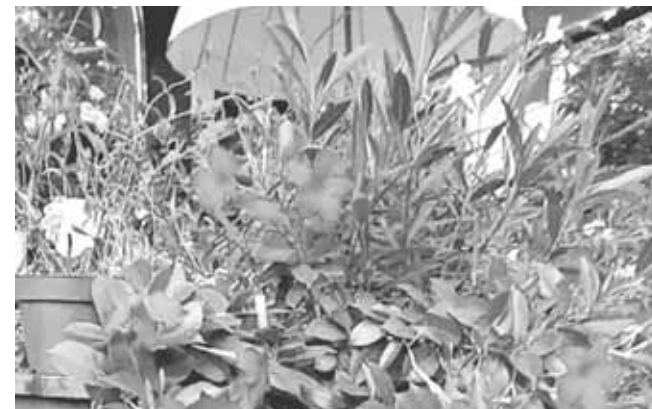
«Кловський сад». Мінісадок із квітами облаштували прямисінько біля будівлі