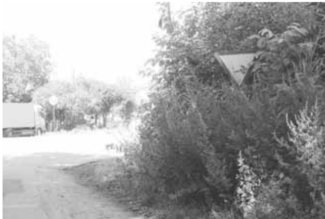
Білоцерківська траса. Дорожній знак заріс бур'янами і порослями