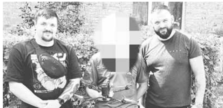
Громадська організація «Фонд підтримки оборони» профінансувала виготовлення одного дрона. Його передали у 120 бригаду територіальної оборони, де служать козятинчани