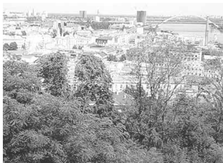
Краєвид Подолу. Це фото ми зробили на Алеї художників

сучасна, сам мікрорайон дійсно історичний. Колись ця місцевість називалася Гончарі-Кожум'яки, оскільки це був осередок ремесел. Тут було чимало майстерень, де обробляли шкіру. Тож не дивно, що тут є навіть вулиця Кожум'яцька. До речі, за легендою, саме у цьому мікрорайоні жив Микита Кожум'яка, відомий літературний герой. Свою сучасну назву Воздвиженка отримала від Хрестовоздвиженської церкви, яку звали у XVIII столітті. Натомість перші будівлі тут з'явилися ще у XII столітті.