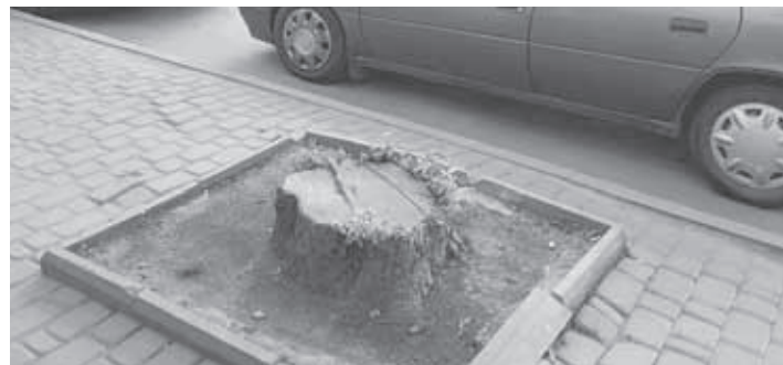
ДЕРЕВ ВИРІЗАЛИ БІЛЬШЕ, НІЖ ПОСАДИЛИ