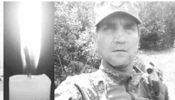
Олег Насінник загинув у 53. Вічна пам'ять Герою!