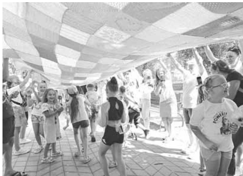
Теплий прапор розгорнули на центральній алеї скверу. Діти веселилися під жовто-блакитним в'язаним стягом

ду в сквері працювали творчі майстерні, де діти малювали, вирізали, клеїли. А ще юні та дорослі учасники свята ставили жовто-блакитні відбитки долонь на банері «В єдності сила».