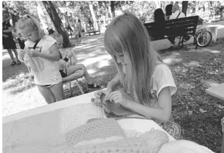
Впродовж заходу пришивали фрагменти до прапора. Для цього використали спеціальні голки