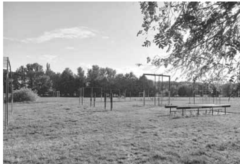
Стадіон училища — єдине місце, де влітку проводять дозвілля мешканці цього мікрорайону. Тут можна зустріти не лише дітей, а й дорослих