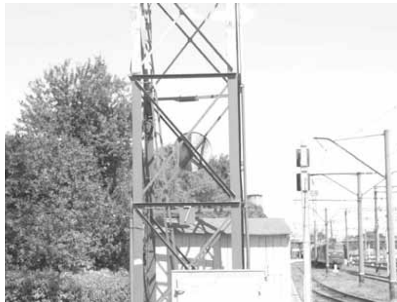
На цій вищці колись висів годинник. Козятинчани кажуть, що коли поспішали на потяг, орієнтувалися по ньому