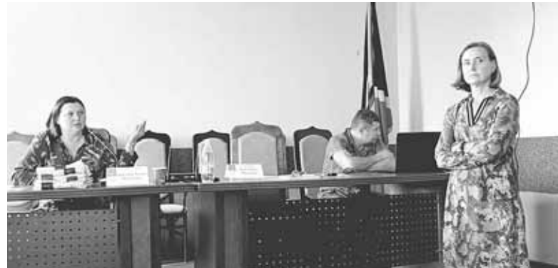
Засідання мало відбутися о 16 годині. Сесія зірвалася, бо було менше 14 депутатів

— Сьогодні сесія мала би відбутися, всі підтвердили свою присутність. Перед тим, як оголосити сесію, ми з секретарем міської ради телефонуємо до депутатів і запитуємо, чи зручно їм прийти на сесію на конкрет-