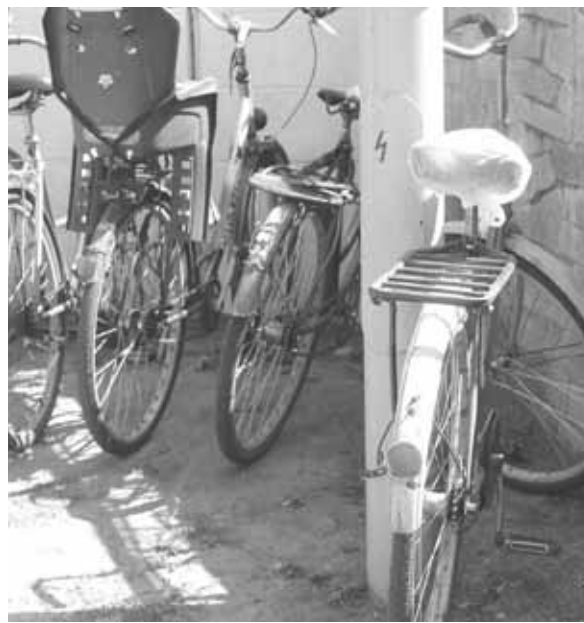
Стоянки для велосипедів на пероні немає. Зате є на київській платформі

Пан Микола працював на нашому вокзалі. Згадує, що на пероні Київської платформи був неперервний потік людей.