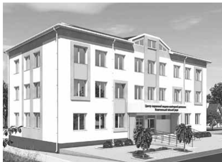
А такий центр буде після завершення капітального ремонту. Роботи обіцяють завершити до нового року

щина. — Наразі роботи йдуть по плану, все швидко рухається. Також хочу зазначити, що окрім того, що ремонтують наш центр, ми також поступово і оновлюємо ФАПи в громаді.