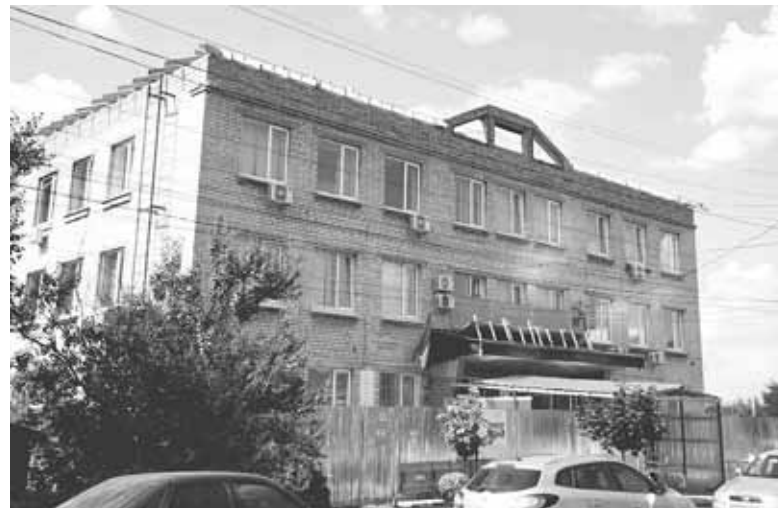
Такий вигляд має будівля козятинської міської сімейної медицини зараз. Вже завершили встановлення дерев'яних конструкцій під майбутній новий дах