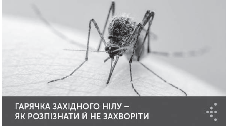
ГАРЯЧКА ЗАХІДНОГО НІЛУ – ЯК РОЗПІЗНАТИ Й НЕ ЗАХВОРИТИ

Комарі кусають інфікованих особин і можуть передати