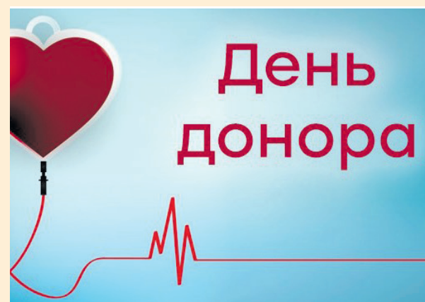
У Мирополі пів сотні тих, хто знову і знову дарує надію