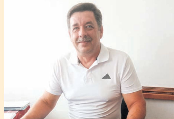
У Романівській ДЮСШ – новий директор