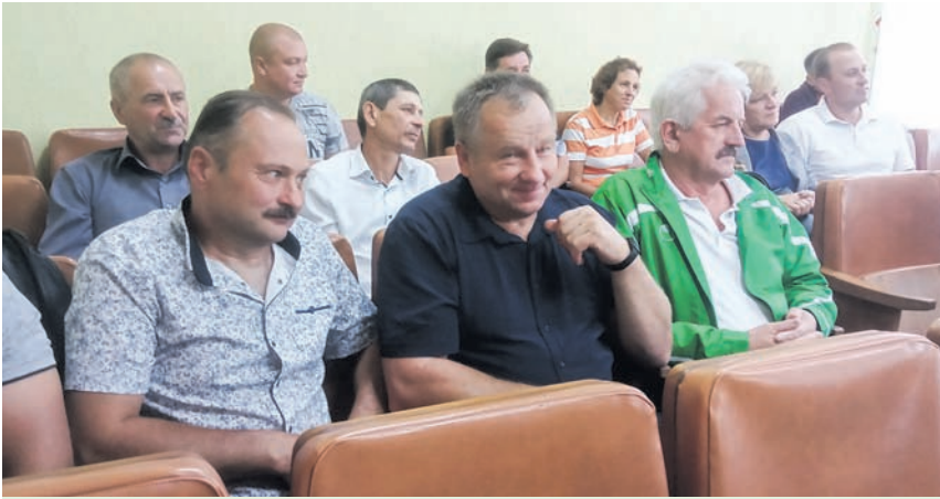
Момент урочистого нагородження кращих вчителів і тренерів Романівщини