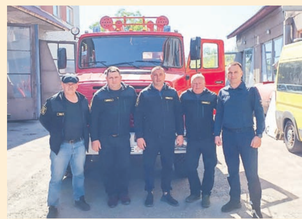
Пожежне депо у Биківці відкрили на офіційному рівні

Зрештою, нам, українцям, варто запам'ятати, що партнерство на рівні