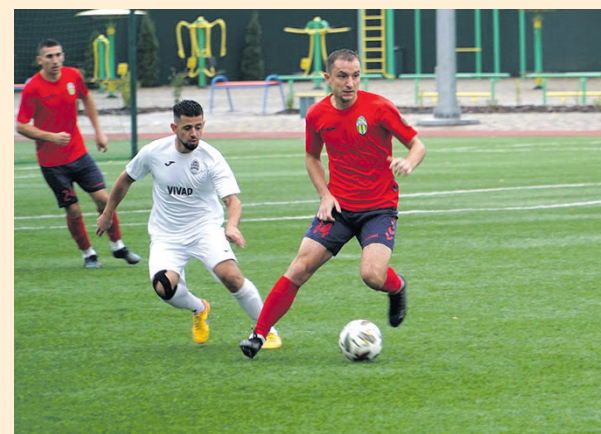
Що принесла середа, 18 вересня? Ми сподівалися на золото!