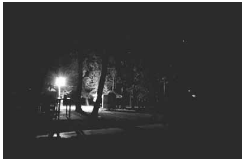
У парку (станом на 30 вересня), як і по всьому місту, темно. Тут горить лише один ліхтар біля тамтешньої торгової лавки

Саме в цей день ми пройшлися центром міста. На годиннику трохи більше за 19.00. Козятин поглинула темнота. У центрі міста, як і загалом по всьому місту, не світить жоден ліхтар. Рятують ситуацію магазинні вивіски, а подекуди, наприклад, біля АТБ та тамтешніх кав'ярень, взагалі все сяє. Але то місцеві підприємці, які справно платять за електроенергію.