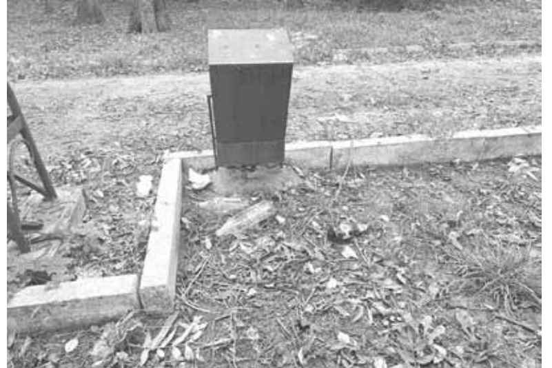
Таким був парк залізничників у понеділок, 30 вересня. Сміття викинули повз урну

Ми пішли далі стежкою вздовж залізничного полотна. Там сміття виявилось ще більше. Вздовж паркану як не обгортки від сухариків, то пластикові пляш-