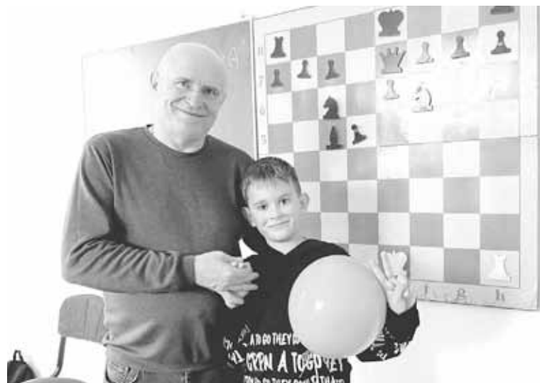
День позашкілля видався цікавим. Діти весело і гамірно провели час

— Нам дозволили малювати все, що захочемо, — каже Віка