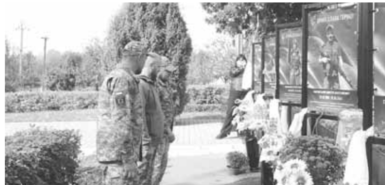
На заході пам'яті були присутні воїни-сестринівчани. Вони схиляли голови в пам'ять про земляків, які віддали життя за Україну

— Але точно знаю, що в день, коли наша Перемога таки прийде,