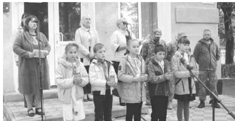
П'ять запалених лампадок діти передали родинам загиблих воїнів. Вічна пам'ять Героям

ми всі будемо плакати і мовчати. Мовчати і плакати.