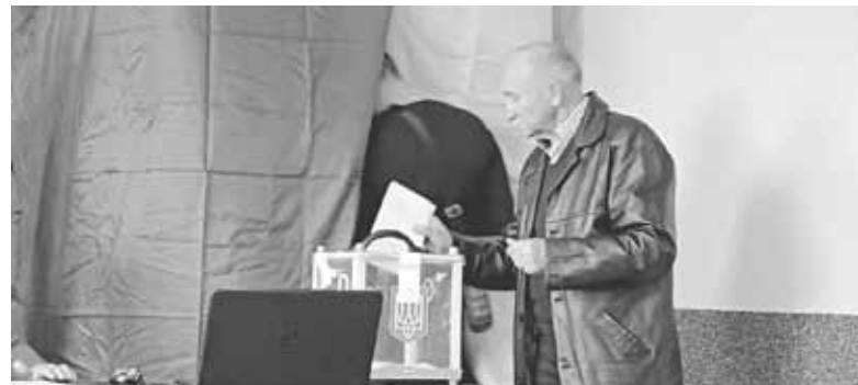
За процедурою, проводили таємне голосування.