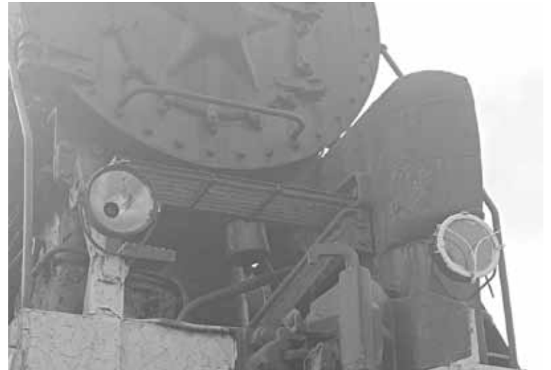
Таким ми побачили пам'ятник два тижні тому. Без коментарів

Із іншого боку, пам'ятник-паровоз підпадає під закон «Про декомунізацію». Адже монумент, який вважається пам'ятником трудової слави залізничників, насправді встановили на честь 70-річчя Жовтневого перевороту, про що навіть є відповідна табличка. А відповідно до закону, символікою тоталітарного комуністичного режиму вважається, цитуємо, «зобра-