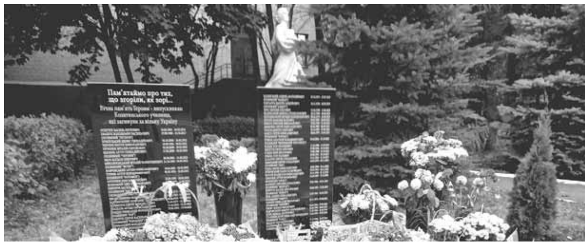
Пам'ятний знак на подвір'ї училища. Тут імена 60 Героїв-випускників, які стали на захист України і полягли в бою

загиблих Героїв, учнівський та педагогічний колектив училища та запрошені гості. Віче з нагоди відкриття пам'ятної стели розпочав Гімн України.