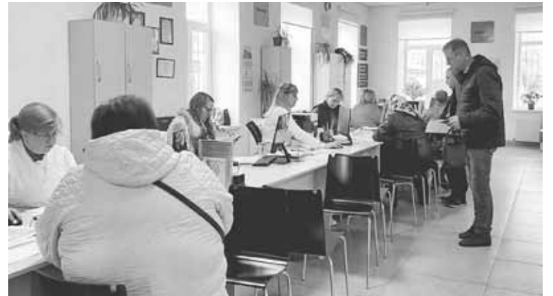
З першого жовтня стартував процес призначення субсидій. Через Козятинський ЦНАП вже подали 108 субсидій та 17 пільг

Які документи необхідно подати? Паспорт та ідентифікаційний код заявника (та всіх членів домогосподарства);