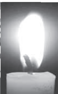
ПАМ'ЯТІ ДМИТРА БОНДАРЧУКА