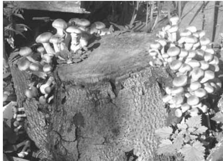
Кущові королівські опеньки вже з'явилися у лісах. Але будьте обережні, їх можна сплутати з отруйними грибами

У центрі також пояснили, що причиною отруєнь, як і в попередні роки, було збирання та вживання