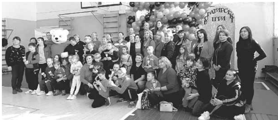
Богатирські ігри організувала громадська організація «Сонце в тобі спільно із волонтерами». До змагань долучилися нормотипові діти та діти з інвалідністю