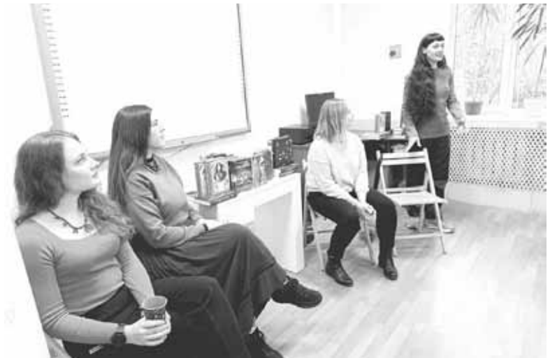
Проєкт «Фантастична Україна» тривав протягом місяця. У його рамках письменниці мандрували малими містами