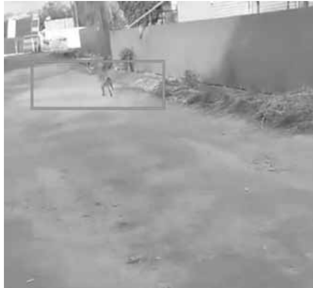
На фото скрині з відео, яке відзняли козятинчани. За словами очевидців, лис біг вулицею Зоряна та кидався на тварин

— Ми не ловимо лисів, у нас нема відлову, цим мають займатися органи місцевого самоврядування. Є відділ з надзвичайних ситуацій і цивільного захисту, вони там скеровують, дають завдання, кому і що робити. Але, зазвичай цим займається або ДСНС або поліція. Якщо вони впіймають лиса, ми забираємо, досліджуємо. Якщо є сказ — проводимо всі необхідні за-