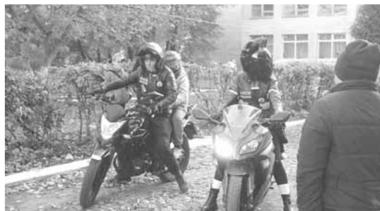
У заході взяла участь мотогрупа «Сини України». Мотоциклісти катали за донати дітей