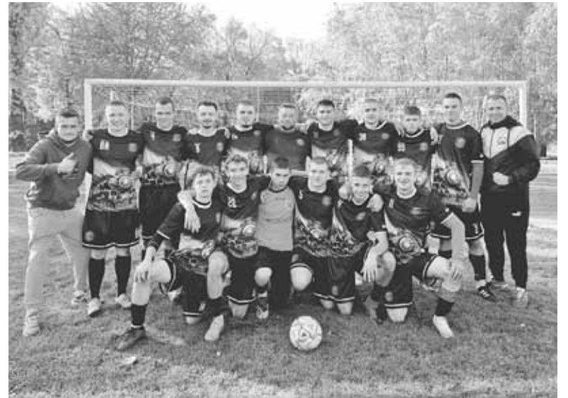
Вдало гру зіграли, пора фотографуватися. Команда «Локомотив» після перемоги над «Прод-Мовою»

У Стрижавці перший тайм зіграли 1:1. Через десять хвилин після початку другого тайму, був вихід віч-на-віч і голкіпер