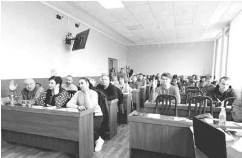
Позачергову сесію скликали на ранок четверга, 24 жовтня. У сесійній залі зібралось більше 20 депутатів

гривень — Центру первинної медико-санітарної допомоги на пільгові рецепти, а також по 99,9 тисячі гривень на управління освіти та спорту, управління соціальної політики та управління житлово-комунального господарства.