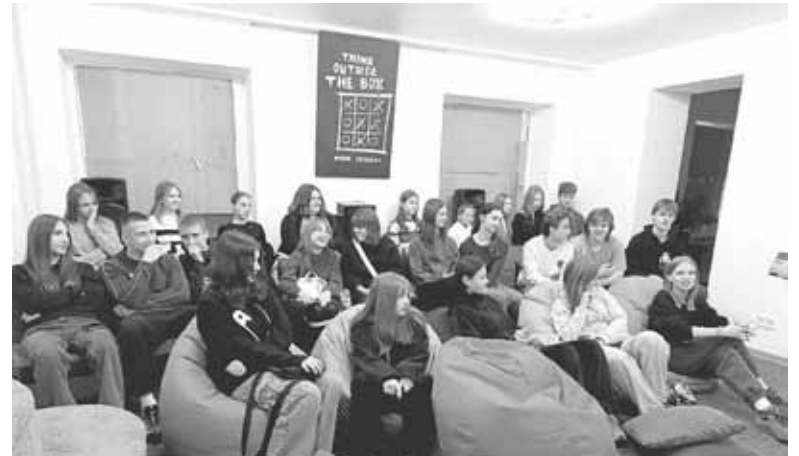
На кінопоказ зібралися підлітки із різними захопленнями. Чимало з них волонтерять

Перед тим, як переглядати фільм, хвилинка знайомства. Кожен, хто завітав на кінопоказ, розповідає, як його звати і чим любить займатися. У молодіжному хабі зібралися юнаки й дівчата з різними за-