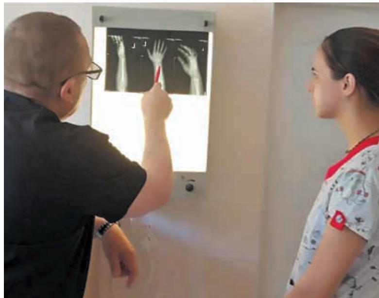
Сімдесят відсотків — це травми через падіння з велосипедів та самокатів. Як результат — переломи, рани, пошкодження зв'язок

Порізи та рани. Причини: падіння, необережне поводження з гострими предметами, ігри з небезпечними предметами. Симптоми: кровотеча, біль, відкриті рани.