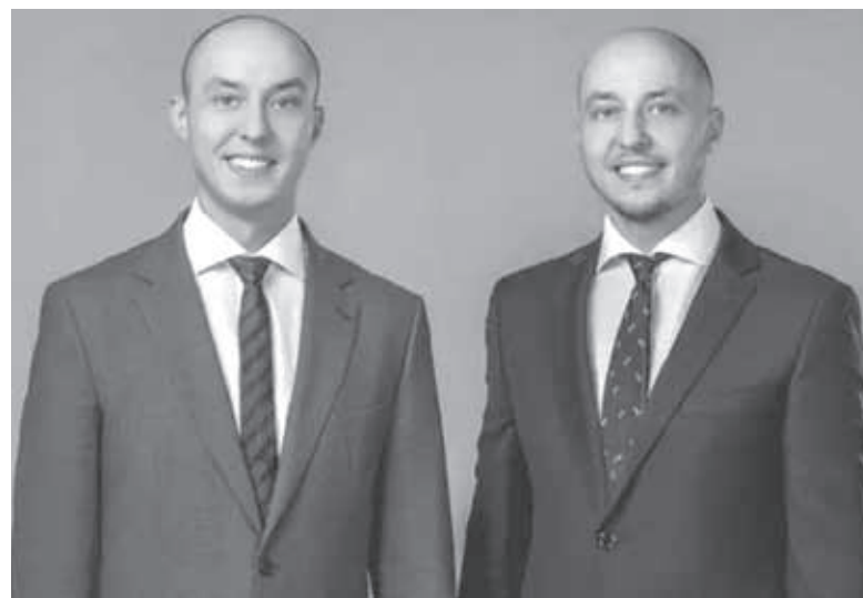
У лікаря-терапевта вінницького МСЕК є два сини. Обоє займають високі посади у різних державних структурах