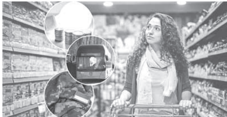
Продукти продовжать зростати у ціні. Однією з головних причин стало спекотне літо 2024-го

Подати документи на субсидію в листопаді необхідно лише в тому випадку, якщо вона