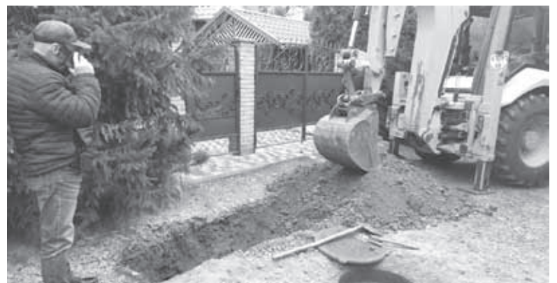
За допомогою спецтехніки виявили та зафіксували факт незаконного скидання рідких відходів. На порушників склали адмінпротокол

Саме про злив відходів повідомили небайдужі громадяни. Після втручання міських служб та комунальних підприємств незаконну «схему» ліквідували, а на порушників склали адмінпротокол.