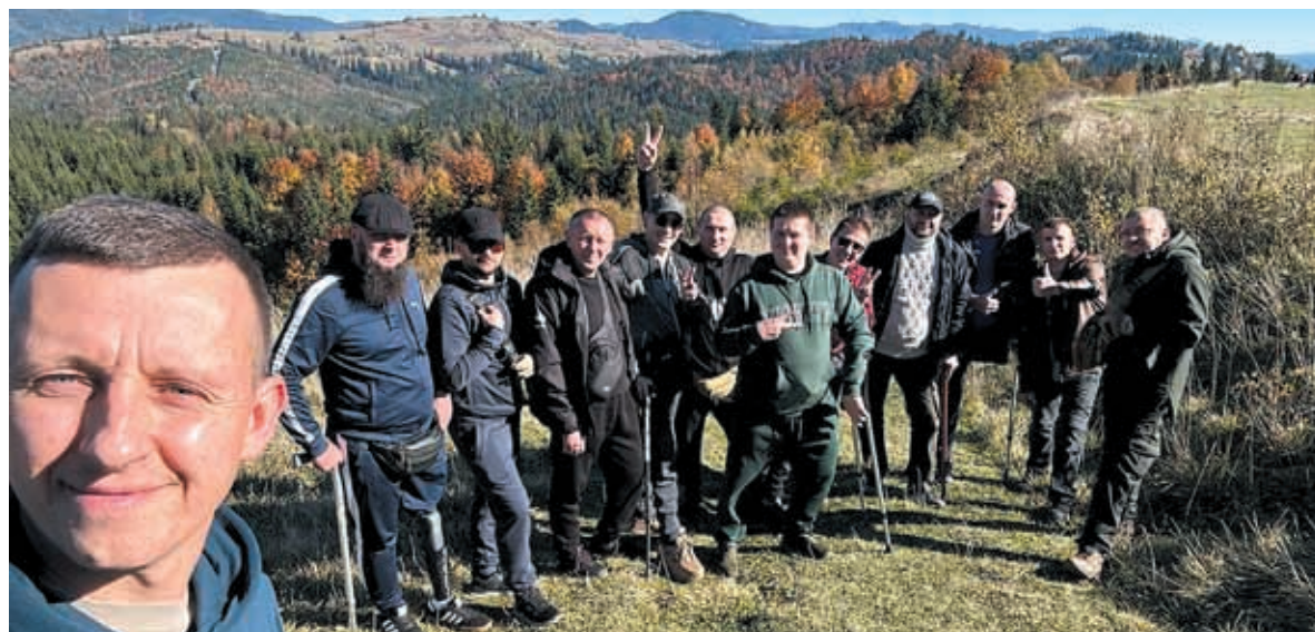
Волонтери з Вінниці влаштували поїздку для ветеранів війни. Мета — покращити психологічний та фізичний стан захисників