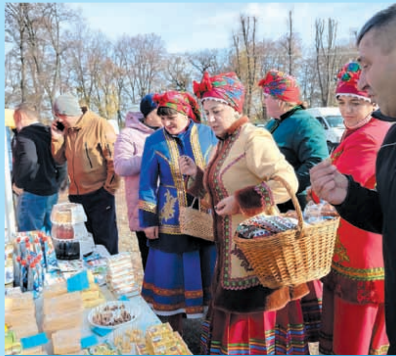
На Немирівському шосе біля повороту на село Щітки 1-3 листопада проходив Перший регіональний сільськогосподарський ярмарок. Тут можна було купити як свіжі овочі та фрукти, так і крафтові вироби. А ще — долучитися до доброї справи, підтримавши наших захисників