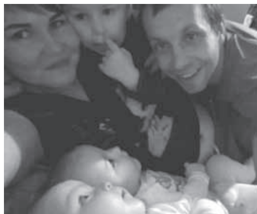
Родина, яка постраждала від отруєння, і ті гриби, які вони споживали. Лікарі вважають, що п'ятеро людей отруїлись блідами поганками