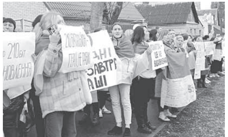
У Вінниці відбувалася акція. Рідні військових її організували, щоб привернути увагу до ситуації з військовими 210-го батальйону Тероборони