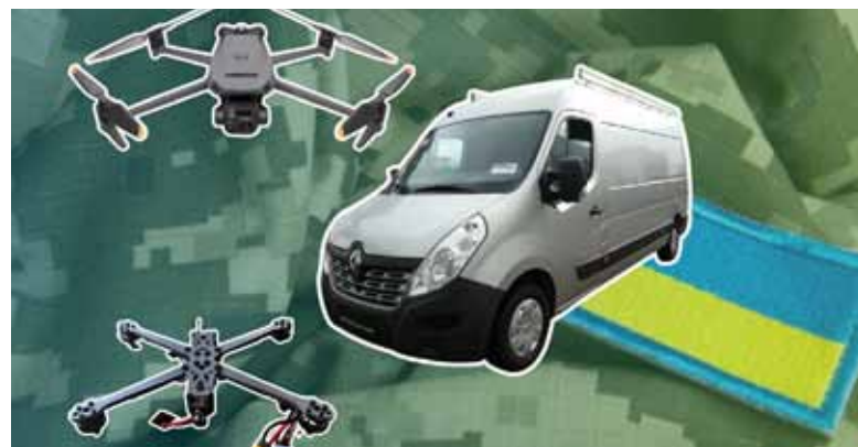
Міська влада купує багато «пташок». Тільки FPV-дронів замовили 2,5 тисячі одиниць

Оскільки вся партія коштуватиме 21 мільйон, то одиниця товару — 8,4 тисячі гривень. Це