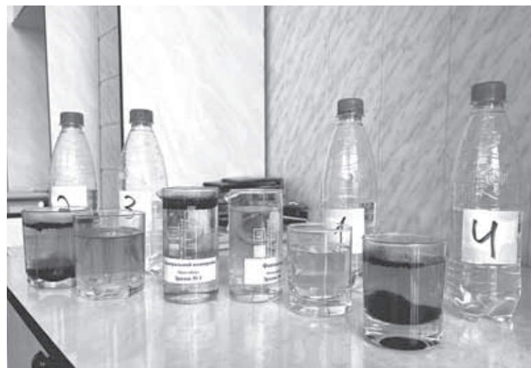
Такий вигляд мають зразки води після електролізу. Кращі результати показала вода з аквамату «Аква Пульс» (друга праворуч), найгірші — «Подольночка» (перша праворуч)

«Аква Пульс» vs «Подольночка» «Аква Пульс», що має найнижчий рівень мінералізації, у цьому