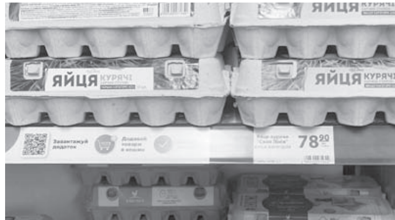
За жовтень яйця у супермаркетах подорожчали в середньому на 60%. Подекуди вартість традиційного для українців продукту вже досягла 80 грн за десяток

— Основним фактором впливу на ціноутворення виступає собівартість виробництва яєць, яка