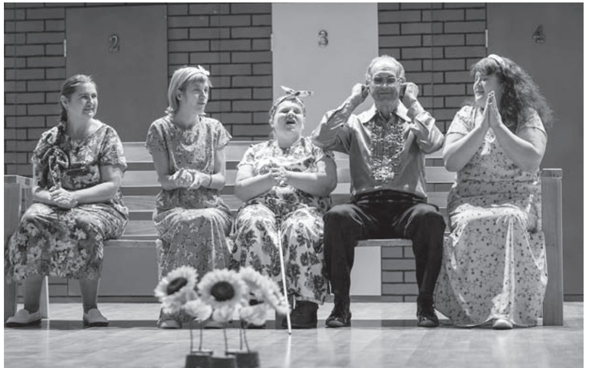
Театр незрячих з Бару показав на гастролях виставу «Лавка». Люди, які не бачать світ, грали тих, для кого він відкритий у всій красі

— Бо ж ми говоримо про виставу, в якій багато гумору, — пояснює співрозмовниця. —