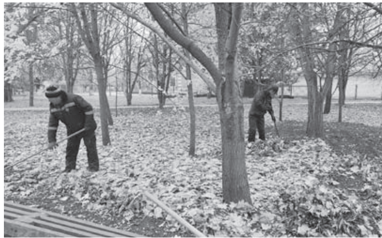
Частину опалого листя везуть на Сабарівське кладовище. Ним вкривають вільні сектори, щоб не мерзла земля і землекопи могли копати ями під час морозів

— Прибираючи там листя, комунальники ущільнюють ґрунт, що перешкоджає потраплянню води, а також кисню до дерев.