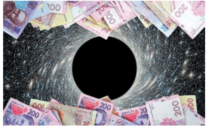
Найбільшою «чорною дірою» є міське теплоенерго. Тільки їм з початку року дали 319 мільйонів гривень

Тому уже отримані 74 мільйони гривень вінницький Водоканал