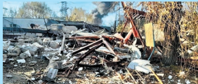
Вночі 17 листопада, внаслідок масованого російського ракетного удару, було знищено спортивну школу №2 відділення академічного веслування в Ладижині. Два елінги, збудовані протягом років відданими тренерами та батьками юних веслувальників, згоріли. Дитячі роздягальні та спортивний зал перетворені на руїни.