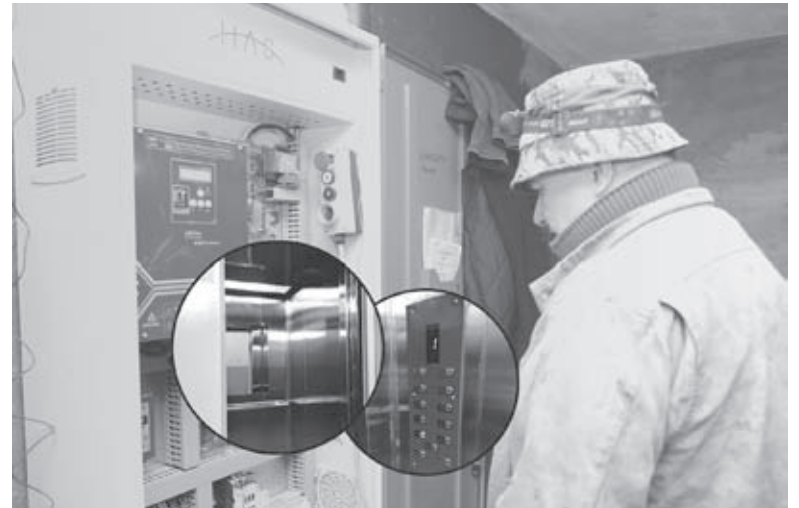
Подібний ремонт до цього виконали на Келецькій, 105. Оновили кабіну, замінили обладнання і встановили джерело безперебійного живлення

Ще поставлять нову лебідку, замінять редуктори та електродвигуни на відкриття дверей, оновлять кабіну, куди постав-