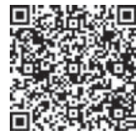
ДИВІТЬСЯ ВІДЕО НА 20MINUT.UA

За прогнозом НБУ, найближчими місяцями ціни підніматимуться вгору. Вже до кінця року інфляція може перевищити 10%. Пік зростання цін очікується у першому кварталі 2025 року — 11,4%.