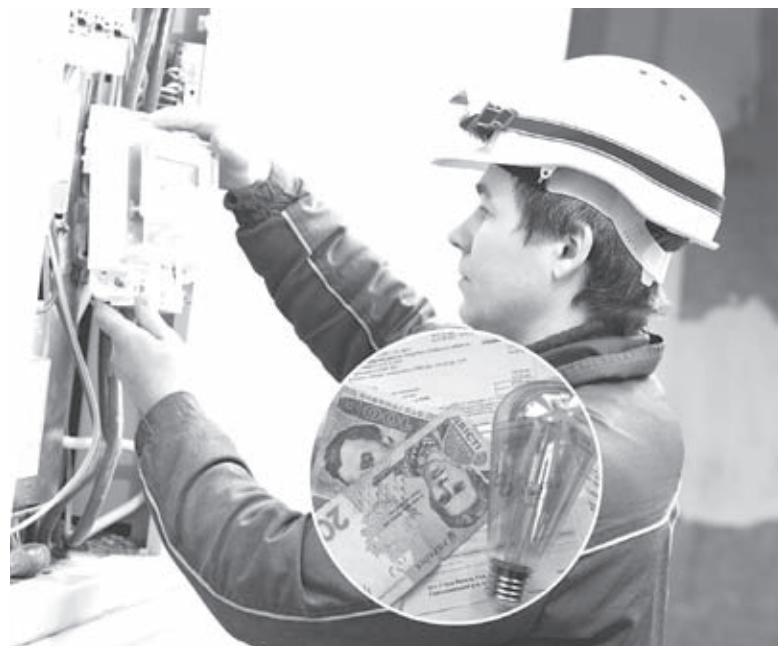
Чоловік каже, що борг він погасив за кілька днів до відключення. У «Енері» нам сказали, що оплата доходить до них за три-п'ять днів, тому оплати не бачили