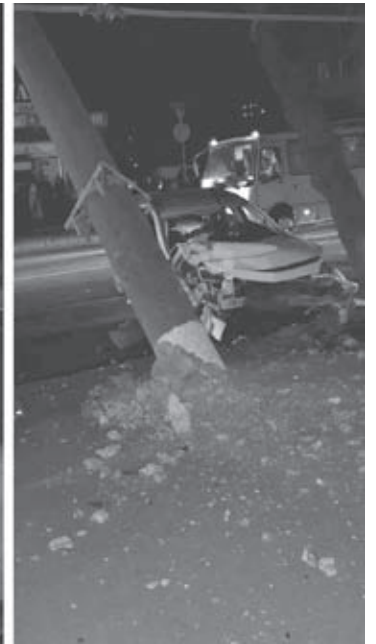
Внаслідок аварії на Київській важкі травми отримали мати з сином, які йшли повз. Хлопчик пішов на поправку, а його мама досі в реанімації