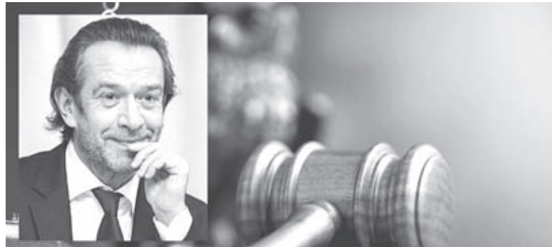
Актор володимир машков підтримав війну в Україні. Його засудили за двома статтями Кримінального кодексу України

Доказову базу слідчі збирають з відкритих джерел. Повістки на суд, а також повідомлення про підозру надсилають на електронні адреси. Інформацію по-