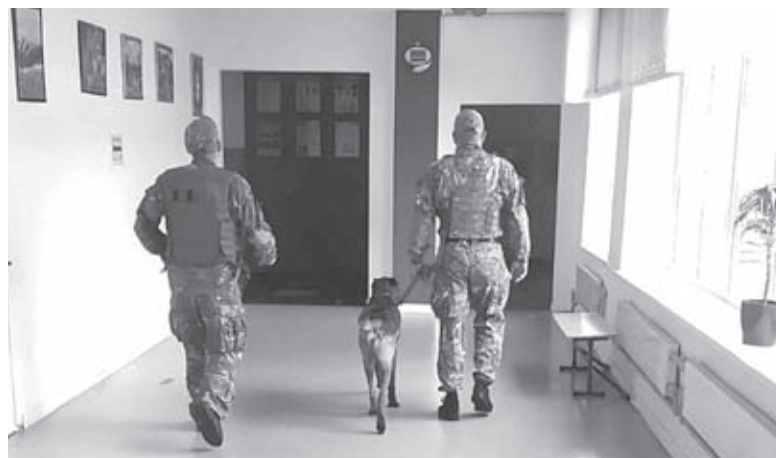
Вінницькі школи часто отримують повідомлення про замінування. Уроки зриваються, та поки про дистанційне навчання не йдеться

У вінницьких школах є автономне опалення, й укриттями всі забезпечені. Тому, за слова-