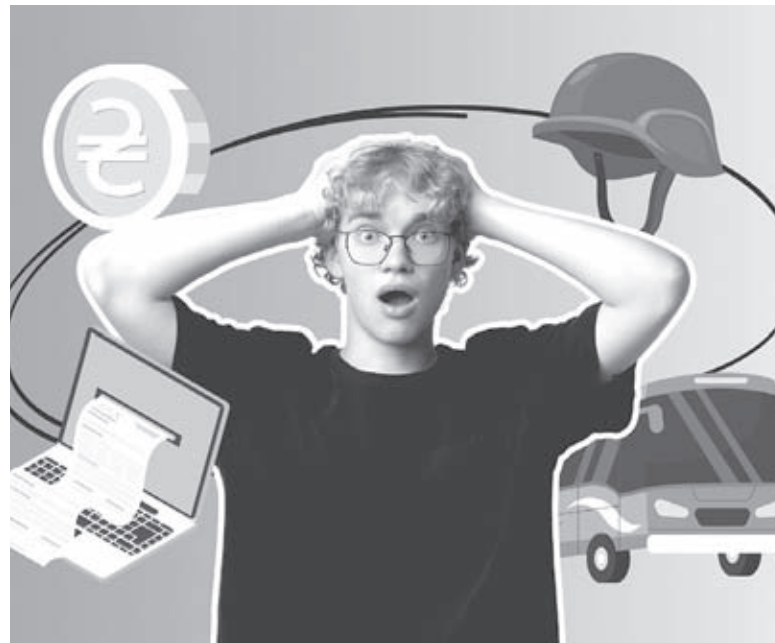
Однією з найголовніших змін є зміна ставки військового збору. На зарплати він тепер буде нараховуватися у розмірі 5%, а не 1,5%, як було раніше

Додатково звертатися за призначенням виплати не потрібно — її призначать автоматично завдяки інформації у держреєстрах. Кошти надійдуть на картковий рахунок отримувача допомоги.