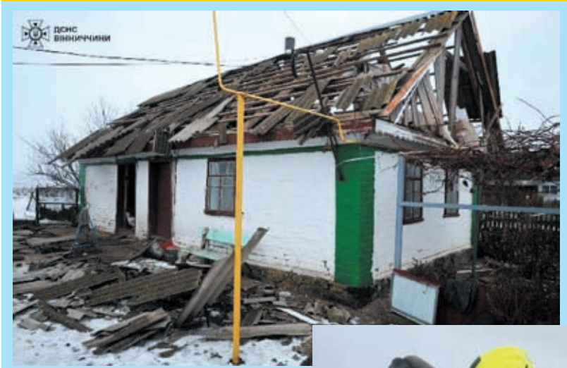
Вранці 28 листопада, внаслідок ворожої атаки, в Жабелівці Вороновицької громади частково зазнали руйнувань господарчі будівлі, житлові будинки та транспортні засоби. Крім того, на одному з об'єктів інфраструктури, внаслідок влучання ворожої ракети, сталася пожежа. Її бійці ДСНС оперативно ліквідували.