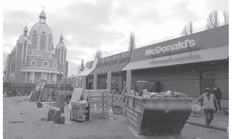
Це будівництво на фініші. Робітники викладають навколо об'єкта плитку, а зовні ресторан уже готовий

З інфраструктури тут планується: кафе, коворкінг, фітнес-зал, лобі, комерційні площі на першому поверсі, конференц-зал. Крім того, буде аптека, салон краси, мінімаркет, зарядні станції для авто,