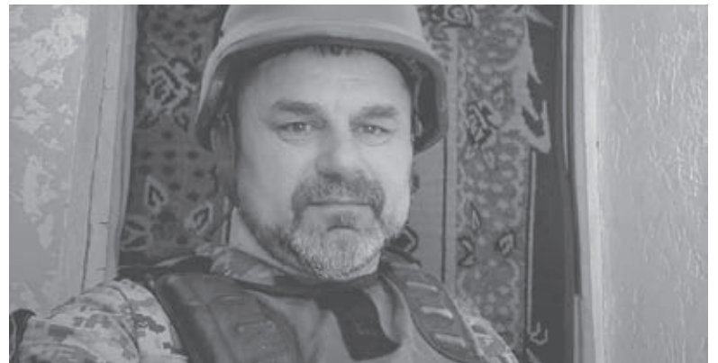
«Йомай» — мешканець Крижополя. З першого дня повномасштабного вторгнення він став на захист Батьківщини

Також воїн зазначив, що йому дає надію: «Діти України. Найбільше крається душа, коли думаєш, що їм доводиться переживати. А потім на зміну цьому почуттю приходиться радість: так, зростають у важкі часи. Зате точно знають, хто наш ворог і на що він зда-