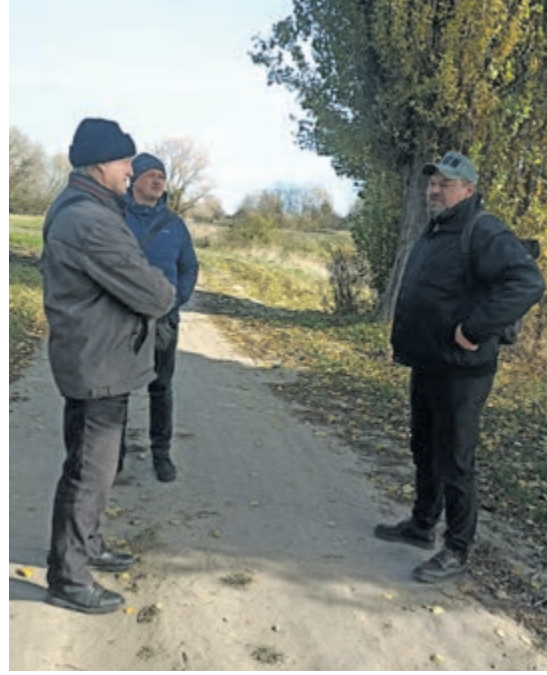
Фахова розмова біля Виспи із краєзнавцями-житомирянами

ким чином постає завдання популяризації певних знань, певних об'єктів, які давно викликають відчутний інтерес у туристів. Зазвичай цим займаються краєзнавці, які досліджують архіви, збирають усні свідчення і пишуть книжки. Однак важливо, аби у кожному місті, у кожній громаді з'являлося ціле краєзнавче середовище, яке не лише досліджувало б чи накопичувало артефакти та експонати, але й популяризувало їх.