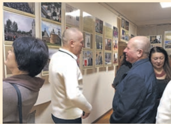
Виставка про поляків Житомирщини тепер і в Романові