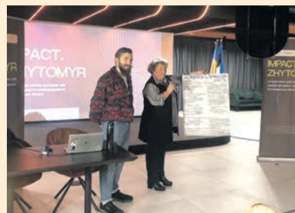
Хакатон – то лише початок естонського навчання

Хтось колись сказав, що найбільшу цікавість викликають не стільки імена та прізвища авторів есе, які стануть переможцями конкурсу, бо насправді куди цікавішими стануть і будуть висловлені у написаних есе думки, припущення, оцінки та пропозиції, які зачіпають завжди актуальну для будь-якої громади тему. Так що вже у наступному виході наша газета розмістить уривки,