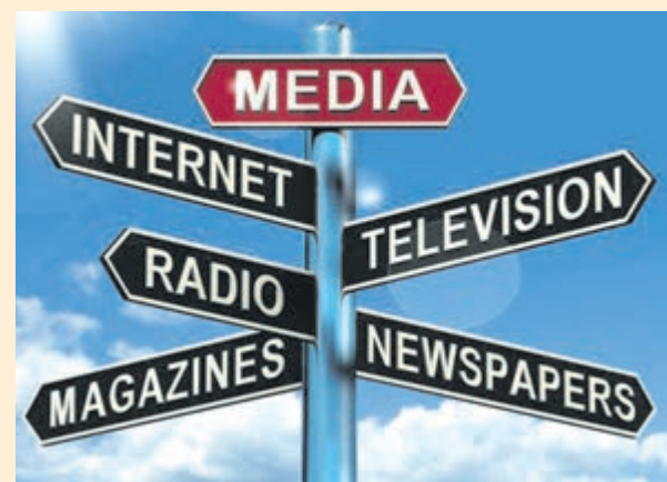
Медіаграмотність – це не тільки для школярів!