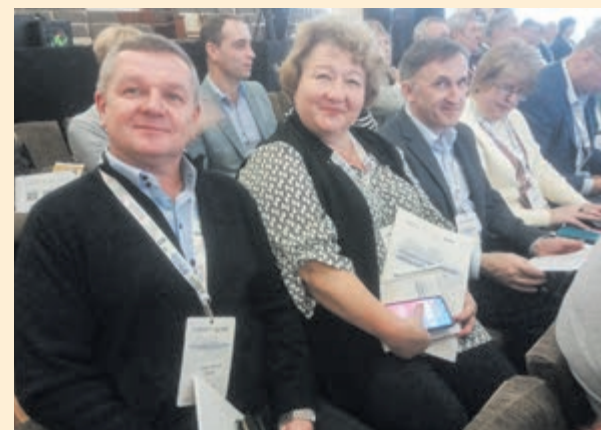
І знову – про ліцей! Поки що – лише розмови