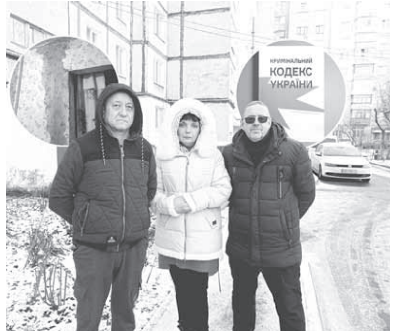
Арешт рахунків і те, що течуть дахи — сталося через голову ОСББ, кажуть жителі дому. На нього вже подали заяву до поліції, триває розслідування

— Одразу на зборах прийняли рішення викликати поліцію. Після нашої заяви відкрили кримінальне провадження за части-