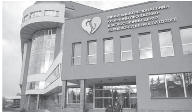
Будівля нового кардіоцентру має 7 поверхів. В середині діагностичні, реанімаційні та операційні відділення з сучасним обладнанням

Однак до початку реального будівництва справа дійшла лише влітку 2018-го. Новий корпус обіцяли ввести в експлуатацію за два роки, у 2020-му. Він мав вміщати 138 ліжок, з яких шість реанімаційних.