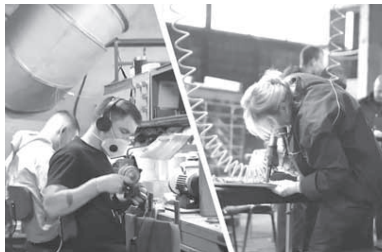
Харківська компанія «Сталекс» дала роботу 150 вінничанам. На «УКпостачі» працюють близько 125 людей з нашого міста

— Адже ми розуміємо, що через бойові дії не завжди є можливість забрати з собою не тільки виробничі потужності підприємств, а й автентичні документи, — сказав заступник мера.