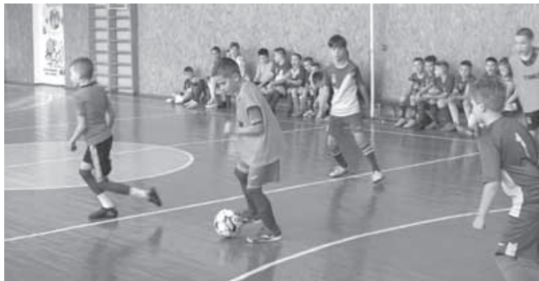
У фіналі новорічного футзального турніру зустрілися команди ліцеїв №11 і №16