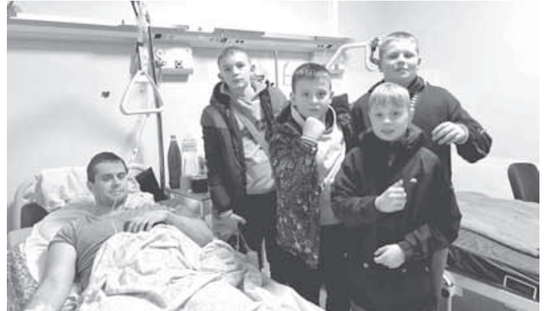
Шестикласники охоче йдуть до поранених. Ті їх радо зустрічають і відповідають на усі питання