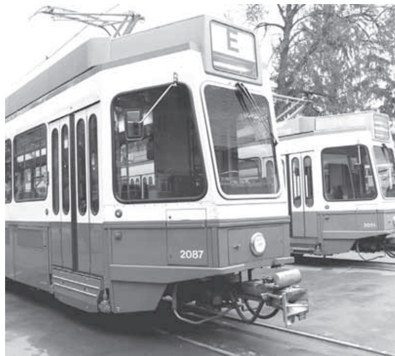
Низькопідлогові вагони стануть більш доступними для людей на кріслах та для інших категорій населення. Дослідний зразок планують випустити цього року

Володимир Дудко додає, що їхній досвід переобладнання