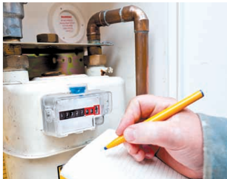
На остаточну суму впливає річна замовлена потужність. Це те, скільки ви напалили газу за попередній рік

За такої моделі утворення тарифу виходить так, що якщо у цей період ви «напалили» газу більше, ніж зазвичай, то і платіжка за доставку буде для вас більшою. Менше — відповідно зменшиться і розмір суми у квитанції за розподіл.