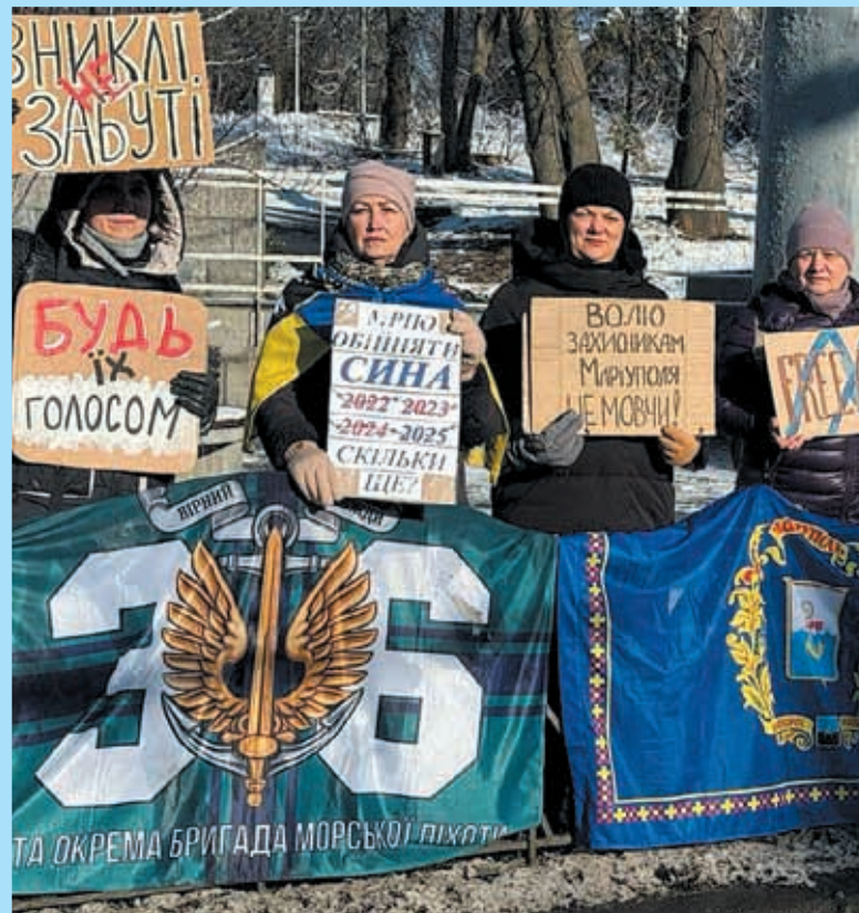
У Вінниці в суботу, 11 січня, відбулась акція «Не мовчи – полон вбиває». Учасники закликали суспільство не залишатися осторонь, поширювати інформацію про героїв воїнів і привертати увагу до проблеми полону на всіх можливих рівнях