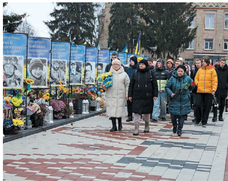
Алея Героїв у центрі Жмеринки. Звідси жінка з Києва викрала квіти, за що її оштрафували на понад 10 тисяч гривень