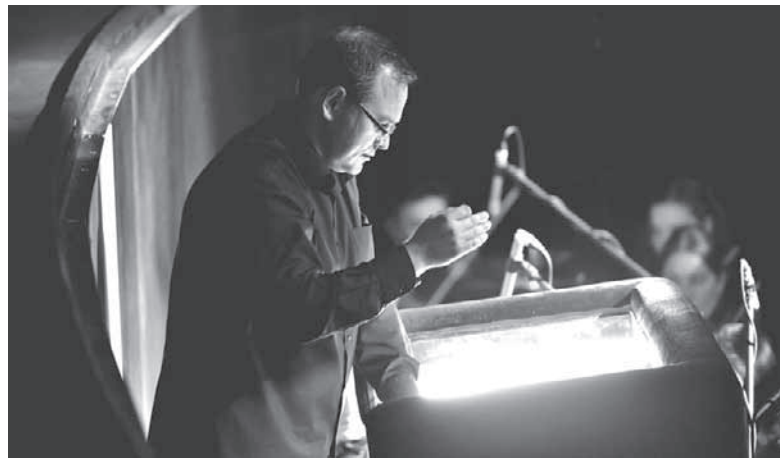
Головний диригент Національної оперети України Сергій Дідок: «Наш концерт буде сповнений любові, добра і краси. Вінничан та гостей міста щиро запрошуємо»

— Національна оперета України — бренд і гордість України. І ми щасливі, що маємо змогу у День закоханих подарувати вінничанам незабутню зустріч із цим славетним театром, який завжди вражає найвищою майстерністю й блискучими новаторськими ідеями, та збирає аншлаги не лише в Україні, а по всьому світу, — каже очільник Вінницької філармонії Віктор Бронюк. — У грудні з генеральним директором — художнім керівником Національної оперети України