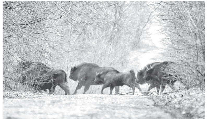
На Вінниччині одна з найбільших в Україні популяцій зубра. За даними минулорічного обліку, у стаді налічується 125 тварин, які мешкають на площі 12 тисяч гектарів

Проблему вдалось виявити лише після початку розмінувальних робіт, тож уже впродовж кількох років стадо старіє і продовжуватиме старіти, якщо їм не переселити молодих продуктивних самців.