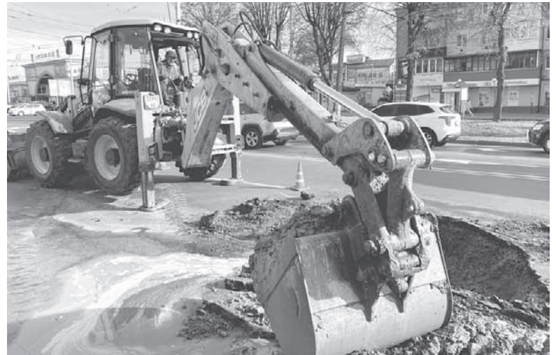
Щодня працівники водоканалу ліквідовують щонайменше п'ять аварій. Якщо фахівців не вистачатиме, вінничани довше сидітимуть без води

За її словами, саме ці фахівці відповідають за актуальність інформації про всі мережі водо-