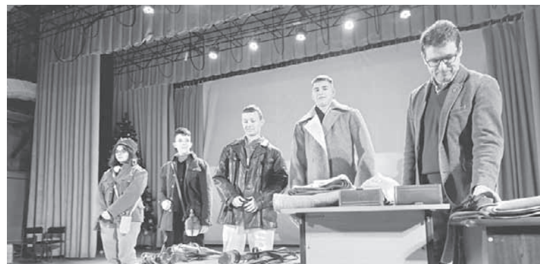
Такий вигляд мав верхній одяг українських бійців у 1919–20 роках. Носили навіть шкіряні куртки