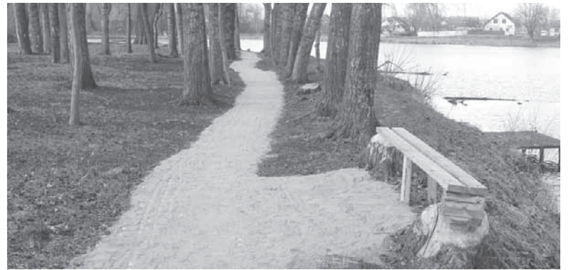
Біля водокачки облаштували доріжку. Тепер тут зручно гуляти навіть з дитячим візочком

— От дивіться, зранку кожного дня і до 14-ї години вулицею ринку ходять люди, а собаки здійснюють гавкіт на якусь конкретну людину. Чим їм не сподобався даний перехожий — відомо тільки собакам. Сьогодні хтось із природоохоронної організації фо-