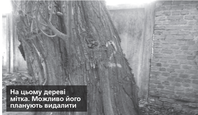
На цьому дереві мітка. Можливо його планують видалити

Громадянам, правлінню ОСББ та старостам рекомендують натомість посадити нові насадження. Але, на жаль, не завжди замість зрізаного дерева висаджують нове. Маємо яскравий приклад минулого року. Торік ми робили запит до міської ради, аби дізнатися, скільки дерев видалили і скільки посадили нових за період із липня 2023-го до липня 2024-го. Виявилось, що нових посадили сто тринадцять, а видалили старих двісті два. Додамо сюди ще один важливий фактор — молоді саджанці не завжди приживаються. Всі ж пам'ятають, що сталося із віргінськими черемхами сорту «Шуберт», котрі виса-