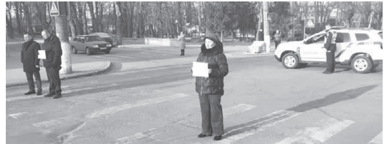
У Козятині розпочали акцію «Зупинись. Хвилина мовчання». Щодня родини загиблих Героїв та небайдужі виходять на вулиці міста з табличками і зупиняють містян

Ми звернулися з інформаційним запитом у Козятинську міську раду, аби дізнатися, що з гучномовцями, чому не зупиняється громадський транспорт та яку роботу проводять з мешканцями громади щодо хвилини мовчання.