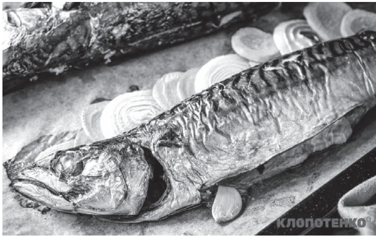
Перед подачею збризніть лимонним соком. Нехай смакує!

• Випікайте рибу протягом 20-30 хвилин при 180 градусів.