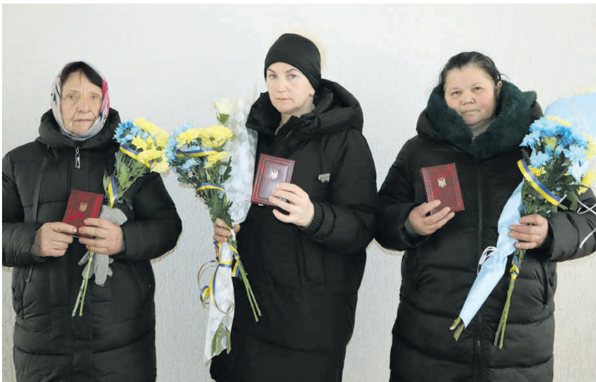
Героїчні мами лицарів-синів

Таким чином, ухваливши з пів сотні рішень із багатьох проблемних питань життя громади, депутати завершили свою роботу. Якщо врахувати, що чергові вибори до Романівської селищної ради мають (згідно з Конституцією України) відбутися наприкінці жовтня 2025 року, то часу для роботи на благо громади у депутатів не так вже й багато. Якихось п'ять чи шість разів депутатам, напевно, доведеться зібратися у сесійному залі. Можна було б і ледарям та прогульникам постаратися, аби хоча б на фініші депутатської каденції надолужити пропущене чи прогаєне. Адже люди ж можуть і запитати про підсумки, про те, для чого було йти у владу, а головне – як бути далі!