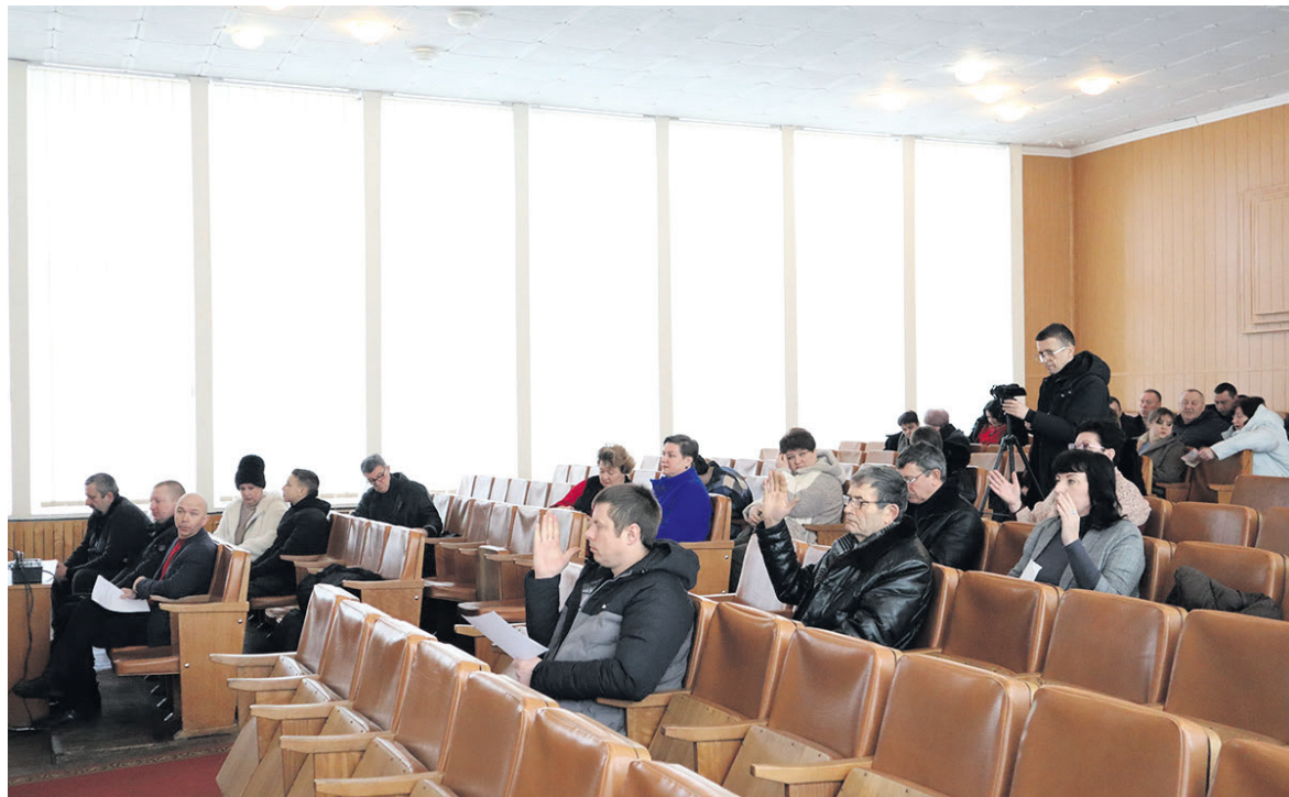
65-та сесія Романівської селищної ради

Не стала виключенням і чергова, 65-а, сесія Романівської селищної ради, скликана 21 лютого 2025 року. Лише в останню мить у сесійному залі з'явилося двоє депутатів, поява яких, власне, й дозволила розпочинати сесію. Проте й надалі відвідування сесій