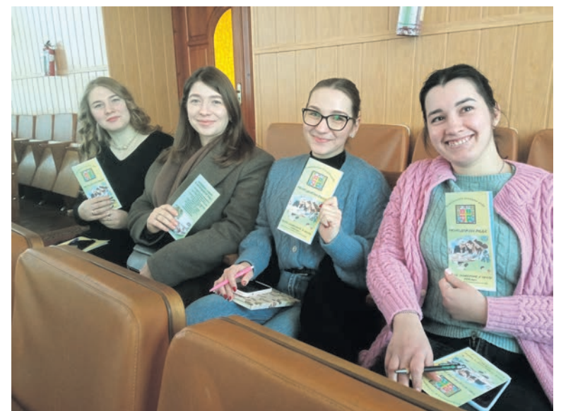
Представники "молодіжки" на депутатських місцях: вигляд дуже пристойний

Сесія Романівської селищної ради 21 лютого 2025 року ухвалила рішення щодо затвердження кошторису заміни (капітального ремонту) димової труби твердопаливної котельні Врублівського ліцею. Отже, вже найближчим