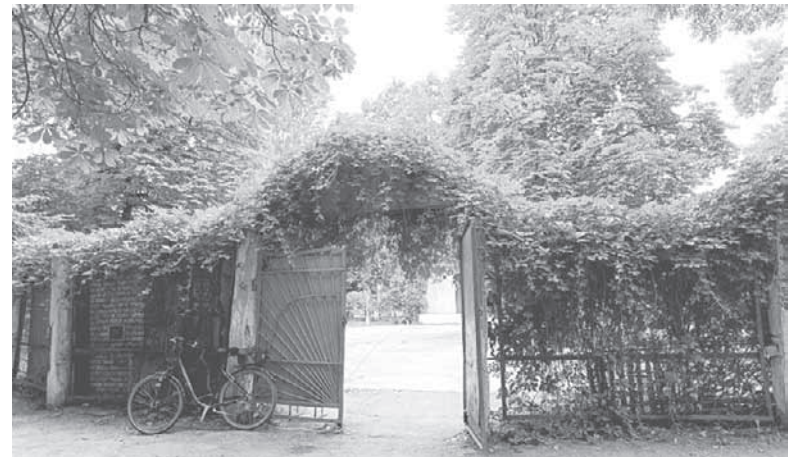
Це фото ми робили влітку минулого року. Козятинчани хочуть аби воно не було пусткою, щоб там знову проводили заходи для молоді

Влітку минулого року наші журналісти вже порушували цю тему. Тоді ми запитували керівництво відділу культури, на балансі якого перебуває «клітка», чому під час заходів, які проводять влітку у сквері, її не використовують. Тоді начальник відділу культури Світлана Рибінська пояснила, що заходи у клітці не проводять передовсім тому, що на майданчику немає затінку, на відміну від центральної частини скверу, де проводять концерти та ярмарки. А ще «клітка» всередині не зовсім безпечна, адже через величезний каштан, що росте прямо посеред майданчика і своїм корінням проламав бетонне покриття, можна перчепитися.