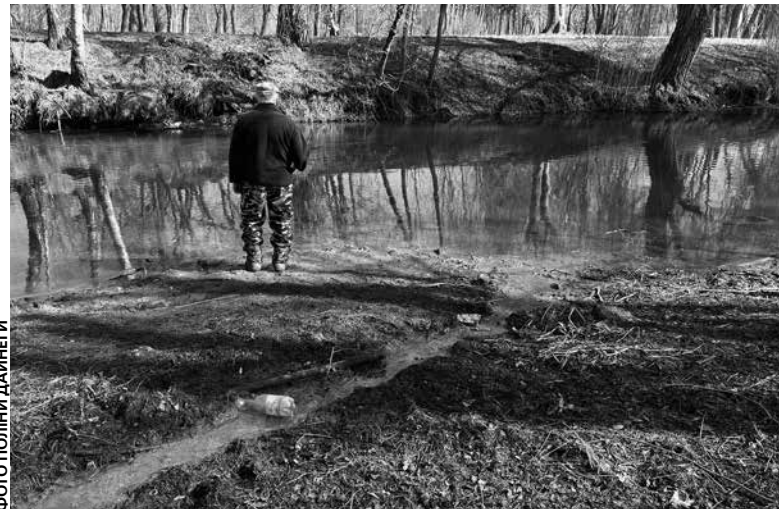
Іржаву стежку, яка веде до річки Серет, видно з підвісного мосту

зали, що ця рідина — не стічні води. Як варіант, це можуть бути підземні води. У тому місці раніше був водозабір, його закрили, але там могли залишити металеві труби. Через вологу вони могли заіржавіти і тому рідина має такий колір. Небезпечних елементів, речовин у рідині не виявили, показники у межах норми, — повідомив начальник