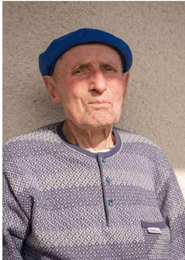
Свою професійну діяльність пан Степан розпочав у 1961 році, ставши до лав вогнеборців