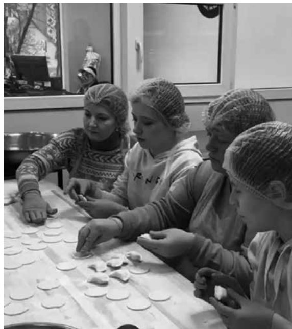
Щоразу майстеркласи проводять для різних категорій. Це можуть бути дружини, які чекають на повернення рідних з фронту