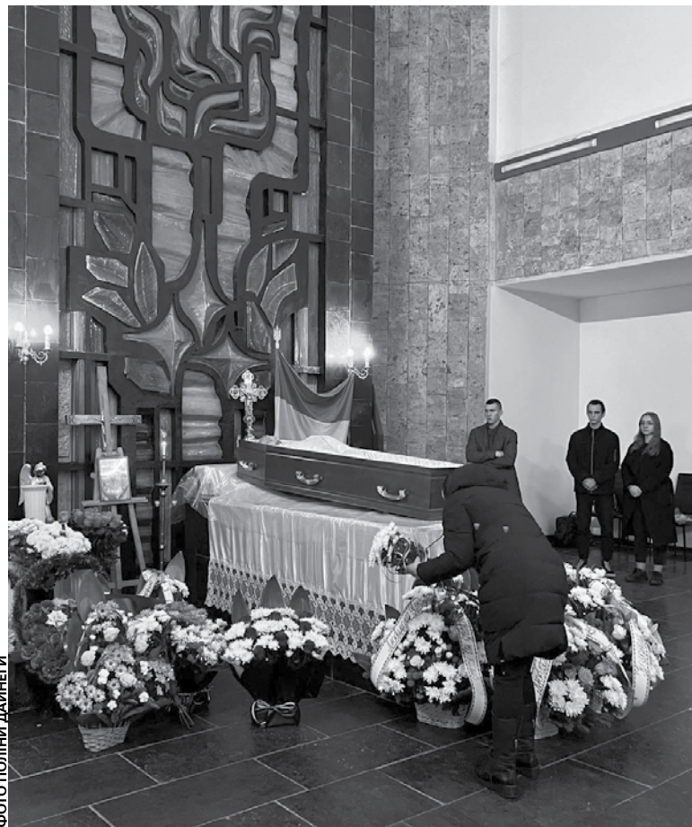
Біля труни загиблого захисника залишали букети квітів