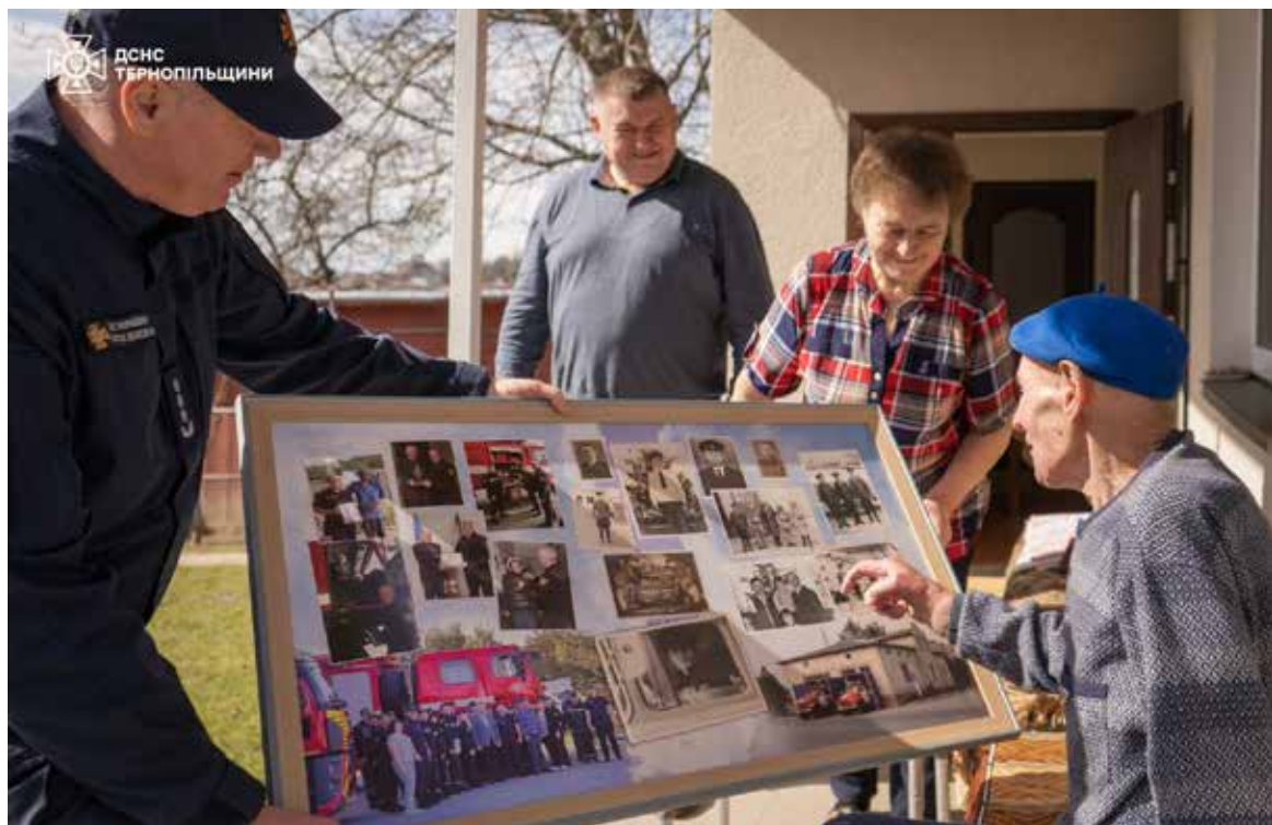
Кількість ліквідованих пожеж і врятованих людей сьогодні неможливо порахувати

— Хай поруч завжди будуть близькі люди, а небо над вами буде мирним і ясным. Нехай Господь оберігає вас і дарує Своєю опіку та благословення, — побажали вогнеборці.