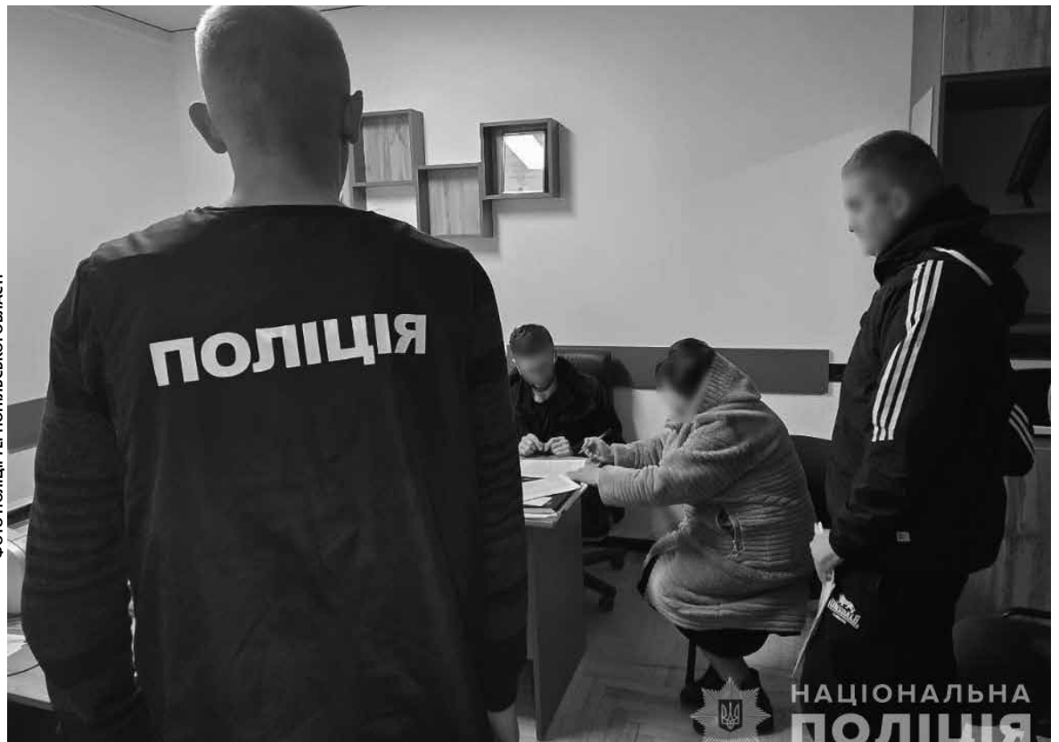
За вирок суду підприємця отримала два роки умовно

Як йдеться у матеріалах справи у Судовому реєстрі, перші 40 тисяч гривень підприємця занесла головлікарю у липні 2024 року. «Платила за надання можливості обвинуваченій, без документального оформлення, використовувати частину приміщень КНП «Тернопільська обласна клінічна психоневрологічна лікарня» облради для здійснення господарської діяльності з організації поховань та наданні суміжних послуг, а також безперешкодного здійснення господарської діяльності в приміщеннях КНП «Тернопільська обласна клінічна психоневрологічна лікарня» Тернопільської облради».