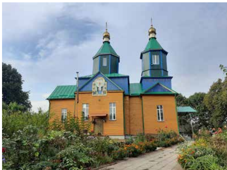
У вересні 2025 року мали святкувати сторіччя церкви. Планують до цієї дати відбудувати новий храм