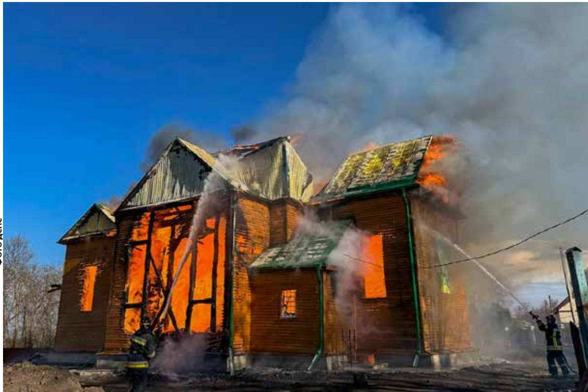
Церква була дерев'яною, тому зайнялося і згоріло все за лічені хвилини