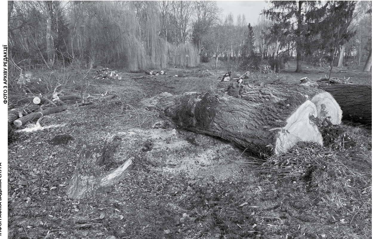
Дерева зрізатимуть на території громади, зокрема і в парку Загребелля