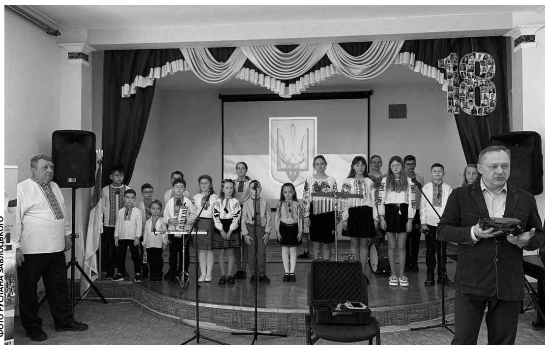
Щоб зібрати більше коштів, діти виступають не лише в Тернополі, а й інших населених пунктах області

Зараз юні артисти готують нову програму, аби й надалі збирати кошти на підтримку ЗСУ. Вони переконані: спільними зусиллями перемога буде швидшою!