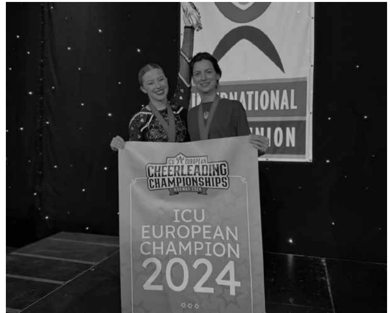
Черліденг розвивають завдяки шкільній лізі «Пліч-о-Пліч» та успіхам спортсменок із Fit Kid

Вхід для глядачів на спортивну подію — благодійний внесок від 100 гривень. Кошти організатори додадуть до збору, організованого Львівським відокремленим підрозділом ВФЧ, на спеціальні ліжка у паліативне та реабілітаційне відділення у «Дім метеликів» та міжнародний центр «Місто добра», який зокрема опікується дітьми-сиротами та матерями в складних ситуаціях, яких евакуювали з територій, де війна.