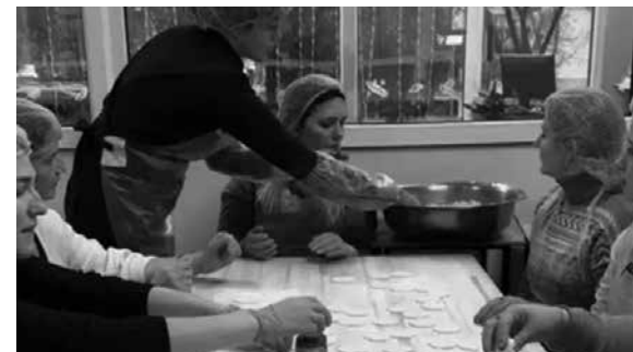
На кожній зустрічі обов'язково присутні психологи. Це не є лекцією