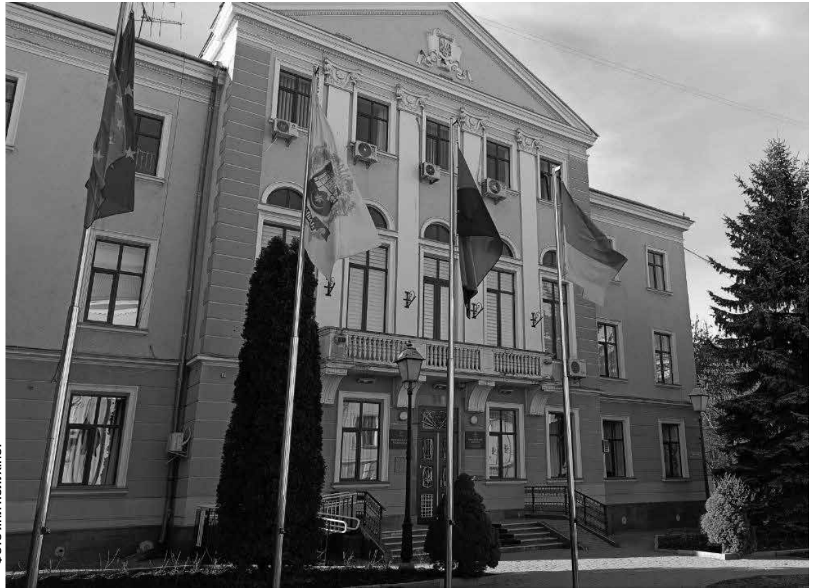
Дані щодо зарплати міського голови та заступників за 2024 рік журналістам вдалось отримати не одразу. А інформацію про премії та доплати лише після звернення до Уповноваженого