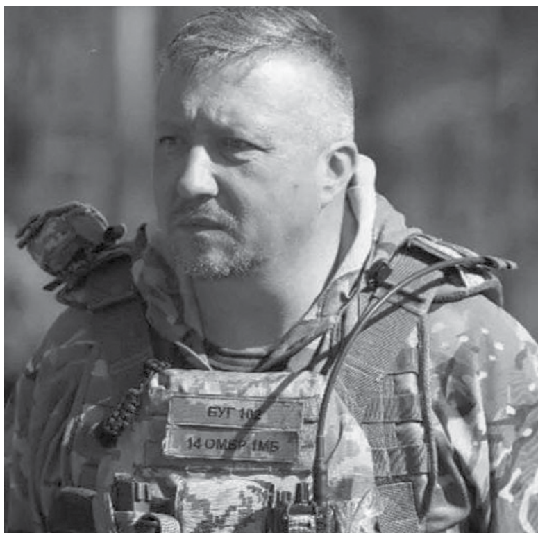
Військовий мав дев'ять поранень, а ось десяте – забрало його життя