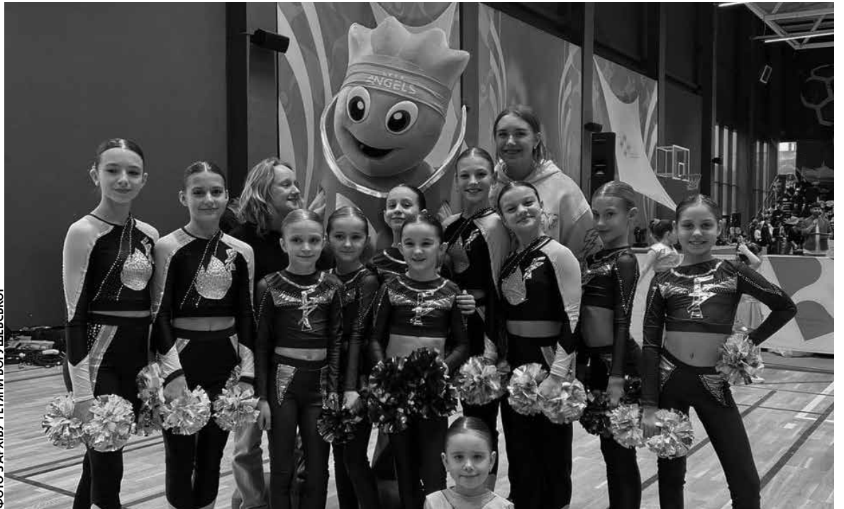
Kit Kid Cup, саме таку назву матиме змагання черлідерів, має перспективу стати чудовим весняним традиційним турніром

Кубок області з черліденгу відбудеться 5 квітня за адресою: вул. Братів Бойчуків, 4А. Уже зареєстру-