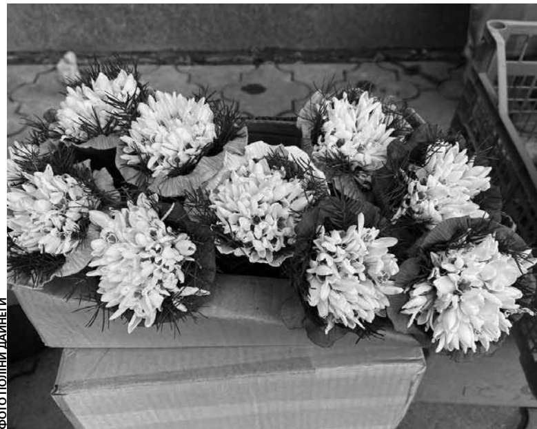
Квіти продають, сформували у невеликі букети, разом з гілочками ялинки та туї

■ частина перша статті 88–1 Кодексу України про адміністративні правопорушення: за незаконне придбання, збут та розповсю-