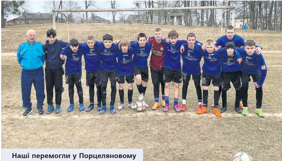
Наші перемогли у Порцеляновому

Успіх футболістів старшого покоління впевнено підхоплюють і юні романівчани, які навчаються у футбольному класі Романівської ДЮСШ. Нещодавно ми розповідали про турніри, в яких юні футболісти із Романова жодного разу не залишалися