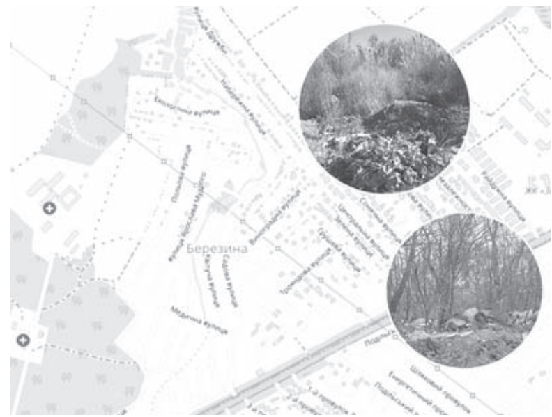
Сміття вивозять, хто куди може. Мешканці Березини залишаються сам на сам із проблемою відходів

Тож це бюрократичне коло люди проходять вже втретє. І як кажуть в органі самоорганізації населення, сільрада свідомо підштовхує мешканців до розміщення контейнерних майданчиків виключно в межах смуги відведення траси М-21. Хоча це прямо суперечить чинному законодавству.