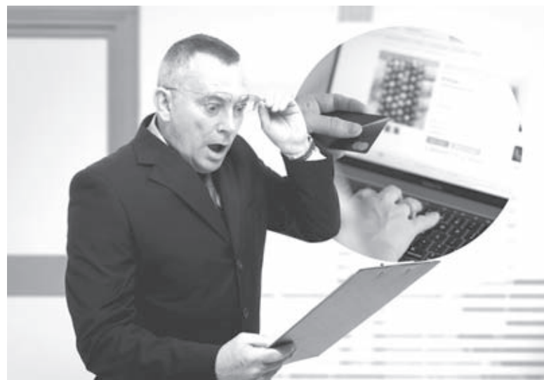
Онлайн-торгівля під прицілом. Податкова отримує все більше інструментів для контролю за переказами