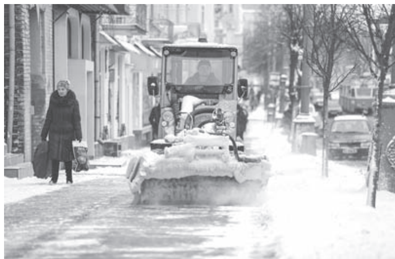
Чи не вперше цьогоріч вінничани побачили справжній сніг і відчували морози. Однак сталося це у квітні

За словами працівниці гідрометцентру, ймовірність того, що синоптики фіксуватимуть у Ві-