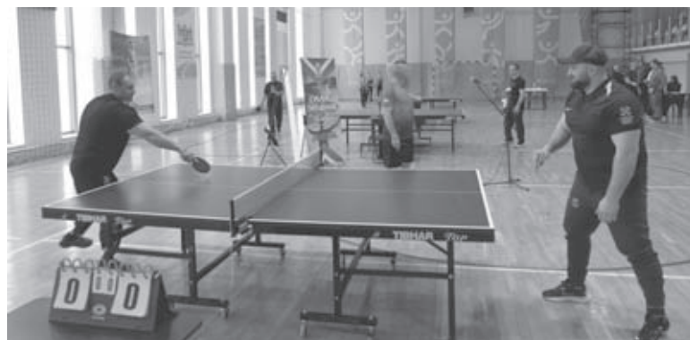
У турнірі взяли участь два десятки ветеранів війни. Це поранені воїни, які проходять у нашому місті реабілітацію

Добре, що не забувають ветеранів війни. До ампутації я грав практично у всі види спорту. Люблю футбол, волейбол і баскетбол. Наразі очікую протезування. Але чи зможу займатися спортом на протезах, поки що рано обговорювати, — сказав він.