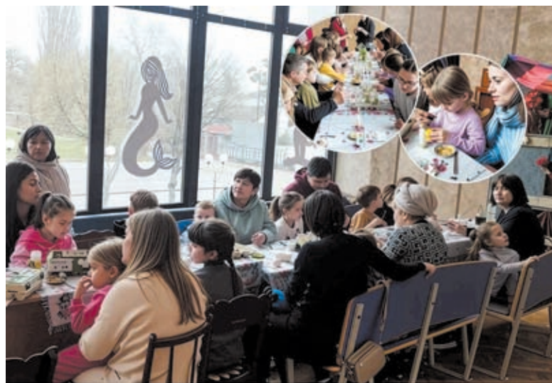
На майстеркласі в ляльковому театрі діти розписували писанки. У творчій атмосфері вони не лише освоювали техніку, а й відкривали для себе глибину великодніх традицій