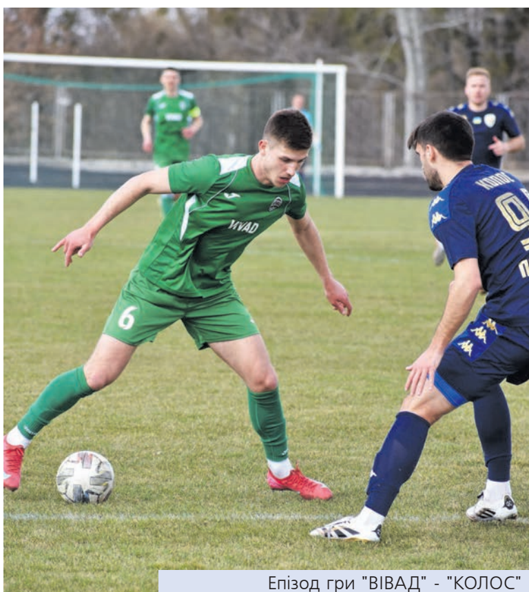
Епізод гри "VIVAD" - "КОЛОС"

Щодо перебігу подій у поєдинку між «VIVADом» і «Колосом», то все розпочалося із атак господарів поля. В принципі увесь перший тайм пройшов під диктовку FC «VIVAD», хоча жодного м'яча у ворота суперників чемпіони Житомирщини не забали.