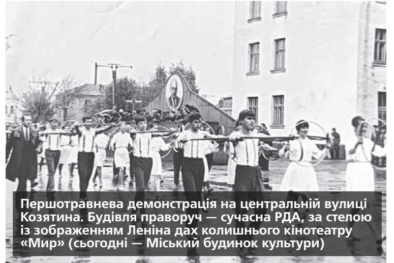
Першотравнева демонстрація на центральній вулиці Козятин. Будівля праворуч — сучасна РДА, за стелою із зображенням Леніна дах колишнього кінотеатру «Мир» (сьогодні — Міський будинок культури)

Дерев'яний храм розташовувався на сучасній вулиці Винниченка, на території нинішньої Центральної районної лікарні. Із Вознесенської церкви забрали дванадцять срібних та позолочених предметів. Серед най-