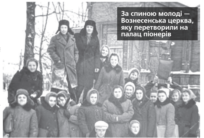
За спиною молоді — Вознесенська церква, яку перетворили на палац піонерів

цінніших — Євангеліє в срібній палітурці та срібний хрест. Срібла у вилучених предметах було загальною вагою в 18,2 кілограма. За сучасними цінами на срібний брухт це приблизно понад 272 тисячі гривень.