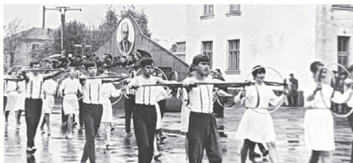
ЯК У КОЗЯТИНІ КОМУНІСТИ НИЩИЛИ РЕЛІГІЮ