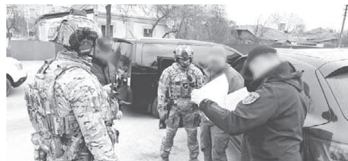
У КОЗЯТИНІ ВЗЯЛИ НА ХАБАРИ ПОСАДОВЦЯ ТЦК