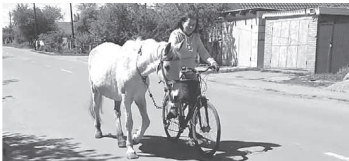
«АМАНДА ЗА 34 РОКИ НЕ БАЧИЛА БАТОГА»