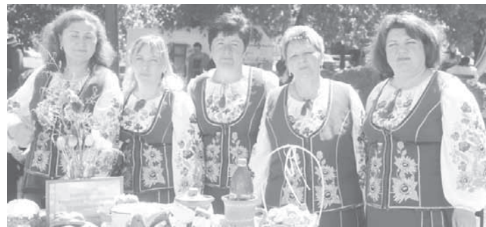
ФЕСТИВАЛЬ КОЛОТУХИ ПЕРЕВЕРШИВ ОЧІКУВАННЯ