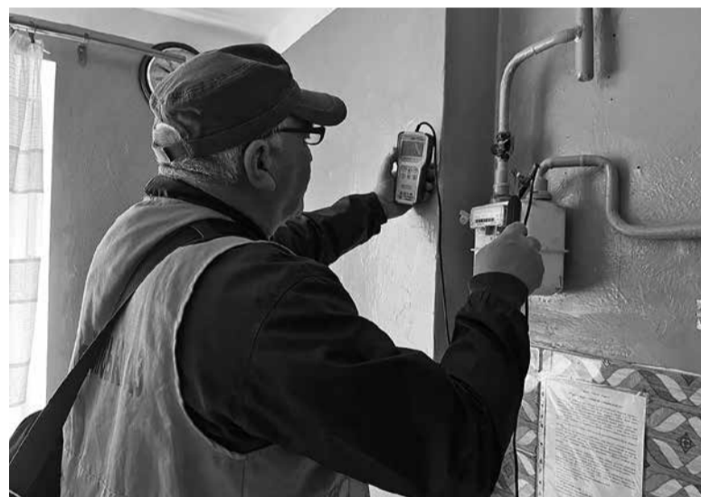
Один раз на 5 років мають перевіряти системи, що експлуатують менше 25 років