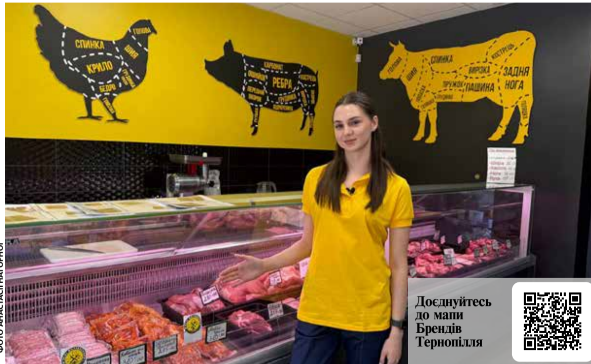
За кожним виробом тут стоїть не лише технологічний процес, а й люди, які добре знають свою справу

Значну частину асортименту становлять копченості та заку-