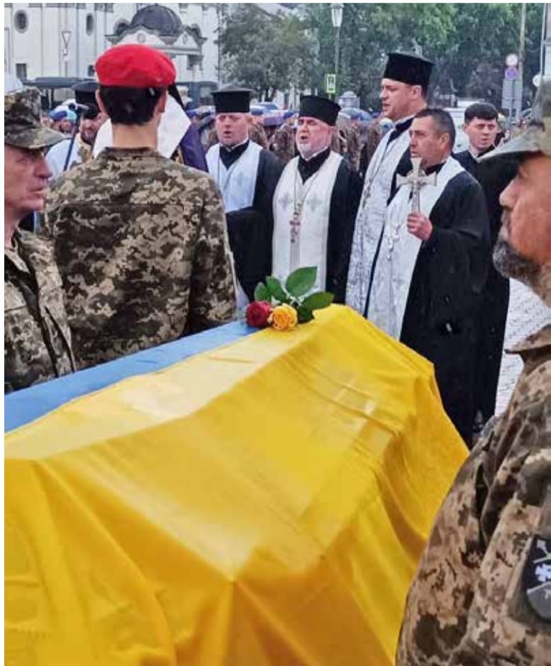
За душі невідомих Героїв помолились священнослужителі