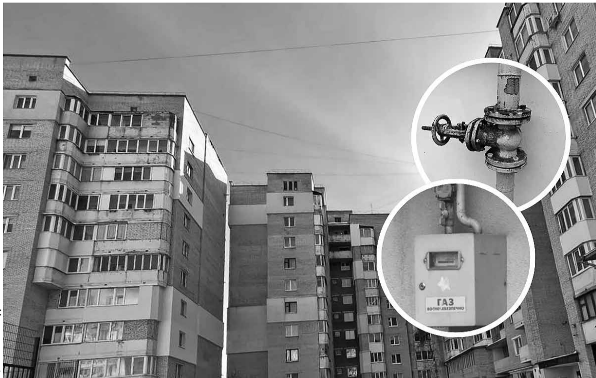
Якщо фахівці виявили проблему, то мають лише вказати на неї, а ось за усунення несправностей – додаткова послуга

вання та кріплення газопроводу, наявність футлярів у місцях прокладання через зовнішні та внутрішні конструкції будинку, стан ущільнення міжтрубного простору, очищення його від бруду та, в разі потреби, відновлення;