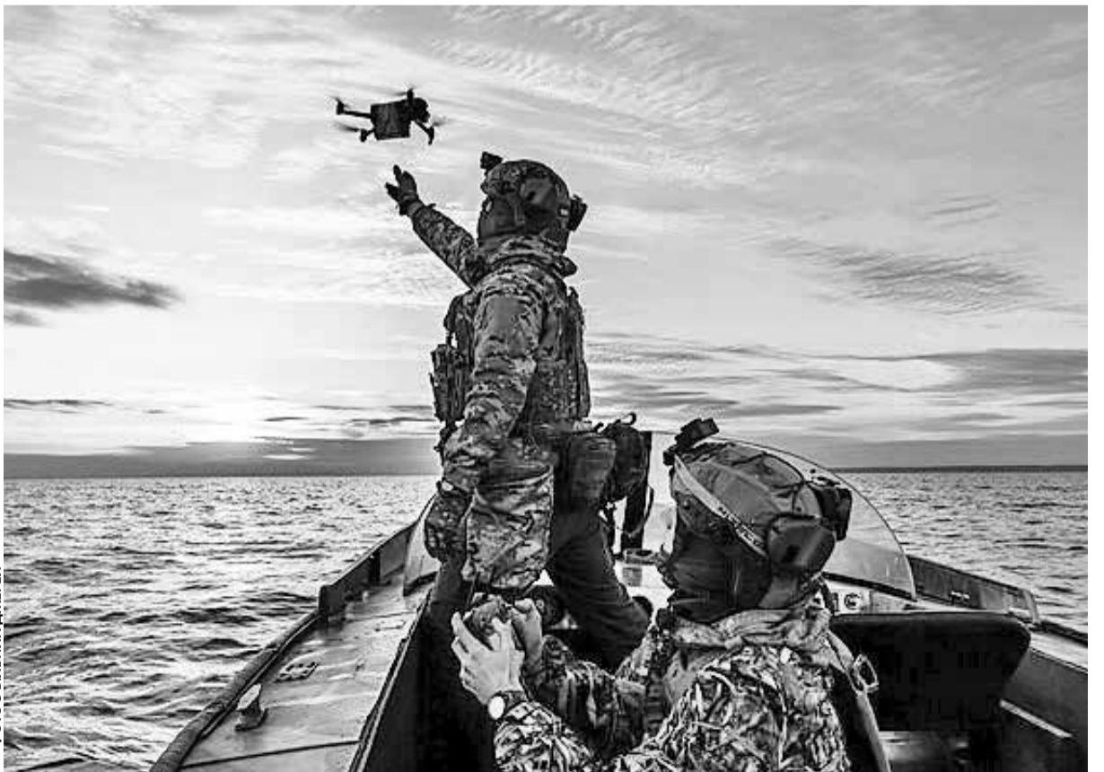
Човни потрібні захисникам для виконання завдань, а також порятунку своїх побратимів

Щоб швидше зібрати кошти, волонтерка разом з однодумцями організує благодійні ярмарки. Якщо бажаєте долучитися до збору — пожертви залишайте за реквізитами: 4874 1000 3774 8483 або 5168 7521 5795 4457.