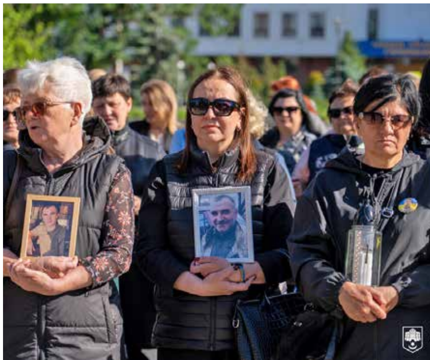
Молебень «Світло молитви в темряві війни» проводять кожної останньої п'ятниці місяця