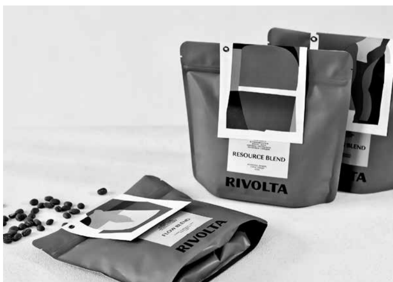
Кава Rivolta – це поєднання робусти та арабіки для створення ідеального смаку

Ірина переконана: для успіху важливо відчувати внутрішню силу. У будь-якій ситуації варто приймати те, що неможливо змінити. Завжди є вихід — потрібно лише адаптуватися, шукати рішення і помічати можливості.