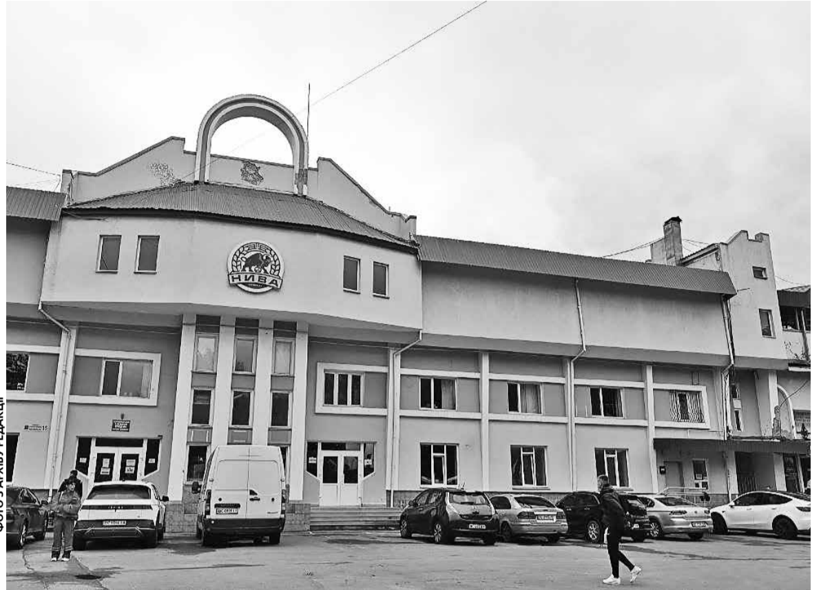
Години роботи тернопільського стадіону можуть збільшити. Відповідну петицію до міської ради підписали понад 500 мешканців

хідну кількість голосів, тепер її мають розглянути на засіданні виконавчого комітету. Відповідний проект рішення опублікували 28 травня.