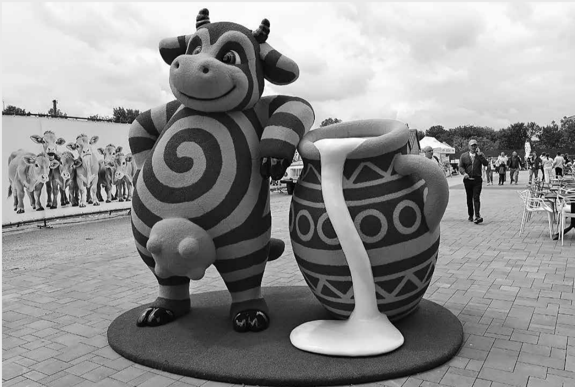
Відвідувачі фестивалю молока мали можливість сфотографуватись біля кількох тематичних фігур корів

Серед учасників голосування на фестивалі розіграли iPhone 17 Pro Max.