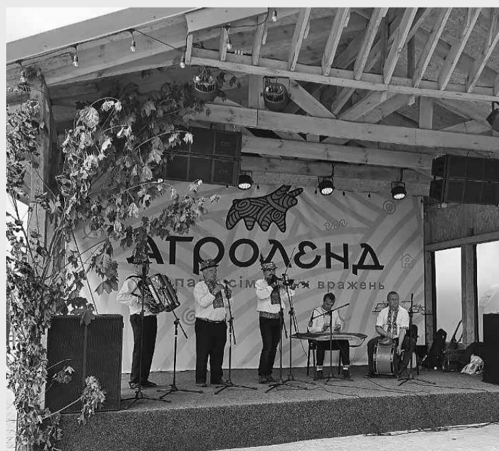
На двох сценах фестивалю весь день виступали музичні колективи, зокрема, гурт «Давня казка»