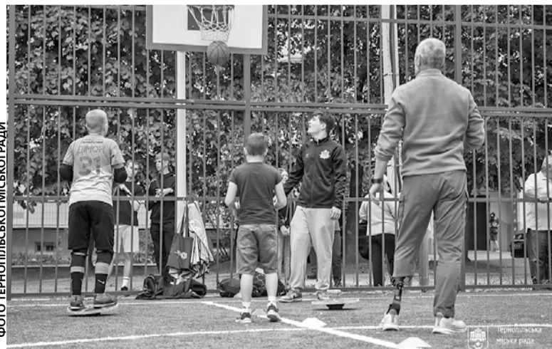
На новому майданчику займатися спортом можуть діти, молодь, дорослі і ветерани — усі, хто любить рух, спорт і активний відпочинок

Новий спортивний майданчик покликаний сприяти популяризації здорового способу життя, активного відпочинку та розвитку спортивної інфраструктури міста. Він стане місцем зустрічей, тренувань і нових спортивних досягнень для мешканців мікрорайону.