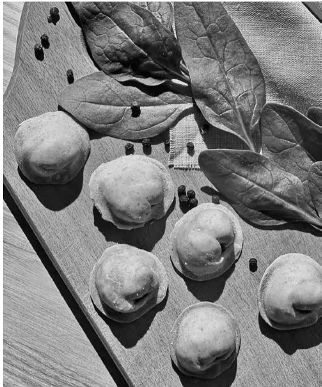
До тіста для пельменів і пасты додають сік шпинату, буряка та гарбуза – і смачно, і цікаво