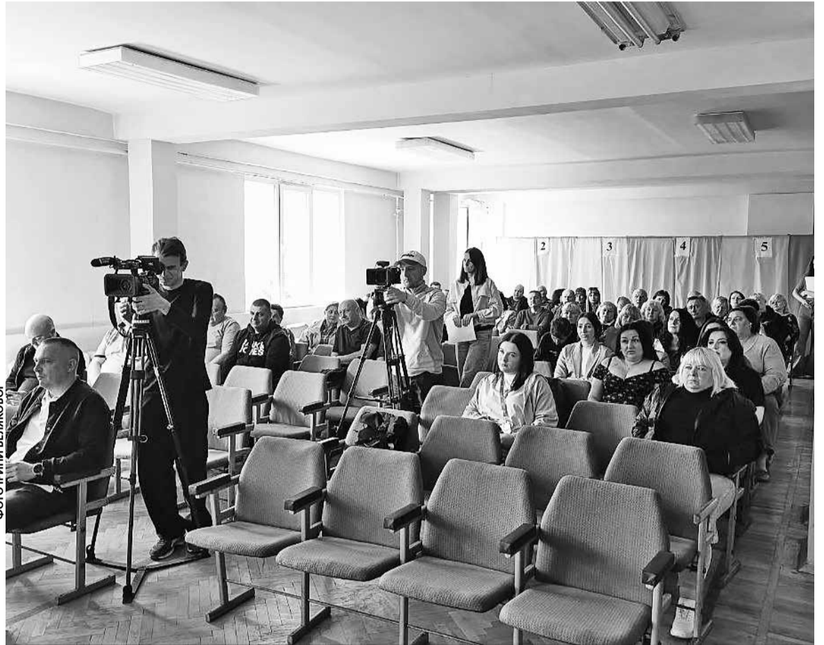
Близько півсотні людей прийшли на громадські обговорення щодо нового тарифу на проїзд

— Той тариф, який прийняли як тимчасовий, він теж не допомагав. Ми зайшли в борги по дизпаливу, по паливно-мастильних матеріалах. У нас автобуси МАН великої місткості, які обслуговують маршрут «19». Середньодобова заправка цього автобуса — 100 літрів. Вартість пального піднялась, мали б і тариф так підняти, але включені в тариф й інші показники. Середня зарплата у нас на підприємстві мала бути 22 тисячі, ми дотримувались цього, тому що бронюємо працівників. А з червня вже — 26 тисяч, — каже директор товариства