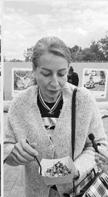
Натія зі Львова пригощаннями залишилась дуже задоволена