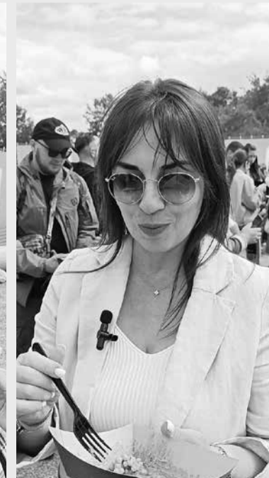
Тетяна із Запорізької області зізналась, не думала, що це настільки смачна страва