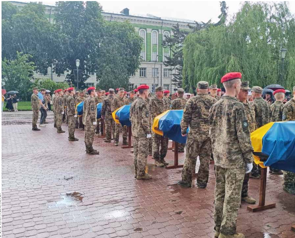
На майдані Волі прощалися із сімома захисниками, імена яких поки встановити не вдалося

Герої ■ Відбувся ритуал вшанування невідомих захисників України. Урочиста церемонія проходила на майдані Волі у Тернополі. Тут в останню путь провели сімох Героїв, чиї імена досі невідомі