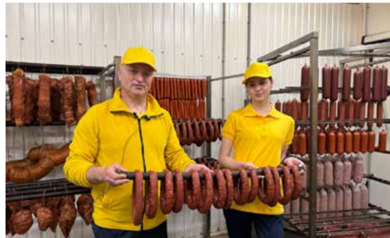
Асортимент формувалася роками — для звичайних покупців і закладів громадського харчування

цює з понеділка по п'ятницю з 9.00 до 17.00. Ціни — від виробника. Раді бачити всіх, — додає пан Володимир.