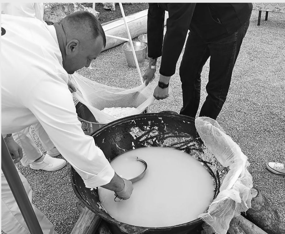
Сир із молока джерсейських корів варили просто неба. Потім відвідувачі могли продегустувати готову продукцію

Гості мали змогу не лише спостерігати за процесом сироваріння, а й продегустувати свіжоприготовлений продукт просто неба.