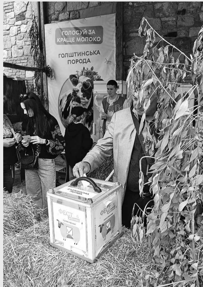
Молоко джерсейської породи корів у підсумку набрало найбільшу кількість голосів на фестивалі