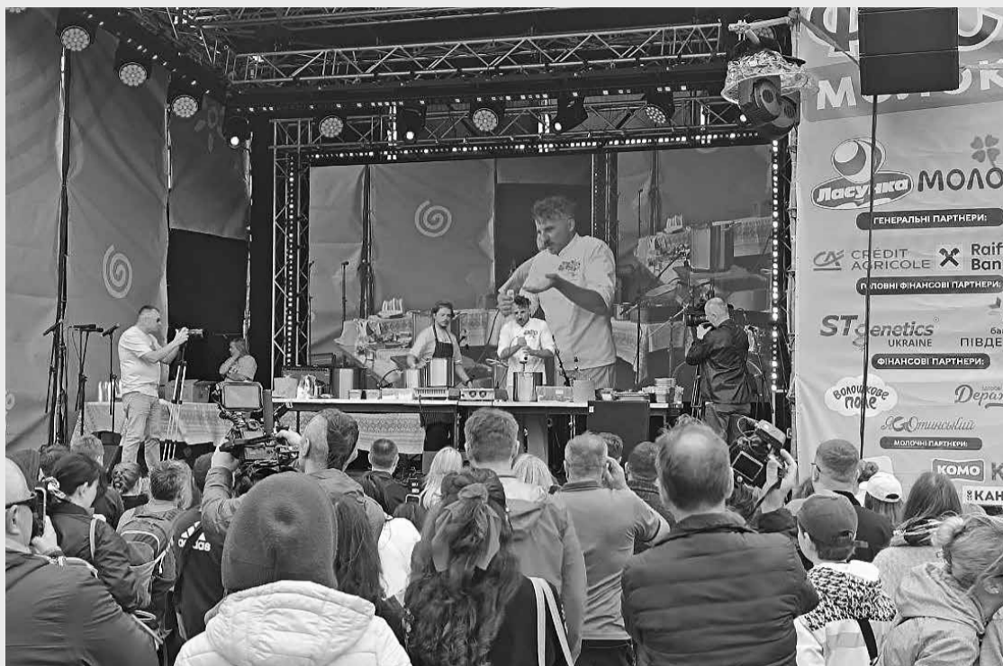
Рецепти приготування п'яти страв із молока показав Євген Клопотенко на великій сцені під час фестивалю

Пригощання від шеф-кухаря Євгена Клопотенка стали «родзинкою» фестивалю молока у Великому Ходачкові 31 травня. Відомий кулінарний експерт показав присутнім, як вдома приготувати п'ять простих, але вишуканих страв, використовуючи молоко.