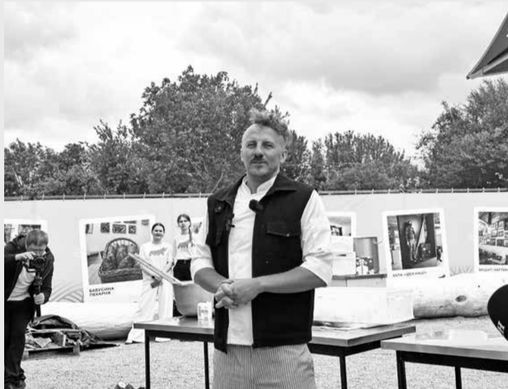
Шеф-кухар Євген Клопотенко приготував для учасників фестивалю качану кашу

стували фермерську продукцію, могли спробувати самостійно збити масло давнім українським способом, побачити, як варять крафтовий сир. У програмі також був майстерклас і частування від відомого кулінара Євгена Клопотенка.