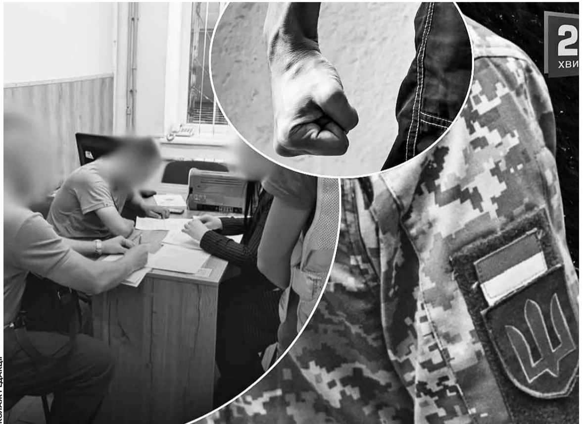
За даними декларації, до переведення на Тернопільщину військовослужбовець працював у Хмельницькому обласному ТЦК та СП

Окрім цього, у декларації зафіксовані численні виплати від онлайн-казино та букмекерських платформ. Серед джерел доходів — gaming-компанії та сервіси ставок, від яких декларант отримував бонуси, виграші або інші виплати. Саме ці операції привертають увагу, оскільки при відсутності майна у декларації є