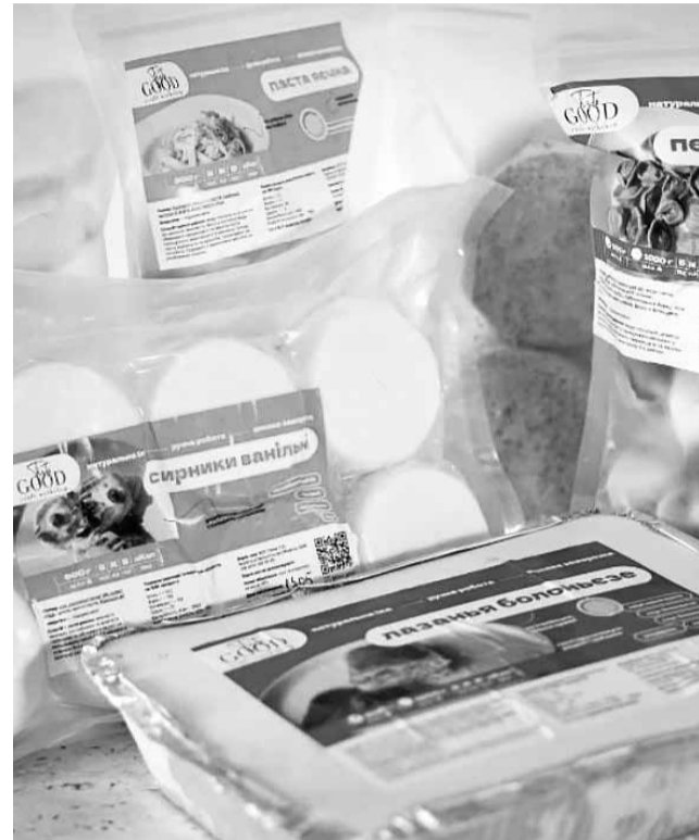
Ось у такі герметичні упаковки пакують продукцію – для кожного виробу своя