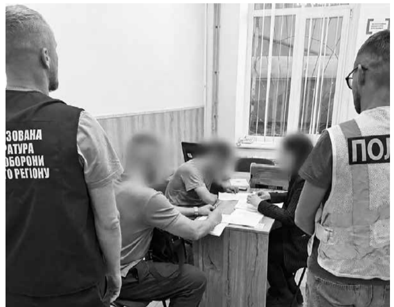
Поліцейські встановили причетність 30-річного фігуранта до побиття жителя Тернополя. За вчинене йому загрожує до 8 років позбавлення волі

З іншої постанови у Судовому реєстрі ми дізнаємося, що у 2022 році чоловік фігурував ще