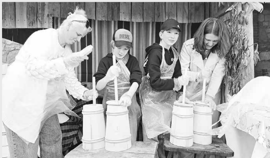
Відвідувачі фестивалю робили масло давнім способом на швидкість. Переможець забирав половину виробленого продукту

Відвідувачі відзначають, що подібні події допомагають краще зрозуміти та відчутти народний побут і ремесла.