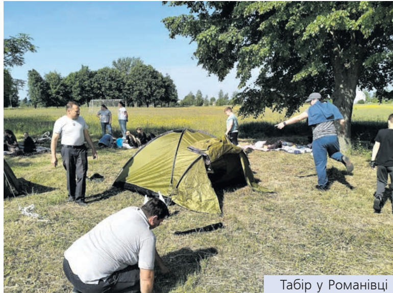
Табір у Романівці

Сьогодні інші часи, інші можливості, але організація прищільних таборів залишається традицією, яку й досі сповідають. А якщо взяти до уваги ті десять днів, упродовж яких у прищільних таборах кілька ліцеїв Романівщини вирувало справжнє дитяче дозвілля, то можна говорити про цілком повноцінний, гармонійно скомпонований і добротро продуманий дитячий відпочинок. Про який діти у Польщі, Німеччині, Данії чи Фінляндії можуть мріяти. Не дивуйтеся, бо такого у них немає. Батьки у більшості європейських країн спроможні