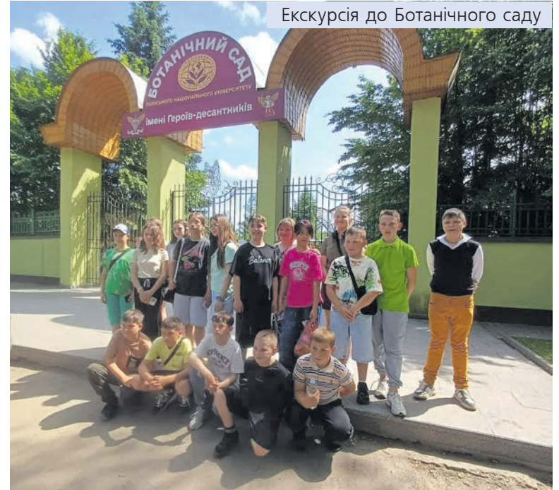
Екскурсія до Ботанічного саду

Так, табірні зміни у прищільних таборах довжиною у декаду стали минулим, про яке приємно згадувати і яке діти будуть довго пам'ятати.