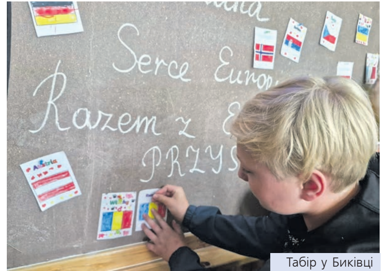
Табір у Биківці

та творчістю. Здавалося, дитвора отримує грандіозну компенсацію за раніше пережиті в обстановці дискомфорту сигнали тривоги і вимушені швидкі евакуації в укриттях та сховищах. Прищільний табір відпочинку іноземних мов у Биківському ліцеї «Сузір'я» можна вважати витвором педагогічної досконалості та бажання тримати своїх підопічних у тонусі пізнання, у бажанні бути кращими, мудрішими і, мабуть-таки, – добрішими. Прищільний табір «Мрія-2026» у Врублівському ліцеї також вражав і навіть зачаровував щоденними новаціями у розвагах, змаганнях, вмінні провести час весело і змістовно. Радував своїх відвідувачів і оздоровчо-відпочинковий табір у Романівському ліцеї № 2. Щоденна програма заходів вражала розкішшю впродовж днів, а поєднання відпочинку у цифровому форматі (куди ж без нього) із дозвіллям на природі, на галявині парку, на просторі стадіону захоплювала дітей куди сильніше, ніж грайливі атракціони Діснейленду.