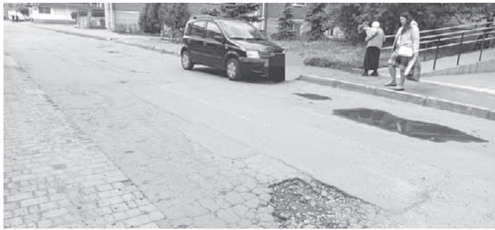
НА ЧУМАЦЬКИЙ ШЛЯХ ЗНАЙШЛИ ПІДРЯДНИКА