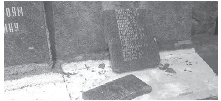
ДІТИ ПОБИЛИ ПЛИТУ НА БРАТСЬКІЙ МОГИЛІ