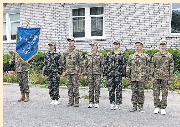
Захищало честь Романівщини «Камуфляжне серце»