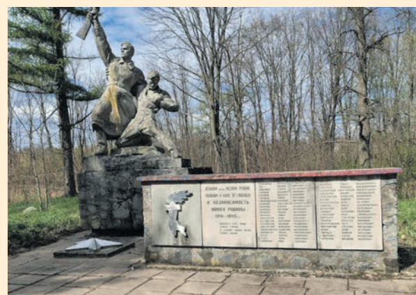
Герої не вмирають, якщо їх пам'ятають