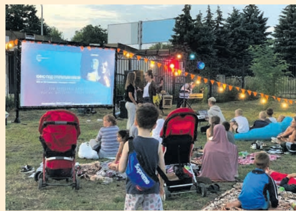
Кіно під відкритим небом – це і відпочинок, і комунікація

вість здійснення і реалізації того чи іншого проекту. Чи буде це облаштування молодіжного простору, чи стосуватиметься проект утеплення (санації) освітня приміщень, що вплине у майбутньому на економію затрат на енергоносії, – все одно громади мають обрати оптимальні варіанти реалізації проекту. А для цього треба зустрічатися із представниками фондів, треба знати їхні вимоги і треба пропонувати СЕБЕ, свою громаду як НАЙКРАЩИЙ ВАРІАНТ для міжнародної благодійної допомоги. Для цього треба тримати руку на пульсі життя міжнародних донорських організацій, які періодично організовують і проводять форуми та презентації своїх пропозицій.